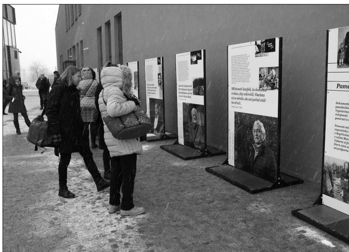
Výstava věnovaná listopadu 1989 v Kopřivnici bude v prostoru před vstupem do nového Muzea nákladních automobilů Tatra k vidění až do konce ledna.

V minulém čísle KN v článku „Porota vybrala nabídku developera pro lokalitu Západ“ na titulní straně došlo k chybě. V textu článku bylo chybně uvedeno: „k realizaci developerského záměru na pozemcích o výměře cca 17 hektarů“. Chybějící desetinná čárka výrazně změnila význam sdělení. Ve skutečnosti se v lokalitě Západ jedná o pozemky o výměře cca 1,7 ha. Redakce KN se čtenářům za chybu omlouvá.