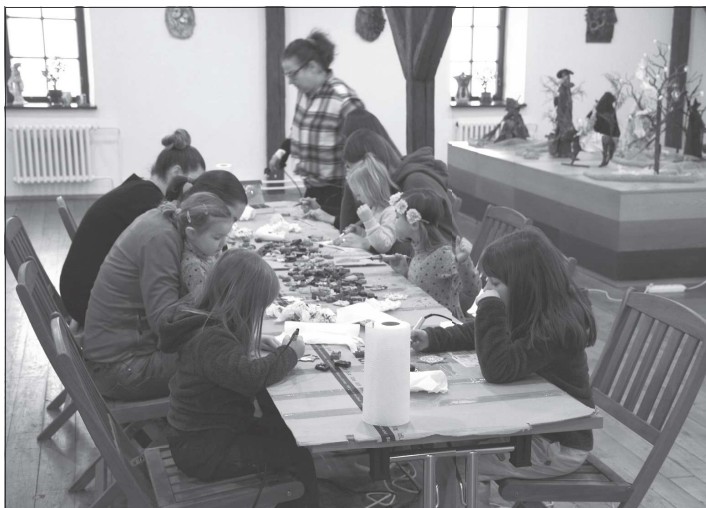
O vánoční workshop v malování technikou enkaustiky byl minulou sobotu dopoledne v Muzeu na Fojtství velký zájem. Lidé se na něm střídali od 10 do 16 hodin.