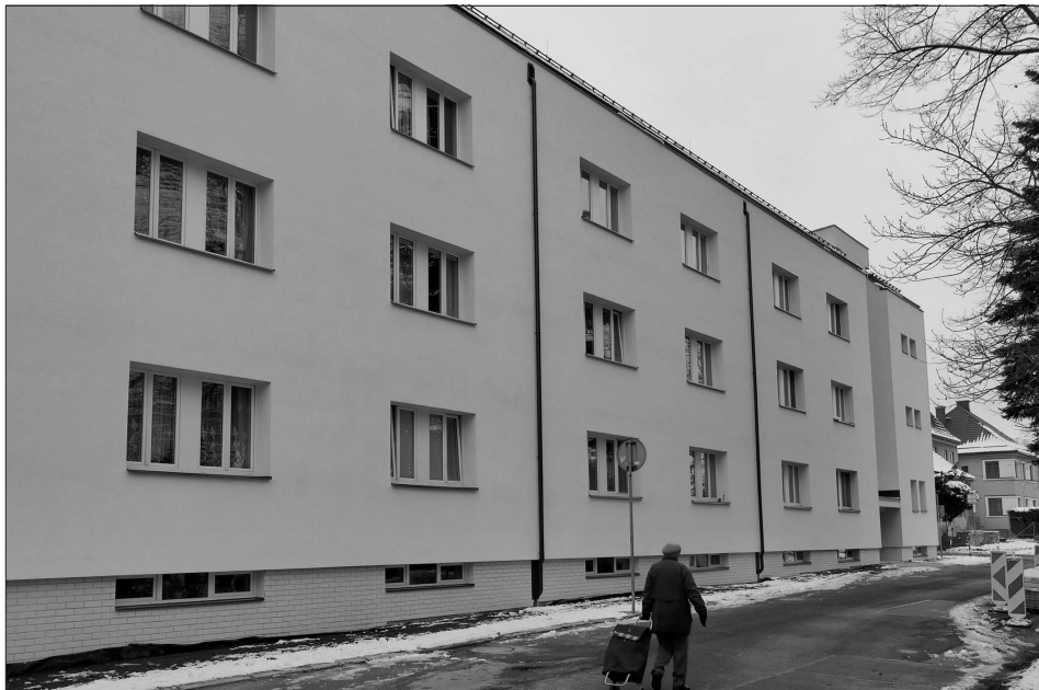
Zrekonstruovaný dům s byty zvláštního určení na Masarykově náměstí číslo 650. Opravy objektu byly dokončeny v původně plánovaném termínu. Další drobnější investice, jako například chodník u domu, budou následovat.

Pro rok 2022 je stanovena předběžná cena tepla pro odběratele s cenou na výstupu z objektové předávací stanice (OPS) na 480,16 koruny za gigajoule včetně DPH a cena pro odběratele, kteří mají svoji vlastní předávací stanici, bude cena tepla 395,29 koruny za gigajoule včetně DPH. (Pokračování na straně 3)