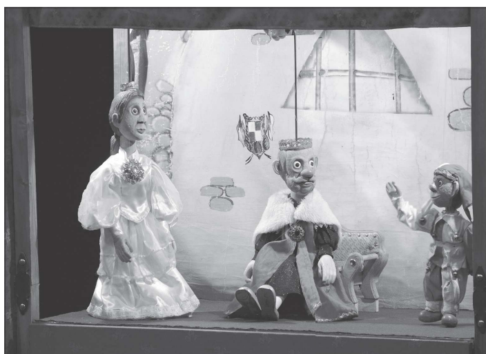
V minulém týdnu se děti diváci dočkali loutkového představení O princezně Rozmarílce v podobě Divadla Kašpárkův svět.

Duo dvou hereček připravuje zábavná dobrodružství plná překvapivých momentů. Jejich představení jsou interaktivní, nabitá tancem, soutěžemi, vtipem a neotřelých barevných kostýmů, používají prvky jarmarečního divadla i klauniády. Představení Poppy a Adélka slaví Vánoce trochu jinak je postaveno na známých i méně známých vánočních zvycích, které dětem i jejich doprovodu navodí tu správnou atmosféru a je tou pravou zábavou na poslední adventní neděli.