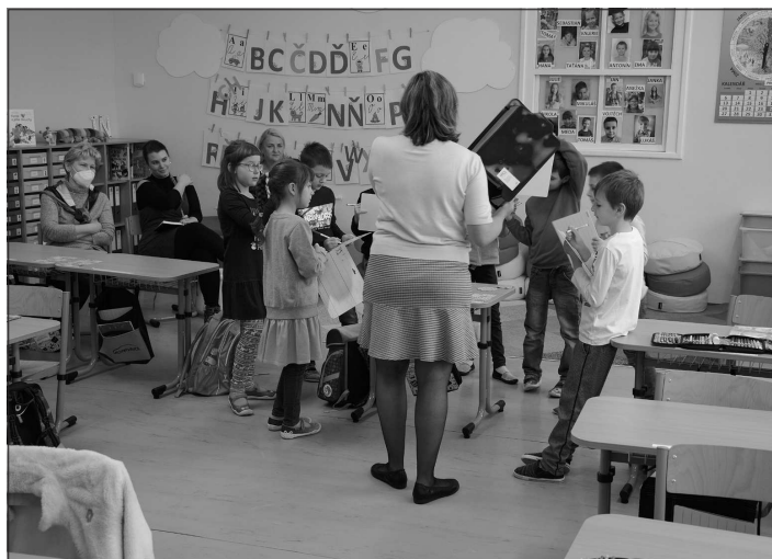
Vyučující z mateřských škol měli možnost v hodinách sledovat moderní výukové metody uplatňované ve třídách s rozšířenou výukou jazyků, matematiky a logiky.

Realizace rekonstrukce bude samozřejmě mít vliv i na běžný provoz nádraží. Základní služby jako prodej jízdenek, čekárna či veřejné toalety, po určité části rekonstrukce v mobilních buňkách, ale budou zajištěny. Vyhrazen bude koridor pro příchod cestujících k vlakům. Výluky ani náhradní autobusová doprava se v souvislosti s rekonstrukcí kopřivnického nádraží nepředpokládají.