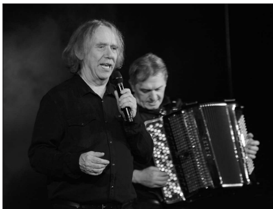
Jaromír Nohavica se svými spoluhráči bavil vyprodaný velký sál kulturního domu.