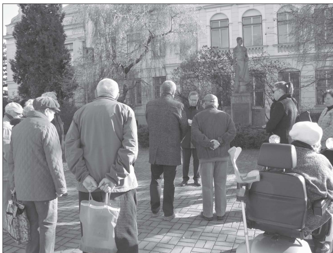
Jedenáctého listopadu hodinu před polednem si i v Kopřivnici připomněli lidé Den válečných veteránů.

„Od ledna se zatím ve stávajícím parkovacím systému nic měnit nebude, i když odbor rozvoje města neustále sbírá podněty od občanů. Těmi se bude rada města zabývat v prvním čtvrtletí roku 2022. Dá se předpokládat, že od 1. července 2022 by začala platit mírně upravená nová pravidla, ve kterých bude pravděpodobně rozšířen počet subjektů, kteří dosáhnou na užívání těchto parkovacích karet, a také budou upřesněna pravidla pro dočasné odstavování vozidel firem zajišťujících stavební práce v lokalitě. Město i na základě podnětů od občanů také uvažuje o rozšíření území, např. o ulici Lidickou či parkoviště vedle OSBD,“ uvedl Milan Šmíd, vedoucí oddělení rozvoje území na kopřivnické radnici. Radnice majitelé stávajících parkovacích karet vybízí, aby výměnu karet neodkládali na samotný konec roku. „Kartu si lidé mohou již nyní zakoupit dle schváleného ceníku. Ceny karet se nemění, například celoroční rezidentní karta pro první vozidlo žadatele stojí 100 Kč. Ceník, schválený radou města, je k dispozici na webových stránkách města Kopřivnice v sekci parkovací karty,“ dodal Milan Šmíd.