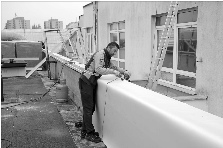
I díky počasí postupují práce na havarijních opravách dvou nejspokojenějších částí střechy kulturního domu poměrně rychle. Dokončeny by mohly být už na přelomu listopadu a prosince.