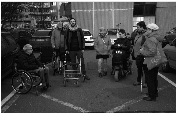
Další z tematických procházek se zaměřila na často nezfetelné bariéry, které při pohybu městem musejí překonávat lidé s tělesným handicapem.