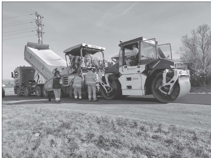
Rekonstrukce povrchu komunikace na ulici K Očínmu navázala na opravy provedené v nedávné době. Tentokrát firma Swietelsky stavební, s. r. o., opravovala úsek dlouhý cca 460 m. Kompletní práce by měly být na této komunikaci dokončeny v těchto dnech.