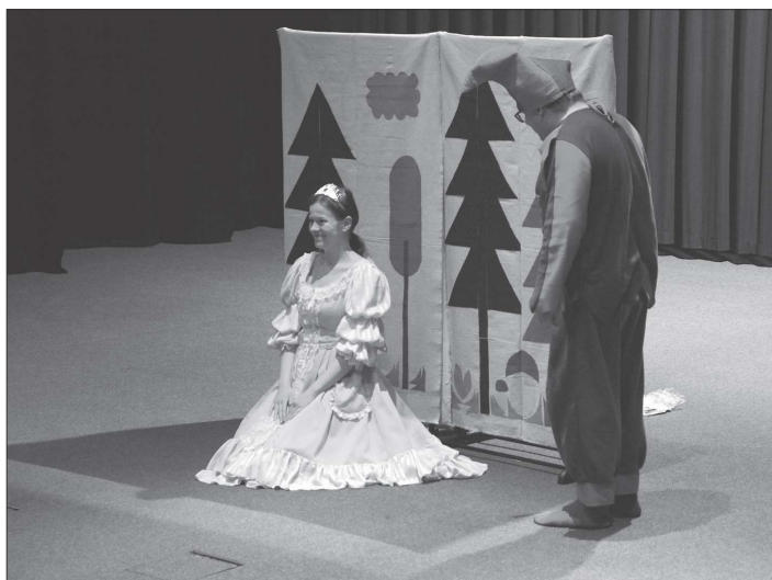
Další nedělní divadelní představení pro děti nabídlo pohádku Princezna Čokoláda z repertoáru Dobře naladěného divadla.