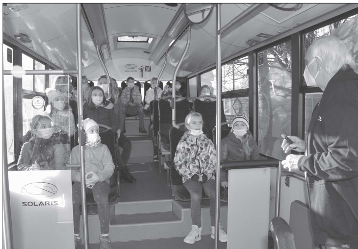
Autobus přijel za školáky do Lubiny. Přimo v jeho interiéru se žáci dozvěděli informace o ekologických přínosech hromadné dopravy.

Zhruba půldruhé hodiny trávající procházku její účastníci uzavřeli punčem a posezením v prostoru Galerie Galaxie, kde měli organizátoři připravenou rovněž projekci dobrých případů bezbariérového řešení veřejného prostoru ve vybraných městech v zahraničí.