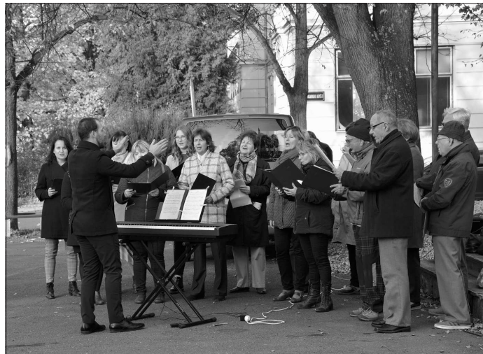
Po pauze vyvolané covidovými opatřeními se opět Pěvecký sbor Kopřivnice postaral o kulturní část vzpomínkové akce k výročí vzniku ČR.