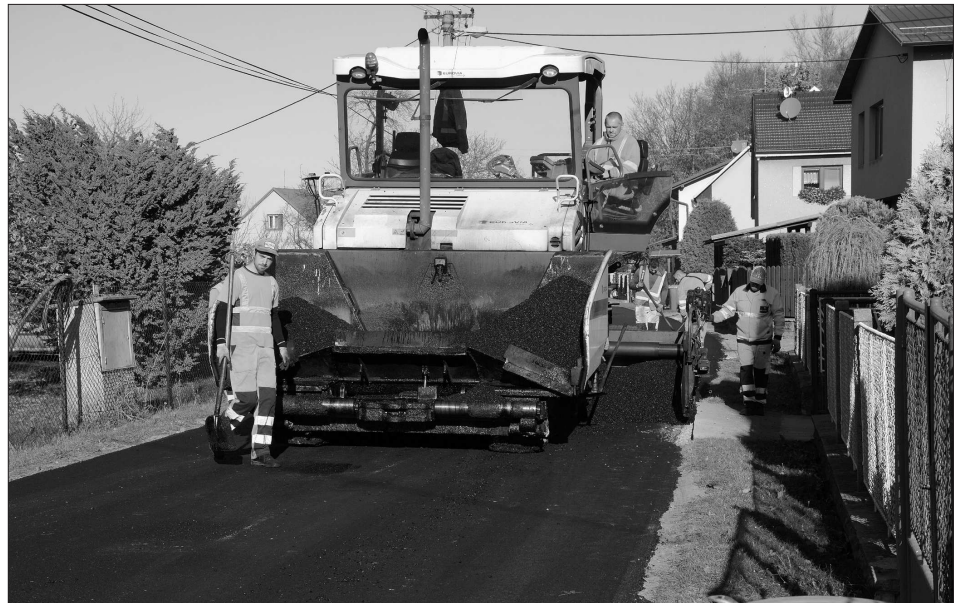
Práce na budování kanalizace ve Vlčovicích se chýlí ke konci. Rozkopané místní komunikace se v těchto dnech dočkaly nového povrchu.