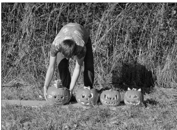
Devět lidí se zapojilo do soutěže vyhlášené spolkem Vlčovjan a na drakiádu 28. října přinesli své nazdobené dýně.