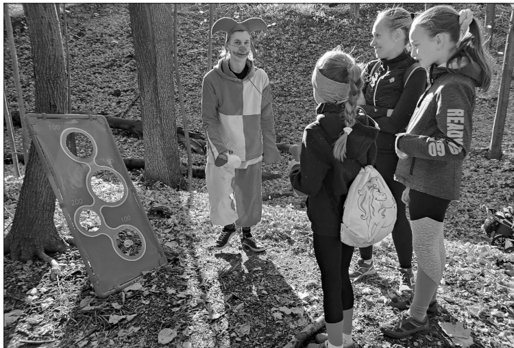
Především díky krásnému počasí dosáhl letošní ročník Strašidel na Šostýně rekordního počtu účastníků. Během odpoledne jich trasu se 7 úkolů prošlo na pět set.

Děti se během cesty od Husovy lípy na Šostýn potkaly s vodníkem, čarodějnicemi, vilou nebo bílou paní, ale pomáhaly i králi s princeznou nebo se oháněly sekerou v zastoupení útlocitného kata. Místo původně plánovaných osmi stanovišť bylo k dispozici jen sedm, ale i tak byli lidé spokojeni a akci si vesměs chválili. Náladu příchozím nezkalilo ani to, že minimálně na dvou stanovištích museli kvůli vysokému zájmu dlouhé minuty čekat ve frontě.