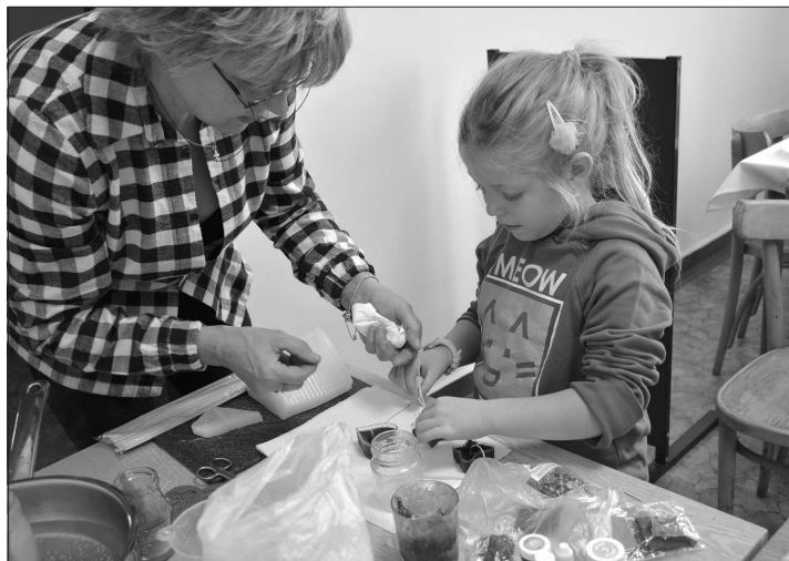
V rámci rukodělného jarmarku, který se konal o víkend v objektu Vlčovjana, probíhaly workshopy, na nichž si děti mohly vyrobit svíčku, mýdlo či vánoční ozdoby.