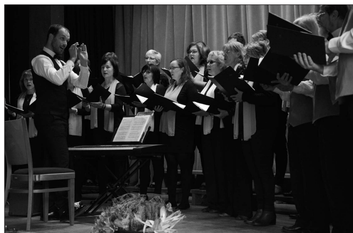
Pěvecké sdružení Kopřivnice hostilo na tradiční přehlídce pěveckých sborů novojičínský Ondráš a vokální kvarteto No Timers. Ohlášení Porubští Trubačí nakonec dorazit nemohli.

Kopřivnicáné budou mít možnost autorku výstavy potkat v rámci vernisáže ve středu 3. listopadu od 15 hodin. Výstava samotná pak bude přístupná každý všední den kromě středy vždy od 7.30 do 12 a od 13 do 18 hodin.