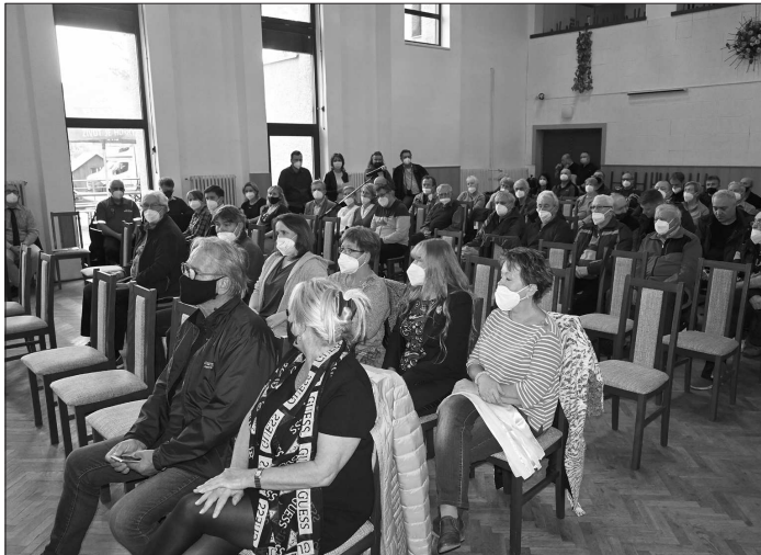
Na setkání s vedením města, která proběhla v minulém týdnu, přišlo nejvíce lidí do Mniší. Důvodem byla probíhající stavba splaškové kanalizace.

Daleko víc peněz se vybralo 30. září a 1. října, kdy se knihovna letos poprvé zapojila do 25. ročníku tradiční veřejné sbírky Ligy proti rakovině Praha. „Český den proti rakovině podpořili nejen naši čtenáři, pracovníci knihovny a informačního centra, ale i lidé, kteří nepotkali dobrovolníky s kytičkami v ulicích a přišli k nám do knihovny. Celkem bylo zakoupeno 97 kytiček a organizátorům sbírky jsme poslali 3 556 korun,“ upřesnila výtežek druhé sbírky vedoucí městské knihovny, která zároveň i poděkovala všem dárcům za finanční podporu.