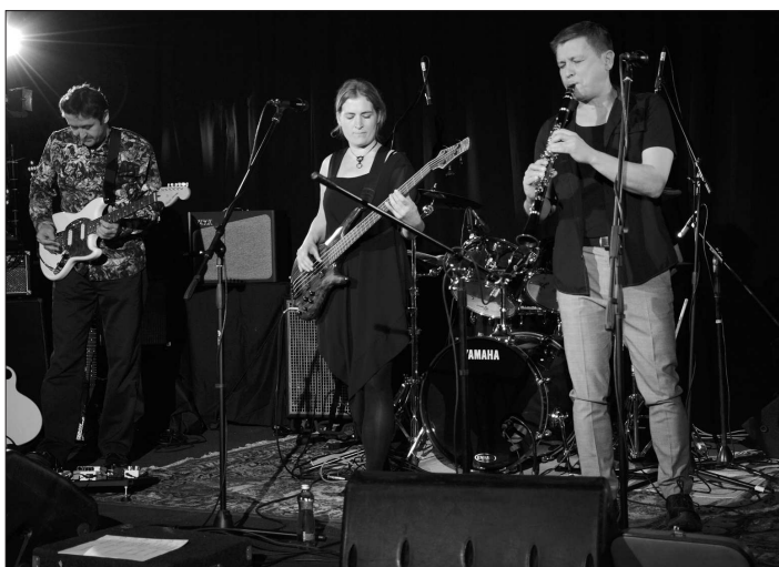
Kapela Nekola s hosty zahájila sobotní koncertní trojboj v kopřivnickém Katolickém domě. Kromě ní návštěvníci slyšeli i skupiny Drutty a Panenské plameny.