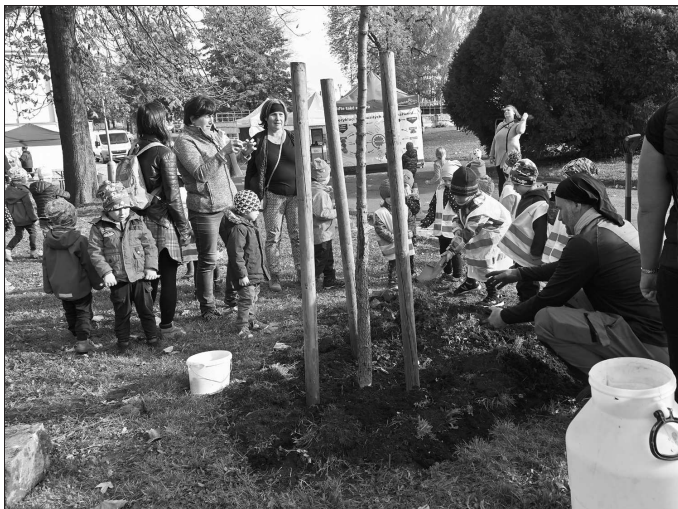
V rámci akce k svátku stromů a Dni Země byl v sadě E. Beneše vysazen nový strom. Podílet se na výsadbě mohly i děti z místních mateřských škol.