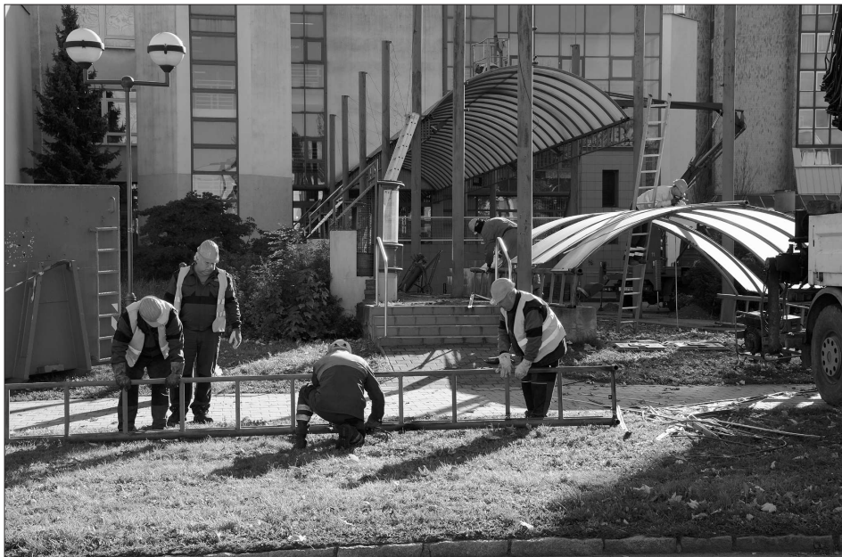
V minulém týdnu začala postupná demontáž přístřešku, pod kterým stávala Slovenská strelka. Brněnské architektonické studio zároveň dokončuje projekt budoucí úpravy okolí technického muzea.