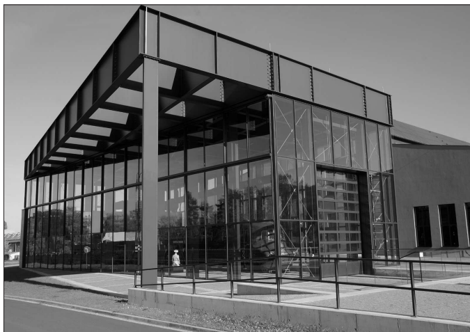
Výstavní depozitář Slovenské strelly je jednou z deseti staveb v celé České republice, které se mohou pyšnit titulem Stavba roku 2021.

Nově se radnice v této době již vážně zabírá měřem na vybudování lávky pro pěší přes řeku. „V dané lokalitě by se příští rok již konečně měly rozeběhnout přípravné práce, jejichž cílem by měla být nejprve vyhledávací studie, která zodpoví zásadní otázku, tedy otázku možného reálného umístění lávky pro pěší vedle stávajícího mostu. Požadavky na konkrétní technické parametry lávky dá pochopitelně až následná projektová dokumentace, která však z vyhledávací studie bude muset vycházet,“ uzavřel Dušan Krompolec