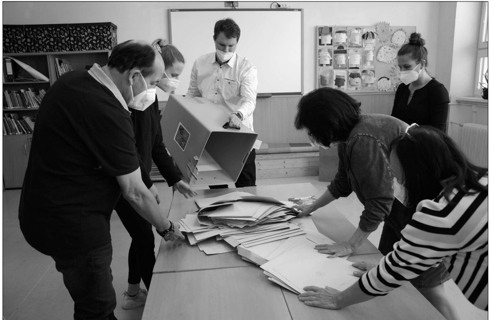
V sobotu krátce po 14. hodině začalo v celé republice sčítání volebních listků. Výjimkou nebyl ani volební okrsek č. 8 ve škole Emila Zátopyka v Kopřivnici.