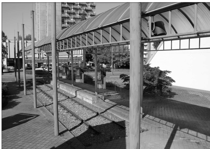
V příštím týdnu má začít demontáž přístřešku a kolejového svršku, který před víc než dvěma lety opustila Slovenská strela.

Proměnu prostoru nejen před vstupem do muzea, ale i v okolí celé budovy aktuálně zpracovávají architekti brněnské studia m2au. Projektová dokumentace vycházející ze studie už dříve prezentované veřejnosti je aktuálně před dokončením. Odbor rozvoje města pak bude hledat možnosti rozpočtové či externího financování realizace úprav.