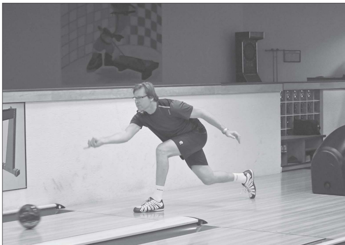
V polovině května se po dvou přerušeniích opět rozběhla Kopřivnická bowlingová liga, na programu byla standardní kola i dohrávky.

Tabulku Kopřivnické ligy ovlivňuje nestejný počet zápasů týmů, nicméně pořadí na prvních třech příčkách se od prosincové přestávky nezměnilo. V čele jsou se 76 body Pitbulové, kteří v šestém kole porazili druhý celek soutěže Lvy a v dalším kole také šestý tým BCS Heimat Juniors, k tomu mají ještě dvě hry k dobru. Lvi mají na kontě 66,5 b., porazili Black Horse, ale podlehli čtvrtým Závěšicím a již zmiňovaným Pit-