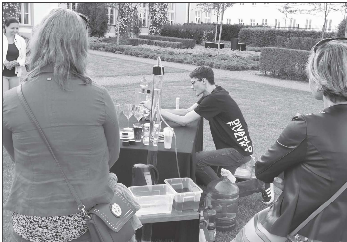
Součástí závěrečné konference projektu MAP v Piaristických zahradách v Příboře bylo i vystoupení Úžasného Divadla Fyziky.