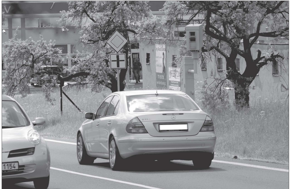
Radní schválili nákup nového stacionárního radaru. Osazeny technikou budou dvě ze tří stanic ve městě. Instalace radarů má zklidnit dopravu.

„Dosavadní zkušenosti ukazují, že nasazení radaru v Kopřivnici skutečně výrazně přispělo ke zklidnění dopravy v kritických místech, kde často docházelo i k nebezpečnému překračování rychlosti, což mělo za následek i nehody s vážnými následky,“ říká místostarosta Dušan Krompolec, odpovědný mimo jiné i za oblast místních záležitostí veřejného pořádku, a tedy i za oblast bezpečnosti ve městě. Město se podle jeho slov rozhodlo v tuto chvíli jít cestou pořízení dalšího radarového měřiče rychlosti vozidel, a ne budování dalších stanic na cest, které, ač neobsazené, mají neoddiskutovatelný preventivní účinek na snižování rychlosti. „Budování dalších radarových stanic je nejen nákladné, ale i náročné po administrativní, organizační a časové stránce, i když nevylučuji, že v budoucnu další přibudou. Nyní jsme se rozhodli jako město vyhovět množícím se požadavkům občanů na zklidnění dopravy, a to i cestou zabezpečení měření rychlosti,“ říká místostarosta Krompolec s tím, že nákup radaru je motivován snahou o zvýšení bezpečnosti chodců i motoristů ve městě, a ne o příjem z případných pokut. V oblasti neohodnotěnosti se totiž v Kopřivnici nevymyká stávající situace na Novojičínku, když hlavními příčinami dopravních nehod byly vloni definovány způsob jízdy, nedání přednosti a právě nepřiměřená rychlost. (Pokračování na str. 3)