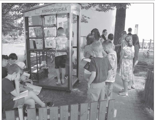
Knihobudka u ZŠ v Lubině už slouží čtenářům, kteří se rekrutují nejen z řad tamních žáků.