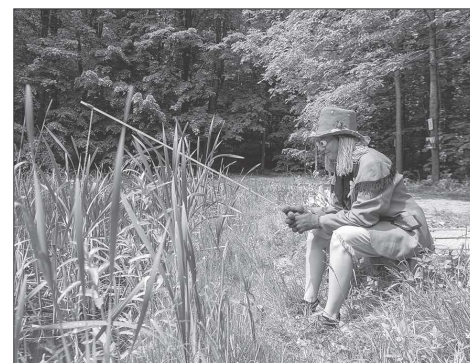
V Pohádkovém lese děti plnily celkem 19 úkolů. Jeden z nich byl v režii vodníka.