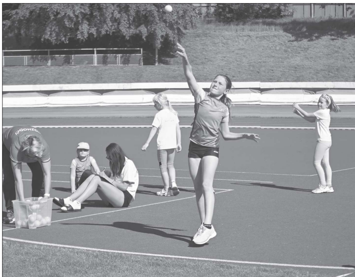
První velkou atletickou akcí pro mládež byl na zrekonstruovaném stadionu Emila Zátopka celorepublikový projekt Atleti spolu.

Z důvodu koronavirové pandemie, která vlou na jaře nedovolila zahájit nový ročník Oblastního přeboru, se změnil systém soutěže na podzim-jaro. Na podzim se však stihly odehrát ze šesti čtyři kola a s pěti jarními tak zbývá odehrát celkem sedm kol. V úbec pak nebyl zahájen Oblastní pohár, jehož finále bylo původně na programu tuto sobotu. Tabulku Oblastního přeboru vede s plným počtem bodů mužstvo 1.FC Bari, druhý je s devíti body RS Team, má však zápas k dobru, a devět bodů má rovněž celek na třetí příčce TUZE-MÁCI.