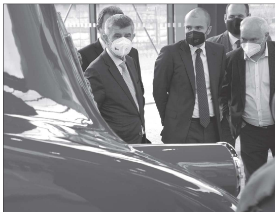
Premiér A. Babiš si v doprovodu majitelů a managementu Tatry prohlédl Slovenskou strelku, která jej z města odvezla.

Kopřivnice (dam) – Kopřivnice byla 1. června poslední zastávkou premiérových návštěv v Moravskoslezském kraje. Po Trineckých železárnách či Hyundai v Nošovicích předseda vlády Andrej Babiš zavítal i do kopřivnické Tatry. Premiér, který dorazil krátce po 17. hodině, si sice prohlédl přistavené současné výrobky Tatry Trucks i Tatra Defence Vehicle, ale větší část návštěvy věnoval slavné historii kopřivnické značky. Nejprve mu hostitelé odprezentovali exteriér i interiéry renovované Slovenské strelky a následně si se svým doprovodem prošel rozestavěnou expozici Muzea nákladních automobilů Tatry. (Pokračování na straně 2)