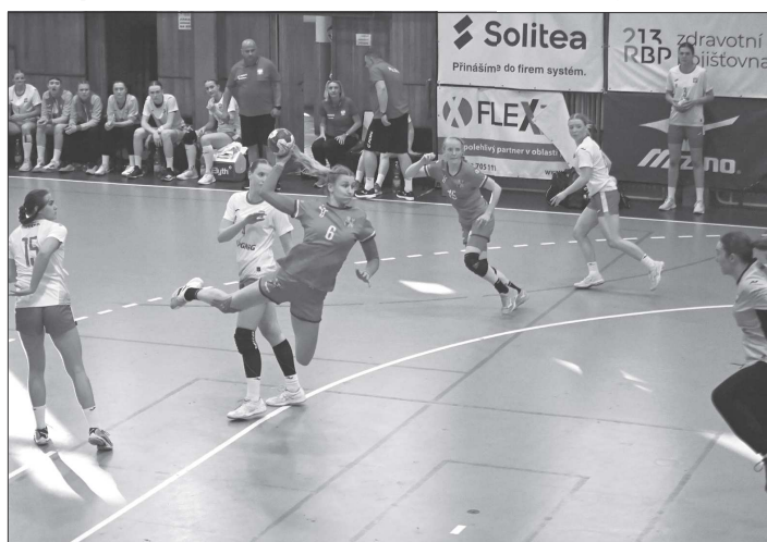
V rámci přípravného kempu v Kopřivnici sehrály juniorky házenkářské reprezentace ČR dvě utkání proti Polsku, obě prohrály.

Na EURO, které proběhne od 8. do 18. července v Celje ve Slovinsku, čeká juniorský výběr ČR v základní skupině Maďarsko, Norsko a Rumunsko. „Informace o těchto týmech se špatně shání, protože se rok nehrála mezinárodní utkání. Nicméně máme ve skupině historicky velmi úspěšné země. Bude to náročné, ale věřím, že holky zabojují o ta dvě postupová místa,“ dodal Dušan Poloz.