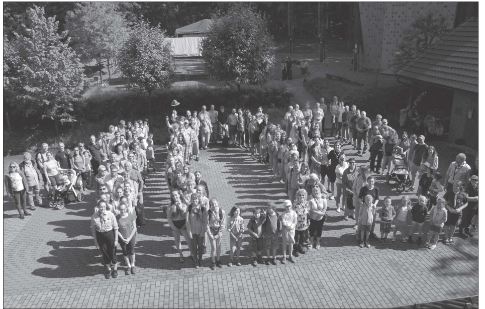
Současní a bývalí členové místních skautských oddílů společně s příznivci skautingu a jeho myslence minulou sobotu slavili sté výročí Junáka v Kopřivnici.

Kopřivnice (hod) – V polovině června se v závislosti na počasí rozjedou stavební práce na Šostýně. Společnost Unistad, spol. s r. o., ze Suchdolu nad Odrou začne provádět statické zajištění části jihovýchodní suterénní zdi bývalého paláce Šostýna. Až do konce září tak musí lidé, kteří navštíví Šostýn, počítat s omezením pohybu. „V rámci veřejné zakázky jsme oslovili šest firem, ale svou nabídku poslaly pouze tři. Z nich byla vybrána firma Unistad, která se zavázala provést práce za 586,6 tisíce korun,“ uvedla Marcela Podešvová z odboru majetku města. (Pokračování na straně 2)