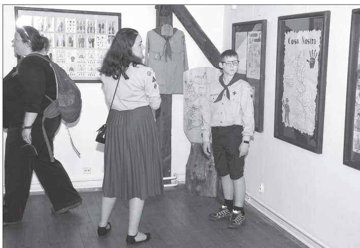
Výstava Po stopách kopřivnického skautingu zahájena před týdnem na Fojtství se neomezuje pouze na výstavní prostor nebo areál muzea.