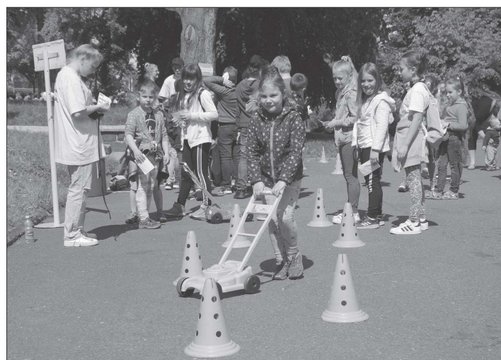
DEN DĚTÍ V PARKU: Den dětí, který minulý úterý pořádal Kulturní dům Kopřivnice společně s domem dětí byl po dlouhých měsících první akcí s přímou účastí veřejnosti. To se určitě odrazilo i na zájmu. Během dopoledne si sedm stanovišť s jednoduchými soutěžními úkoly prošlo cca 600 dětí z místních mateřských a základních škol. Odpoledne si pak úkoly v parku vyzkoušelo a drobnou odměnu odneslo dalších 400 dětí.

Skauti prokázali nevšední dávku originality a invence, když své hosty na památku vybavili upomínkovou lžičkou s novým logem vzniklým u příležitosti 100. výročí kopřivnického Junáka, tedy skautskou lilii na kopřivovém listu. Stejně logo si mohli návštěvníci odnést také na pestrobarevných ponožkách. Filatelisté pak mohli ocenit aršíky s příležitostnými známkami.