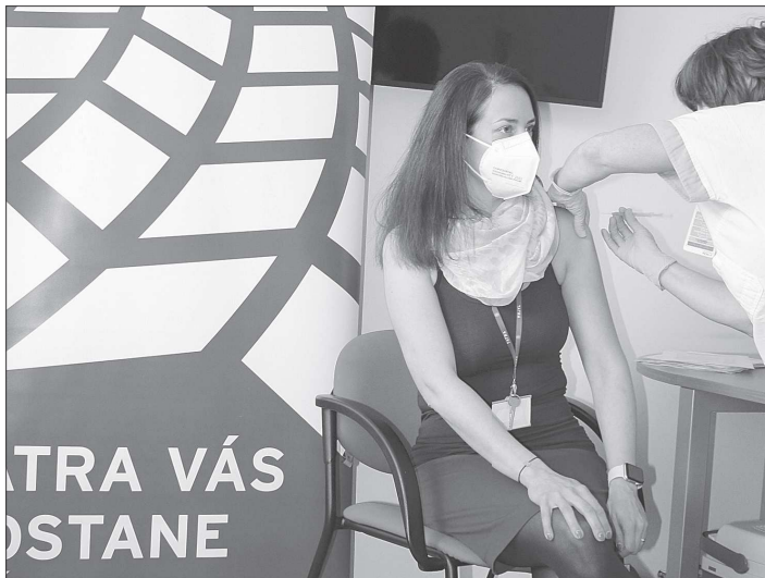
Na konci minulého týdne bylo spuštěno očkování zaměstnanců v automobilce Tatra. Možnost aplikace vakcíny nabývaly i další větší podniky ve městě.