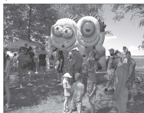
Den dětí pořádaný v neděli na hrázi Větrkovicé přehradě lákal nejen na nafukovací hrad.