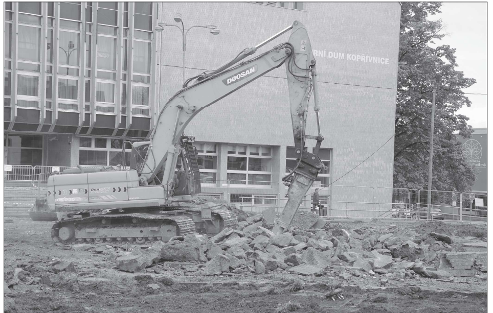
Část materiálu z demolic se po recyklaci vrátí zpět do centra Kopřivnice. Odtěžená suť se bude zpracovávat na recyklačním dvoře umístěném za supermarketem Tesco.