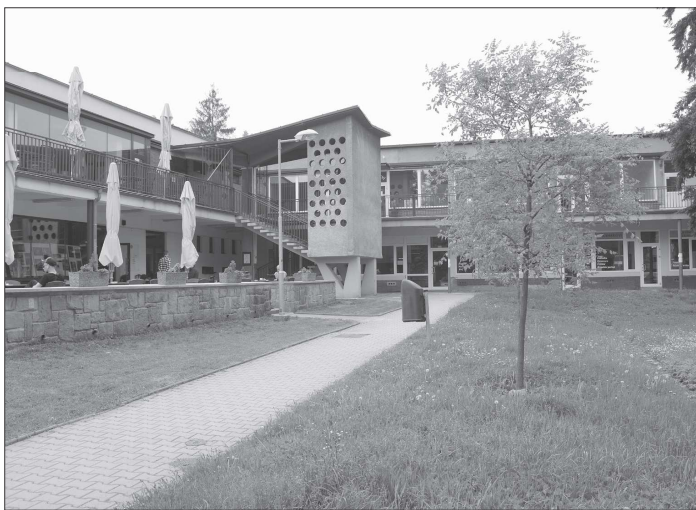
Rekonstrukce vnitřních rozvodů v multifunkčním objektu na ulici Školní se chýlí k závěru. Radnice už spráda plány na opravu schodiště i úpravy okolních ploch.