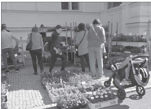
Největší zájem na prvním farmářském trhu konaném v parku E. Beneše byl o sazenice zeleniny i květin.

Kopřivnice (hod) – V pátek 21. května po delší době ožil park E. Beneše. Město pořádalo první letošní farmářský trh, na kterém nabízela zhruba čtyřicetka prodejců své výpěstky, pečivo či regionální výrobky. Trh přilákal stovky zájemců. Největší zájem byl vzhledem k ročnímu období o sazenice zeleniny i květin. Lidé si kupovali nejen koláče, chléb, tyčinky, sýry, uzeniny, koření, ale i mýdla, svíčky a další produkty regionálních výrobců. Další farmářský trh se na stejném místě uskuteční 25. června.