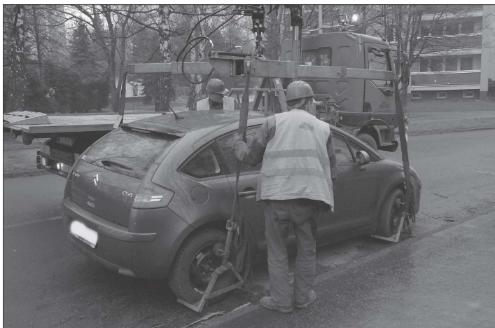
Počet odtahů realizovaných v souvislosti s jarním úklidem kopřivnických ulic v posledních letech stoupá.