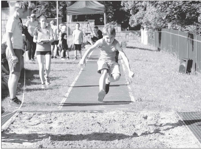
Atletický klub E. Zátópka Kopřivnice pořádal na hřišti ZŠ Alšova za účasti celkem 15 družstev třetí kolo Atletické ligy minipřípravky.

Třetí kolo své dlouhodobé soutěže měla také přípravnice, která závodila v Beskydském poháru přípravky ve čtvrtek 25.