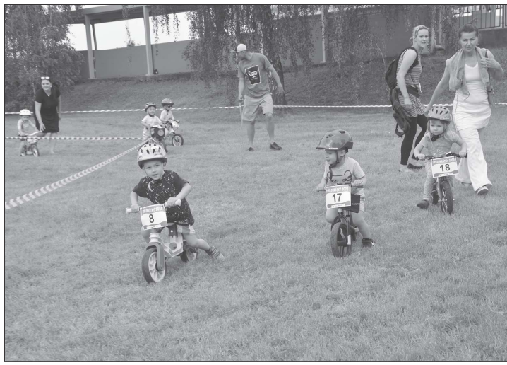
Nejpočetnější skupinou závodníků Cyklohrátek byly tradičně nejmenší děti na odrážedlech, kterých trať absolvovalo pětadvacet.

O závěrečnou tečku se postarali členové místního spolku Smiling dog s ukázkami canisterapie a práce s asistenčními psy. To ocenili především nejmenší účastníci, kteří se ochotně nabízejí při ukázkách práce i polohování.