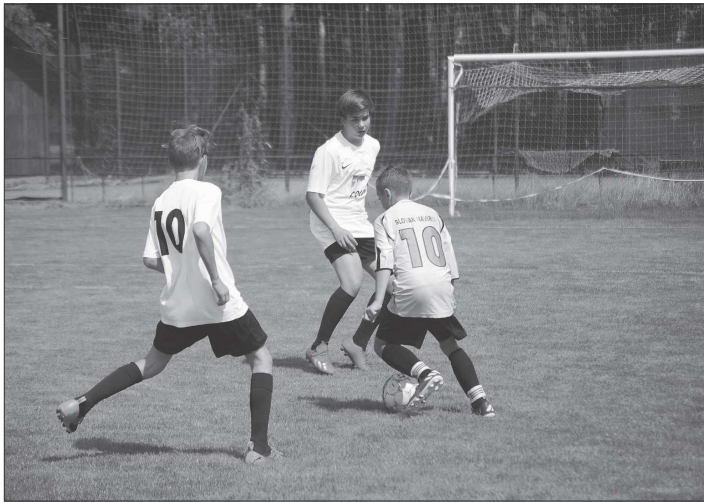
Vlčovičtí fotbalisté (vlevo) podlehli ve skupině obhájci prvenství v turnaji Slovanu Havířov, který nakonec skončil druhý.