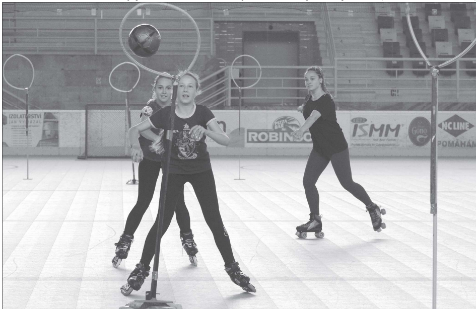
Novinkou letošních prázdnin je akce Pojd' se bavit. Každé prázdninové úterý mohou místní teenageři vyrazit na některé z kopřivnických sportovišť. Sedmého července si například na ploše zimního stadionu mohli vyzkoušet hru inspirovanou famfrpálem ze světa Harryho Pottera.

Nyní budou odborní pracovníci radnice všechny návrhy posuzovat z hlediska realizovatelnosti a deklarované finanční náročnosti. „Na konci prázdnin Komise pro projekt Zdravé město a MA21 na základě vyjádření odborů města a dotčených organizací rozhodne, které z návrhů mohou předkladatelé osobně představit na jedné z podzimních městských akcí, a tím Kopřivničany seznámit se svými vizemi, případně které dále postoupit nemohou. Po této veřejné prezentaci bude spuštěno očekávané veřejné hlasování,“ upřesnila Ivana Holubová. (Pokračování na straně 2)