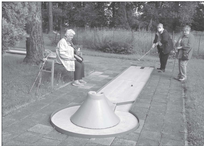
Od jamky k jamce byla první pokoronavirovou akcí, kterou pořádala kopřivnická radnice pro seniory.

nízké úrovni a její růst nekopíruje prudký propad ekonomiky v důsledku koronavirové krize. Hospodářští odborníci varují, že zhoršení situace mohou přinést podzimní měsíce. Pro Kopřivnicko, do značné míry závislé na automobilovém průmyslu, není dobrou zprávou ani to, že právě toto odvětví ekonomiky zažívá pomalejší oživení než jiné segmenty průmyslu.