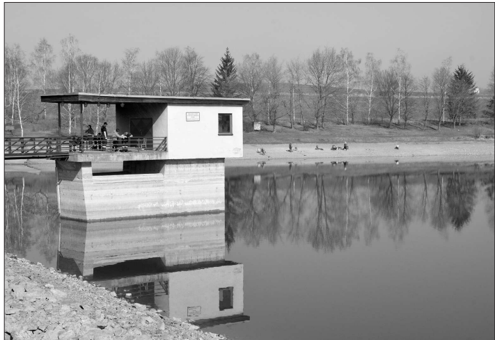
Klesající naplněnost Větrkovické nádrže je patrná nejen na vzdálenosti hladiny od přepadu, ale i rozšiřujících se plázech.

Případné dočerpání vody z řeky Lubiny by ovšem pro rekreační využití přehrady nemuselo být nutné pozitivním krokem. Pokud totiž Větrkovice spoléhají na dešťové srážky a přítok v podobě sice nevydatného, ale minimálně znečištěného Svěceného potoka, mohou se pyšnit relativně čistou vodou. Pokud by ovšem do nádrže byla ve velkém objemu dočerpána voda z Lubiny, která je zatížena podstatně větším znečištěním, mohlo by docházet k rychlejšímu množení škodlivých mikroorganismů a k snižování kvality vody ke koupání.