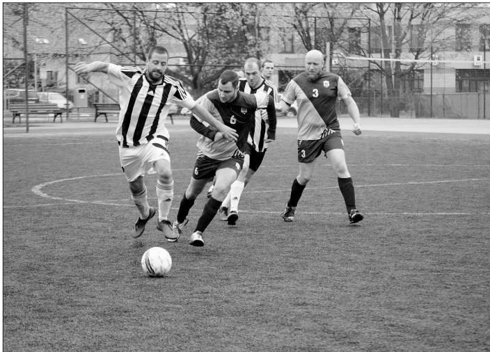
V sobotu 6. dubna začala sezona Oblastního přeboru v malém fotbale. Na fotce týmy SAFARI Kopřivnice (v pruhovaných dresech) a FC Legion.

Kopřivnice (cab) – V sobotu 6. dubna byl na hřišti ZŠ M. Horákové zahájen XXXII. ročník Oblastního přeboru v malém fotbale, do kterého se letos přihlásilo patnáct mužstev. Celkem sehraji patnáct kol a poslední turnaj je na programu v sobotu 26. října. Do sezony vítězství vstoupily týmy I. FC Bari, FC ŠPUNTY 97, Lokomotiva Gangsters, SAFARI Kopřivnice, FC Baník Orel Štamberk, Gunners Kopřivnice a FC Dábelská Jelita, RS Team měl jako lichý účastník tentokrát volno. Kromě ligových zápasů také v tomto roce proběhne Oblastní pohár (XXIX. ročník), jehož první kolo se odehraje v sobotu 4. října.