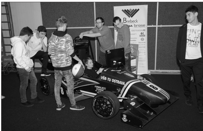
Přehlídka technických profesí letos lákala i na atraktivní expozici VŠB - TU Ostrava, která v Kopřivnici vystavovala například formuli, již postavili její studenti.

K o p ř i v n i c e (dam) – Celkem 14 různých profesí od mechanika strojů a zařízení, přes obráběče kovů, autolakýrníka, po truhláře, tesaře nebo zedníka a další obory, jejichž studium nabízí zdejší VOŠ, SOŠ a SOU Kopřivnice a Střední škola technická a zemědělská Nový Jičín představila v polovině minulého týdne tradiční přehlídku technických profesí Remeslo má zlaté dno.