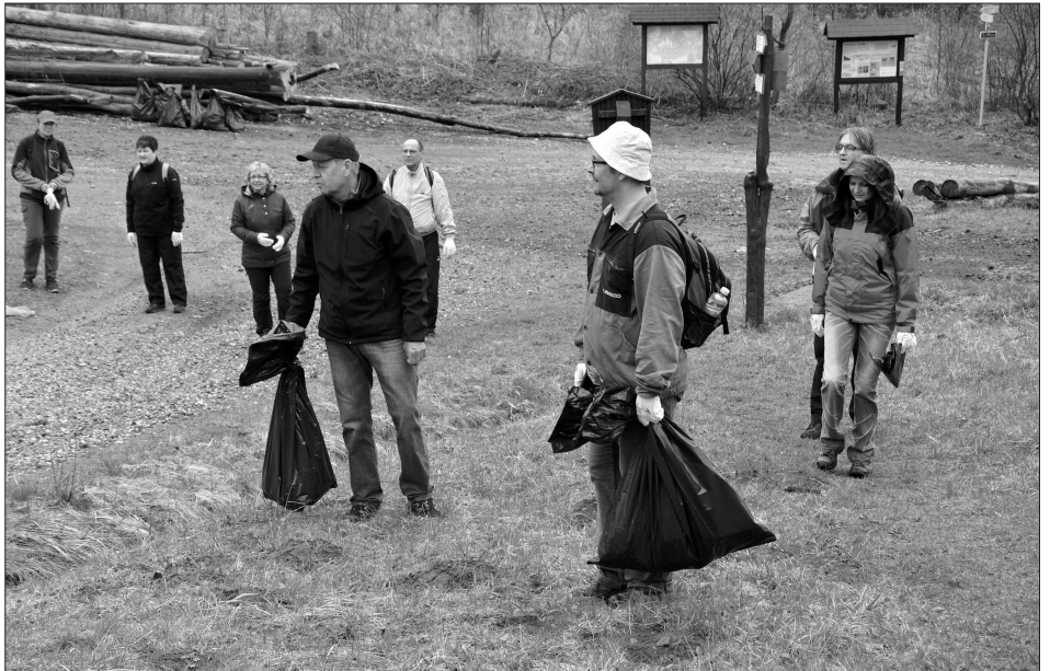
Bezmála 160 lidí se v sobotu 6. dubna zapojilo do celostátní dobrovolnické akce Uklid'me Česko. V přírodních lokalitách v okolí Kopřivnice nasbírali zhruba tři tuny odpadků.