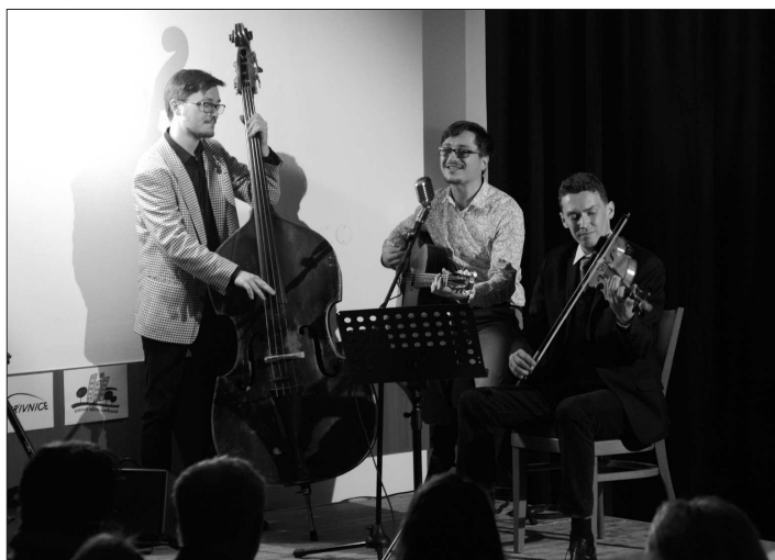
O hudební část vzpomínání na skladatele Zdeňka Petra se v malém sále Katolického domu postaralo trio Swingalia.