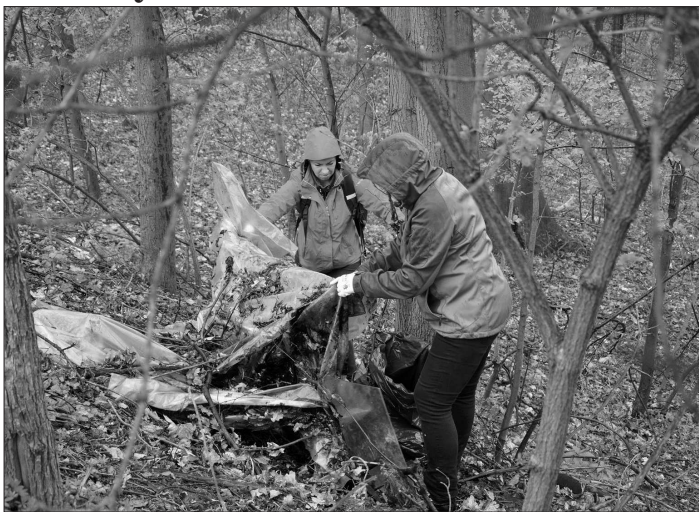
Dobrovolníci při sběru odpadů nacházeli nejčastěji obaly od potravin, ale často narazili i na velké kusy plastových fólií, skla, pneumatiky a podobně.

Uklízelo se i v místních částech. Pracovníci městského informačního centra a Kulturního domu Koprivnice se rozhodli vyčistit okolí Větrkovicé přehrady. Šest dospělých a jedno dítě zaplnili odpadem deset pytlů, které měli s sebou, a dalším odpadem zaplnili kontejnery u přehrady, a co do nich nevezlo, odložili k nim. „Pro nás je zcela nepochopitelné, jak dokáží být lidé vůči svému okolí bezohlední. Fascinující je i to, že lidé si myslí, že když odpad odhodí na co nejvíce nedostupné místo, že zmizí.