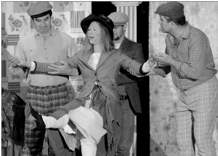
Ochotnický divadelní soubor Pod Věží hostoval minulou neděli v Kulturním domě v Mníši. Zítra svou verzi Pygmalionu odehrají na domácí půdě.

Začátek uvedení na Štramberckém divadelním přehlídce je o půl osm večer, o hodnocení představení se postarají svým hlasováním sami diváci v sále.