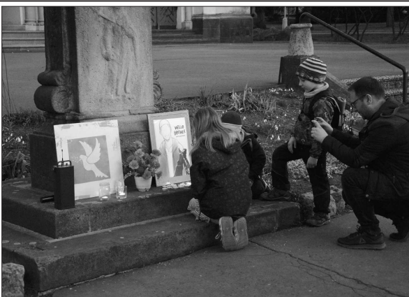
Na konci minulého týdne lidé v Kopřivnici uctili památku obětí novozélandských teroristických útoků a odsoudili násilí.