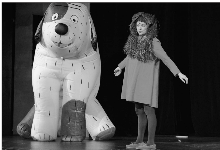
Pražské Divadlo Krapet před týdnem nadchlo dětské publikum především skvělým vizuálním ztvárněním známých příběhů Maxipsa Fika.

Kopřivnice (dam) – Hravost, jednoduchost a nadšení, to jsou hlavní ingredience a zřejmě i tajemství úspěchu Rychlých šípů z Uherského Hradiště. Slovácké divadlo přivezlo do Kopřivnice svou historicky nejhranější inscenaci ve čtvrtek 14. března a hned od prvních okamžiků bylo jasné, že i tady s ní sklídí úspěch. Vždyť jen pohled na pětiicetý mužů v typických podkolenkách a kračasech vyvolával na tvářích diváků úsměv, když pak herci přidali komiksové grimasy a díky, publikum se skvěle bavilo a možná už ani nebylo třeba šimrat jejich bránice občasnými dvojsmysly nebo až příliš okatým pomrkáváním do hledí. Diváci si zvlášť užívali momenty vzniklé přímo při představení, jako když hoši během výpravy do přírody narazili na zamčené dveře do sálu a museli hledat jiný vstup, právě zde bylo totiž jasné patně, jak moc si herci převtělení do legendární party z kresleného seriálu užívají. Ve světle úspěšného hostování vystává jen vzpomínka na hostování stejné inscenace na stejném místě v roce 2003 zrušené pro nezájem publika.