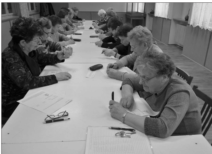
Naučit se trénovat svůj mozek a zlepšit paměť přišlo v úterý 12. března do klubovny v Kulturním domě v Mníši 17 seniorů.