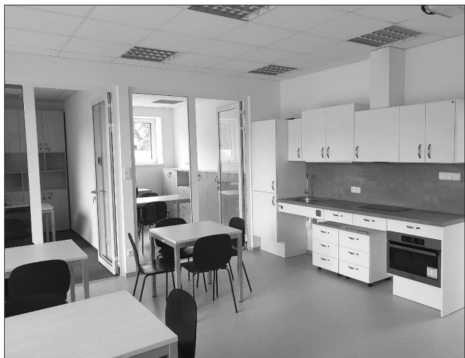
Do nově zrekonstruovaných a vybavených prostor v sociálně terapeutických dílnách na ulici Školní by v květnu měli nastoupit první klienti.