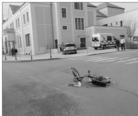
Policie hledá svědky dopravní nehody v Příboře, při které byla srazena cyklistka.

Příboř (hod) – Policie hledá svědky dopravní nehody, ke které došlo v úterý 5. března okolo 13.55 na ulici Lidické v Příboře. Řidička osobního vozidla značky Peugeot 307 předjížděla ve směru jízdy z ulice Ostravské cyklistku na elektrokole a při odbočování vpravo na křižovatce s místní komunikací vedoucí k parkovišti u obchodního domu Penny Market měla narazit pravým zadním kolem do předního kola cyklistky. Ta následkem nárazu měla spadnout na komunikaci. Řidička po střetu nezastavila vozidlo a s tímto odjela na parkoviště u obchodního domu Penny Market, kde toto odstavila a následně od vozidla odešla. Při dopravní nehodě došlo ke zranění cyklistky a na místě zasahovala rychlá záchranná služba. Řidička byla následně hlídkou PČR vypátrána a dovezena zpět na místo dopravní nehody. „V této souvislosti hledáme svědky této dopravní nehody. Policisté žádají občany, kteří by mohli k této události podat jakékoli informace, aby tyto informace sdělili osobně na kterékoli oddělení Policie ČR či na telefonní číslo 974 735 251, popřípadě na linku 158," uvedl Petr Smětak, tiskový mluvčí PČR.