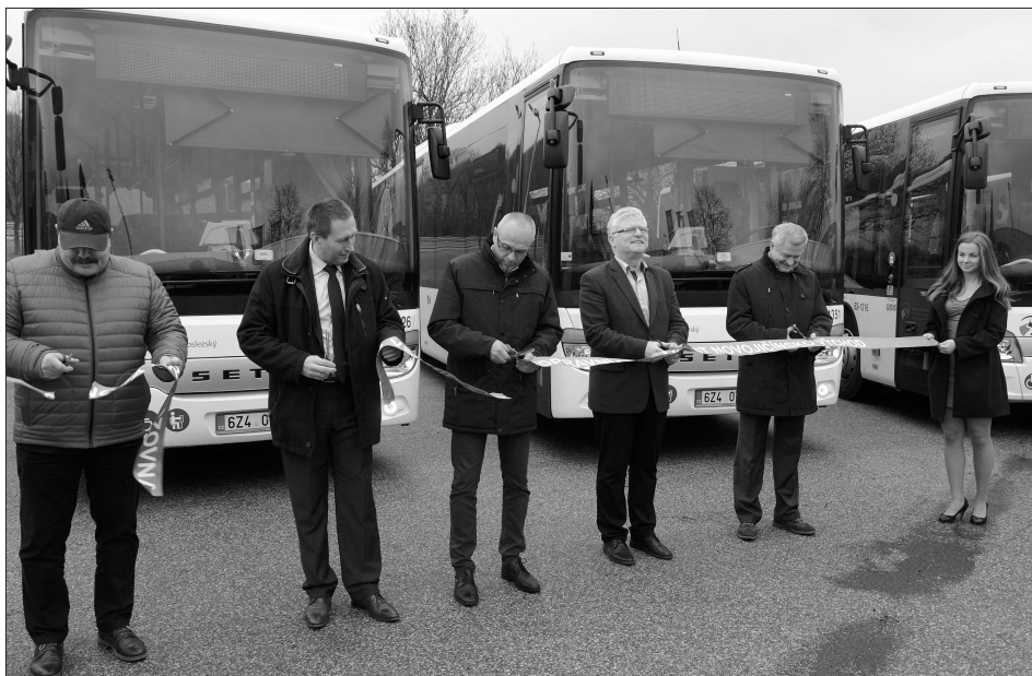
Na konci minulého týdne zahájil provoz v oblasti Nový Jičín východ nový dopravce. Flotila 73 nových, moderně vybavených autobusů vyrazila na cesty z kopřivnického polygonu.