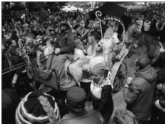
Mikuláš dorazil do Kopřivnice tradičně v bryčce tažené koňmi. V centru města ho očekávaly davy lidí.

Kopřivnice (dam) – V předvečer svátku sv. Mikuláše se centrum Kopřivnice tradičně zeela zaplnilo lidmi. Ti se začali scházet už před 16. hodinou, kdy na pěší zóně doznalá mikulášský trh a před kulturním domem začínal program Mikulášské jízdy. Přípravou byly jak hudební vstupy sólistů a školní kapely ZŠ E. Zátopka, tak taneční vystoupení skupin Elma Dance, Street Dance a Tanečního klubu Štramberk. Úderem 17. hodiny vjel do lidmi zaplněného centra města kočár s Mikulášem, který doprovázeli čerti na koních i pěší čerti a andělé. Mikuláš krátce pozdravil Kopřivničany a symbolicky rozsvítil vánoční strom. Následně byl k dispozici všem dětem, které se s ním chtěly setkat a vyfotit, což se dělo i během koncertu kapely HTK Band, jež program uzavírala.