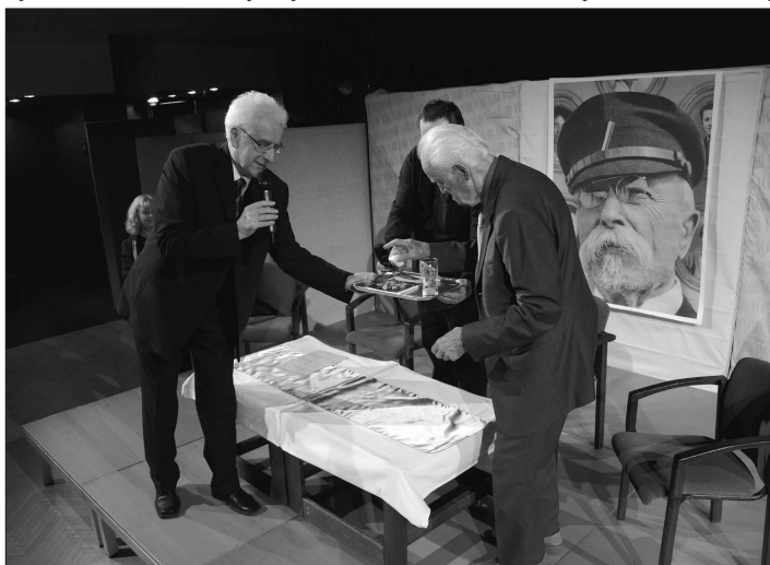
Hosté Kopřivnického pressování byli mimo jiné svědky netradičního křtu publikace T. G. M. a Kopřivnice škvarky a soli.