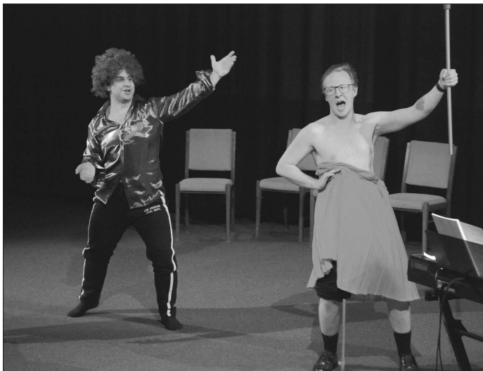
Zaplněně hlediště kinosálu v kulturním domě si minulý týden užilo další hostování ostravské komediální show Tri Tygři .

Inspirací pořadatelům byla historie oslav svátku sv. Cecilie, která je patronkou hudebníků, zpěváků, básníků a výrobců hudebních nástrojů. „V předvečer jejího svátku se scházely pěvecké a hudební spolky, přijímaly nové členy a udělovaly podporu nemocným členům, sirotkům a vdovám. Následně se všichni odebrali do hospody na taneční, takzvanou cecilskou zábavu. Vlastně se pokoušíme o novou variaci na tuto tradici a nabízíme možnost setkání muzikantů a jejich posluchačů,“ doplnila Holubová.