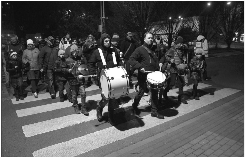
Průvod vedený skupinkou bubeníků prošel 17. listopadu v podvečer Kopřivnicí. Oslavu Dne boje za svobodu a demokracii si nenechaly ujít stovky Kopřivničanů s lampiony a svíčkami.