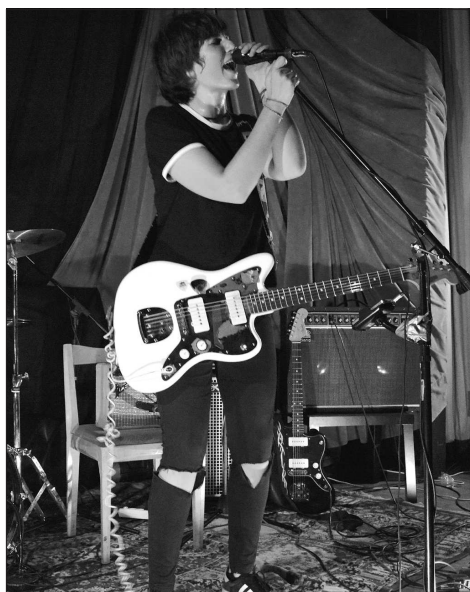
Páté pokračování hudebního festivalu Piper Records Night se mohla chlubit hned dvěma zahraničními hosty. Program otevřela polská punková zpěvačka The Pau.

Program, za kterým nestojí jen místní vydavatelství Piper Records, ale také lidé z Dialog Crew, Mandala Crew nebo Kachnička Entertainment, znovu potvrdil své kvality a potěšil nejen místní publikum.