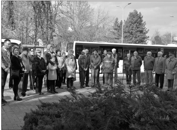
Stoleté výročí ukončení první světové války přilákalo na pietní setkání u pomníku padlých nezvykle mnoho Kopřivničanů, kteří si tak připomněli Den veteránů.