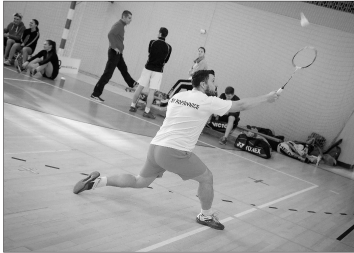
Směšené družstvo BK Kopřivnice, hrající minulou sezonu v I. lize, vyhrálo oba zápasy, kopřivnické běčko mělo poloviční úspěšnost.

Po sestupu z první ligy se teď bude „A“ družstvo Kopřiv-