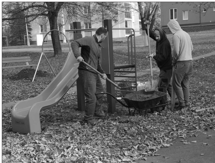
S instalací nových herních prvků v bytové zástavbě se začalo minulý týden v lokalitě Pod Morávií. Další budou následovat v nejbližších dnech.