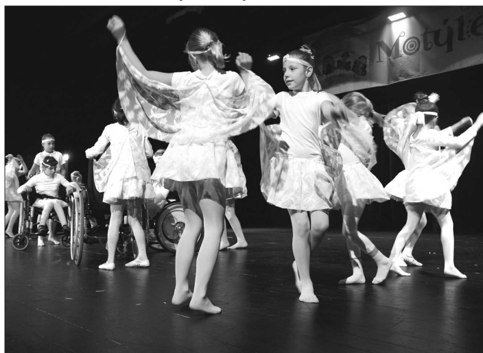
Žáci ZŠ sv. Zdislavy společně s dětmi ze speciální školy Motýlek připravili pro letošní ročník zdejší přehlídky choreografií na motivy Labutího jezera.