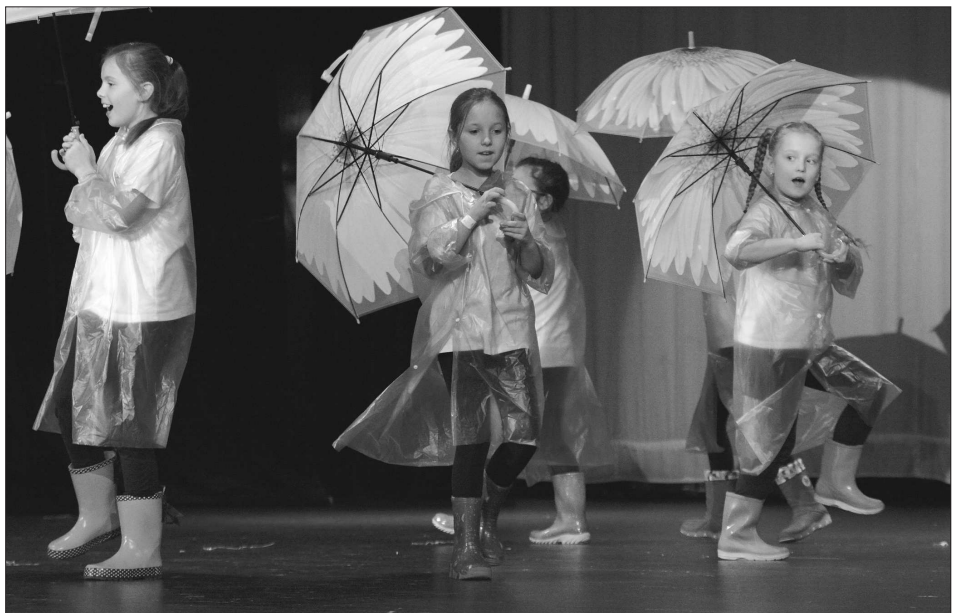
Mezi hosty 22. ročníku přehlídky zpěvu, tance a dramatického umění handicapovaných dětí Motýlek nechyběli ani hosté z partnerského města Myszków.