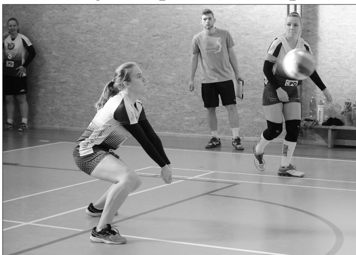
Družstvo kadetek VK Kopřivnice se na domácí palubovce ukalo s běčkem Frydku-Místku, kterému nakonec podlehl dvakrát 1:3 na sety.

Ve stejném čase hrály mladší žacký KV Kopřivnice první turnaj krajského přeboru a po vítězství 2:0 nad Frenštátem p. R. „B“ a prohrách 0:2 s Kyslešovicemi a s běčkem TJ