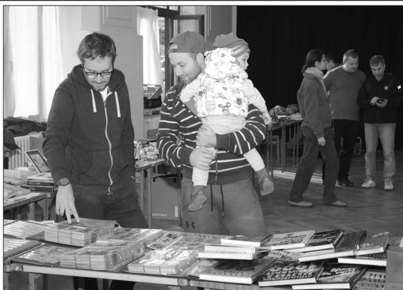
Návštěvníci setkání kopřivnických sběratelů si mohli jejich kolekce nejen prohlédnout, ale dozvědět se i spoustu zajímavostí.

Kopřivnice (dam) – Známky, komiksy, pohlednice, obaly od čokolád, plechovky, pивní sklo i zátky, knihy, ale třeba i čepice, které jsou součástí nejrůznějších uniforem, nebo žehličky a modely parních strojů byly k vidění na premiérovém Setkání kopřivnických sběratelů. To uspořádali minulou sobotu na půdě Katolického domu kopřivnickí skauti. Od 9 do 16 hodin bylo na setkání k vidění zhruba pětadvacet domácích sběratelských kolekcí nejrůznějšího zaměření. (Pokračování na straně 2)