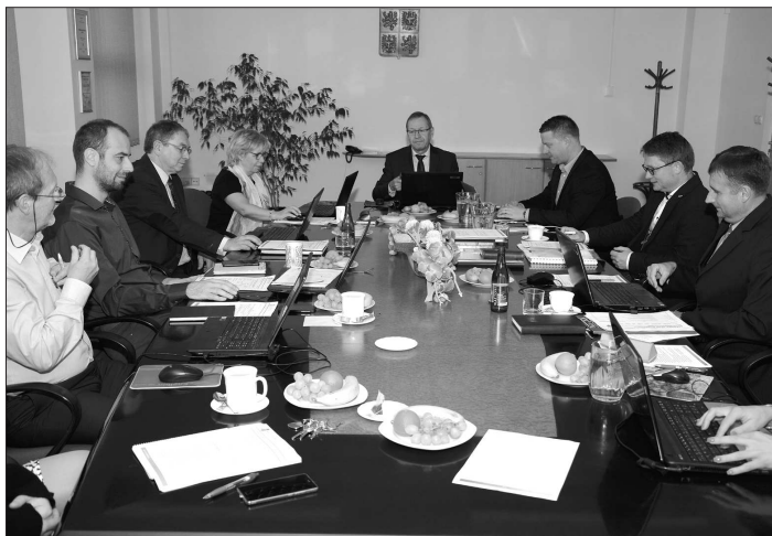
Sedmičlenná městská rada se k prvním jednání v novém volebním období sešla poprvé v úterý 6. listopadu.

Kopřivnice (dam) – K prvním jednání v novém složení se v úterý 6. listopadu sešla kopřivnická městská rada. Její jednání s pořadovým číslem jedna mělo na programu mimo jiné výběr zhotovitelůských firem a uzavření smlouvy o dodávce interiérového vybavení pro nově vznikající komunitní centrum na sídlišti Sever a sociálně-terapeutické dílny, které vznikly přestavbou bývalé výměňkové stanice na ulici Školní. Radní rovněž vydali souhlas se zhodnocením budov ZŠ Emila Zátopka a ZŠ 17. listopadu, které díky penězům z evropských fondů modernizují své učebny přírodopisu, respektive informatiky a cizích jazyků. Sedmičlenná rada města se také rozhodla pro přijetí likvidačního zůstatku po zrušené obecně prospěšné společnosti Salus a rozhodla o zveřejnění záměru prodat, pronajmout či směniti pozemky. Další jednání rady je v plánu v závěru listopadu a to už bude politicky čekat rozhodování o návrhu rozpočtu na příští rok.