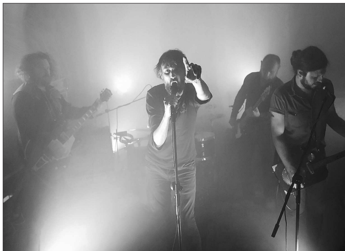
Skupina Povodí Ohře bude už zítřka večer jedním z lákadél programu dalšího ročníku nezávislého minifestivalu Piper Records Night v Katolickém domě.

♦ Křest sborníku vzpomínek pamětníků, vydaného k 100. výročí vzniku Československé republiky a 70. výročí povýšení Kopřivnice na město, proběhne v pátek 16. listopadu v 17 hodin v malém sále kulturního domu. Úryvky z publikace Jak se žilo v Kopřivnici bude číst ostravská herečka Sasinová-Polarczyk.