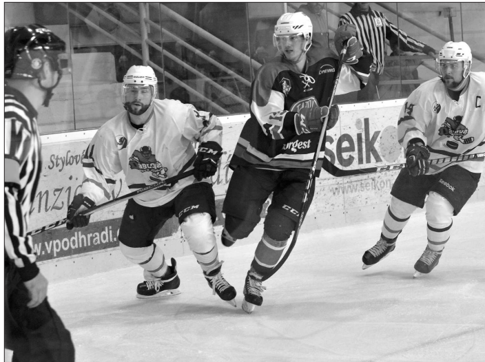
V prvních dvou třetinách derby s Novým Jičínem nasázeli kopřivnickí hokejisté svým soupeřům po dvou gólech. Novojičínští se ve třetí části zmohli jen na jednu branku.

Do třetího dějství vykořistili lépe Opavští. Poté si Kopřivnice vypracovala dvě střelecké příležitosti, které se však nepodařilo proměnit. V 56. minutě Tomášek procal kotouč pod Waneckým, čímž došlo k vyrovnání skóre 4:4. Jen o dvě minuty později propálil Waneckého bekhemend opět