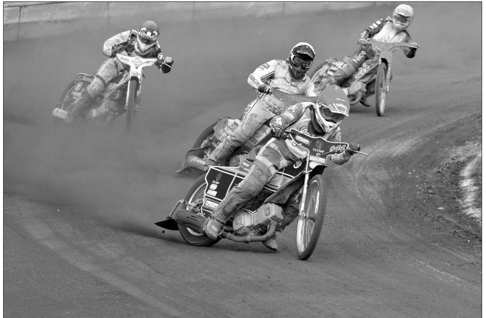
Mezinárodní závod družstev v rámci Poháru přátelství uzavřel letošní kalendář plochodrážních závodů na zdejší letní stadiónu. Vítězství vybojovali jezdci z Maďarska. Více na straně 7.

Oprava střechy samotné hlavní budovy by měla začít v říjnu a trvat bude zhruba dva měsíce. Provádějící stavební společnost Therm za tepelnou izolaci střechy, položení hydroizolačních vrstev, nezbytné klempířské práce a také za odstranění již nefunkčních výduchů vzduchotechniky ze střechy inkasuje podle smlouvy 4,71 milionu korun včetně DPH. (Pokračování na straně 2)