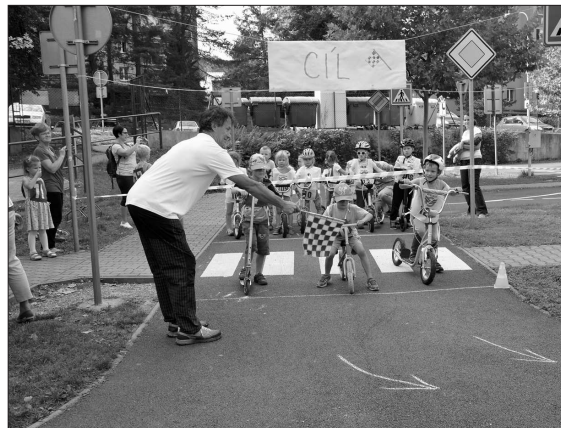
Závodů na koloběžkách absolvovaly děti po třech, přičemž organizátoři dbali na to, aby byly stejného věku. FOTO: DANA HOĐÁKOVÁ

Kopřivnice (hod) – Ve čtvrtek 13. září odpoledne závodily na dopravním hřišti děti na koloběžkách a odrážedlech. Závodů pro ně zorganizovala Mateřská škola I. Šustaly. Na start se postavili tři závodníci stejného věku, aby nedocházelo k věkovým handicapům, neboť závodily děti od dvou až do šesti let, které za mohutného povzbuzování rodičů i dalších přihlížejících jely jeden okruh. Po projetí cílové pásce pak byli všichni na stupních vítězů odměněni sladkými medailkami. Po projetí všech závodníků se pak přesunuli do sousední zahrady mateřské školy, kde se opékaly špekáčky. (Pokračování na straně 2)