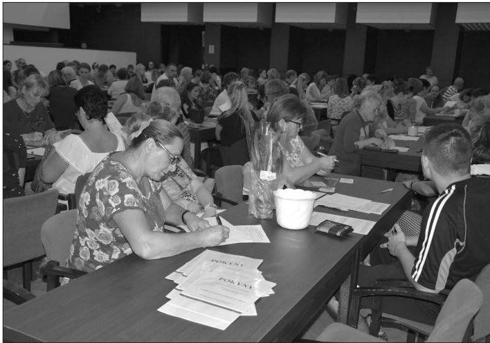
V úterý 11. září se v Kulturním domě v Kopřivnici sešli členové okrskových volebních komisí, aby složili předepsaný slib a zahájili svou činnost.