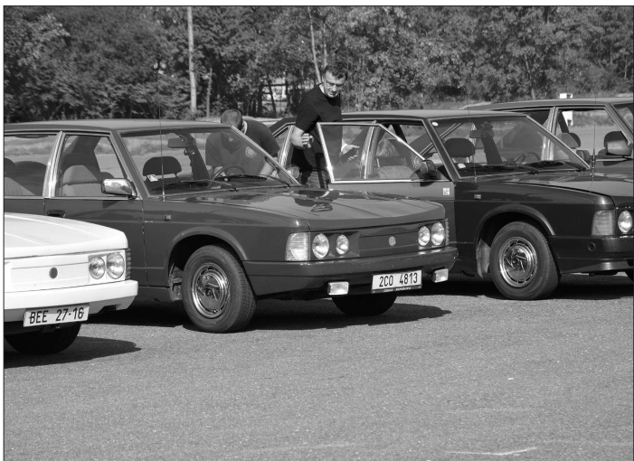
Členové Tatra klubu, sdružující majitele legendárních Tater 613, slavili v Kopřivnici výročí jeho založení. Sjelo se jich na sedmdesát.

„Všichni závodníci byli spokojeni. Přišli ročníkem bychom chtěli pořádat na parkovišti před radnicí a možná bychom připravili závod pro muže,“ zhodnotil závod TFA Junior vedoucí soutěže Jan Michálek.