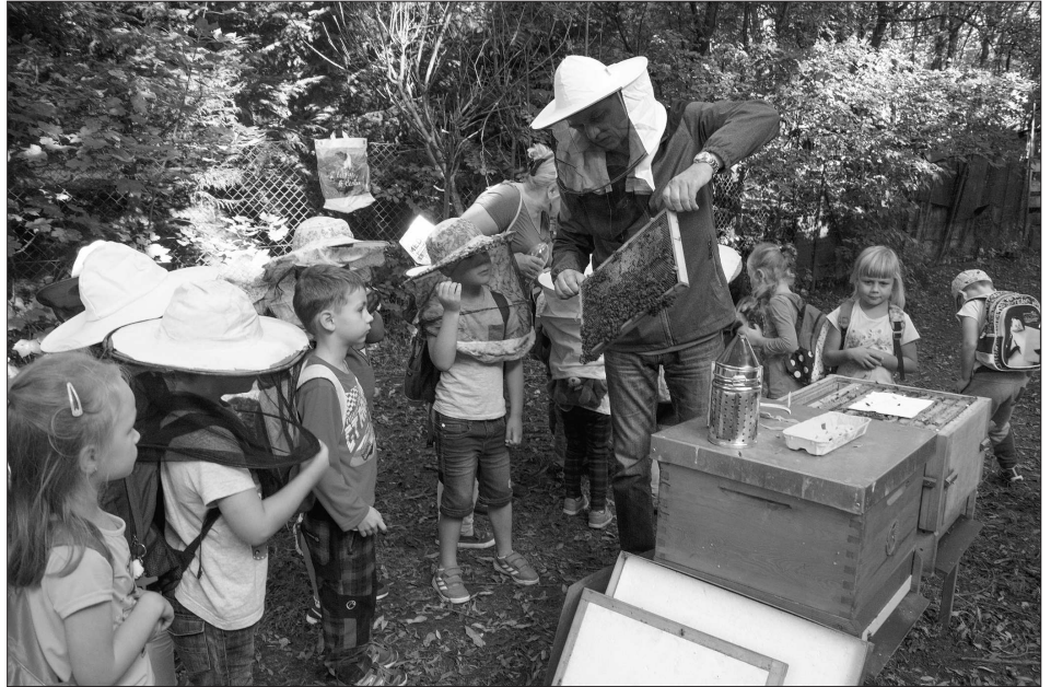
V rámci doprovodného programu Festivalu medu a písničky včelaři předváděli práci s včelami. O ukázkách byl velký zájem především mezi nejmenšími návštěvníky, kterých jen v průběhu úterka přišlo víc než pět stovek.