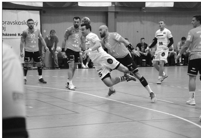
Především v prvních minutách utkání podali domácí házenkáři proti favorizovanému soupeři z Plzně vyrovnaný výkon. Nakonec ale podleli o devět branek.

„Ten zápas se nám nevyvedl. Byla znát naše nesehranost v obraně i útoku daná především zraněními některých hráčů v přípravě, navíc nám