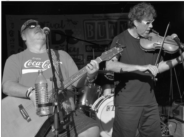
Pravděpodobně nejnavštěvenějším programem z třídní nabídky Festivalu medu byl páteční podvečerní koncert vizovické kapely Fleret.

Návštěvníky kromě medu a medových výrobků přilákal na festival i bohatý doprovodný program. Ve čtvrtek to byl koncert populární skupiny Buty, kterou vystřídal kopřivnicko-příborská kapela Příkop, v pátek pak zahrála folk-rocková kapela Fleret a místní rocková formace Sunar Rock. Sobotní program se nesl ve znamení multizánrových představení a folkloru. Dvakrát se představil folklorní soubor Drienovec z Bánovců nad Bebravou, stejně jako skupina historického šermu Marcus M. Zatímco poprvé odpoledne předvedla šermířské klání s příběhem, podruhé to bylo za tmy, kdy návštěvníci sledovali nádhernou ohňovou show. Ani v sobotu nebyli příchozí ochuzeni o hudební vystoupení, do-