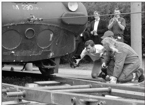
Pomocí navijáku a speciální nájezdové rampy opustila Strela svůj přístežek před zdejším muzeem.