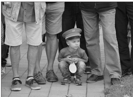
Několikahodinovému stěhování Slovenské strelky přihlížely stovky železničních nadšenců každého věku.

společnosti ČMZO. Ne celá Strela bude ovšem opravena v Hranicích, pracovat se na ní bude i v dalších dílnách ČMZO a u subdodavatelských firem. Například spalovací motory vlaku se tak po demontáži vrátí zpět a nový život jim vděčně renovační firma v Kopřivnici.