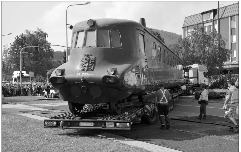
Na speciálním návěsu, určeném pro převoz kolejových vozidel, opustila Slovenská strela poslední srpná své místo před muzeem. Do Kopřivnice by se měla vrátit za dva roky už po vlastní ose.

Problémy se zaplavením oblastí na Holotě a přilehlých částech Lubiny hodlá radnice řešit také dalšími opatřeními. Jedním z nich by mělo být vybudování odvodňovacího kanálu na poli, ze kterého při prudkých deštích dochází k zaplavení rodných domků. (Pokračování na str. 2)