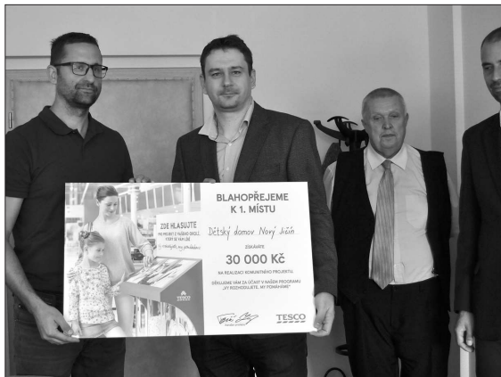
Nadační fond rozdělil peníze na dobročinné projekty. Největší podporu místních lidí získal Dětský domov Nový Jičín.

Program s názvem Vy rozhodujete, my pomáháme, vyhlášený dvakrát ročně Nadačním fondem Tesco, je zaměřen na podporu lokálních neziskových a příspěvkových organizací. Finanční prostředky jsou pak poskytovány na konkrétní projekty těchto organizací, které podporují společenský život ve svém okolí. (Pokračování na straně 2)