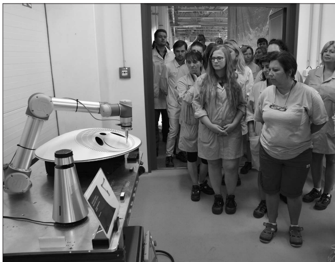
Zaměstnanci společnosti Tymphany si prohlížejí multifunkční robotické rameno, které ve validační laboratoři ověřuje životnost konektorů.

„Podle toho, co nám přísluší zkoumat, splňuje zákonem stanovenou podmínku trvalého pobytu, a tudíž v Kopřivnici může volit a být volen. Pro zkoumání dalších skutečností nemáme oporu v zákoně,“ říká Jana Sopuchová z oddělení správních agend kopřivnické radnice. Stěžovatelé nevyužili ve stanovené lhůtě možnosti domáhat se ochrany u krajského soudu, a kandidáta v čele se Stanislavem Šimíčkem se tak s konečnou platností může voleb účastnit a případně až po volbách může už kterýkoliv občan případně Šimíčkovu zvolení napadnout u soudu. „Předpokládám, že to neudělám jenom já, ale vadí to desítkám, možná stovkám lidí, takže těch stížností může být víc,“ uvedl Ivan Tellařík. Ten rovněž připustil, že podobný problém jako Šimíček mají zřejmě i další kandidáti z různých stran a hnutí a i jejich případné zvolení je připraven napadnout u soudu.