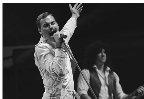
Na oslavách města zněly i hity legendární kapely Queen a jen o chvíli později odstartovala originální videomappingová projekce.

matrix. Průčelí zrekonstruované Ringhofferovy vily se během sobotní noci proměnilo v projekční plochu, na níž se několikrát zopakovala dynamická projekce, která v názvacích, ale přitom nesmírně efektně nastínila historii našeho města od symbolického vzniku života a jeho evoluci přes počátky zdejší keramické výroby, produkci Tatry až po aktuální digitální věk informací.