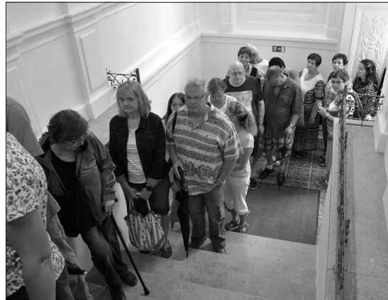
Lidé stojí ve frontě, aby si jako jedni z prvních prohlédli interiéry zrekonstruované Ringhofferovy vily.

Kopřivnice (dam) – Zhruba tisíc lidí si během pátečního odpoledne 25. srpna prošlo interiéry zrekonstruované Ringhofferovy vily. Začátek malé slavnosti v podobě módní přehlídky ještě skrápěl déšť, ale už v průběhu proslavily starosty a šéfa realizační firmy Beskydská stavební, a. s., mohli lidé deštníky odložit a novorenesanční vilu s několika moderními prvky si prohlédnout v paprscích slunce. Následovala už nabídka na prohlídku obřadní místnosti města, reprezentativních sálů a příslušného zázemí ve zvýšeném přízemí vily, kterou si lidé nenechali ujít přesto, že ji z obav o případné poničení a díky dešti mohli procházet jen ve skupinkách po dvaceti a s ochrannými návkly na nohou, aby neutrpěly parketové podlahy. (Pokračování na straně 2)