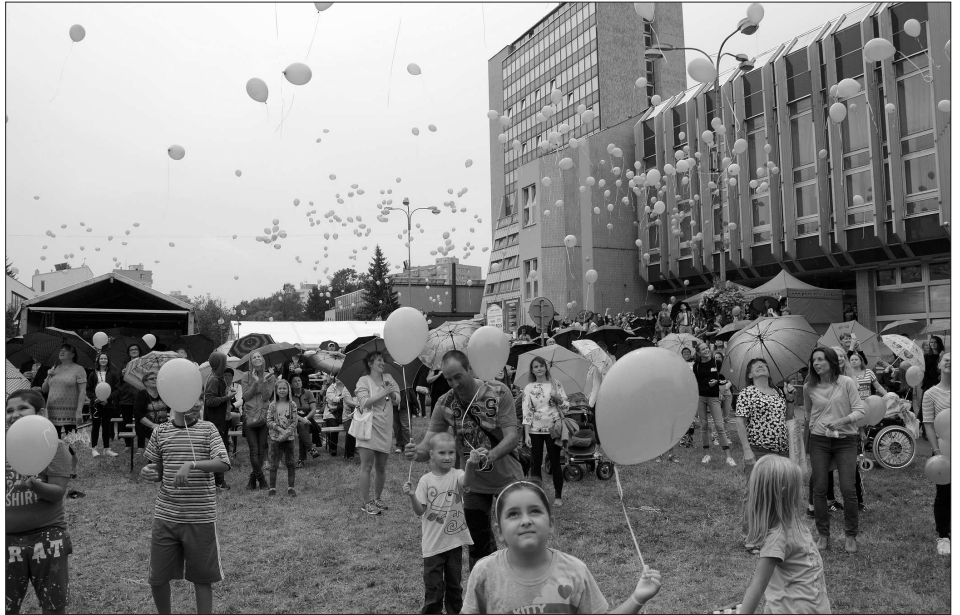
Hlavní část sobotních oslav 70. výročí povýšení Kopřivnice na město zahájilo vypuštění balonků se symbolickými přáními městu. Do vzduchu se jich vzneslo na dva tisíce.

Stížnosti podanou zmocněncem SPD se skutečně zabýval registrační úřad, ale v Šimíčkově kandidatuře neshledal žádný problém. (Pokračování na straně 2)