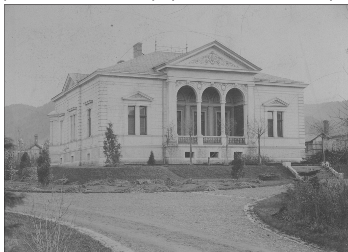
K vile, kterou si nechal postavit továrník Schustala, původně patřily také dnes již neexistující hospodářská stavení a zahrada se proměnila v park.