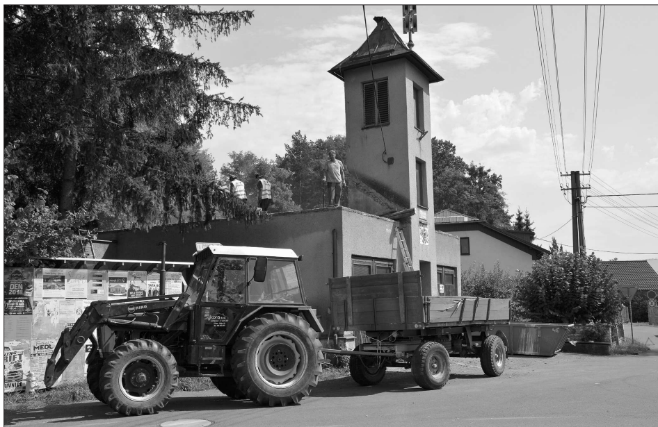
Začala rekonstrukce požární zbrojnice ve Větrkovicích. Po jejím dokončení se hasiči dočkají nového zázemí včetně školící místnosti. Rekonstrukce má přijít na víc než čtyři miliony korun.