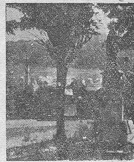
Pohled na střed Kopřivnice se svahů nad městem.