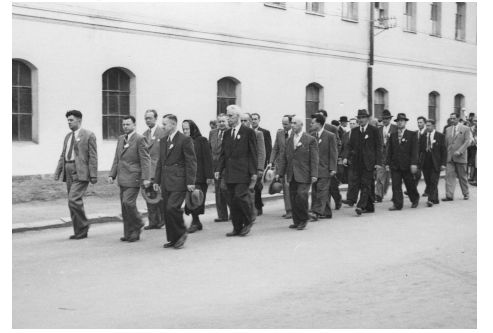
V souvislosti s oslavami povýšení prošel Kopřivnicí 29. 8. 1948 průvod místních spolků.