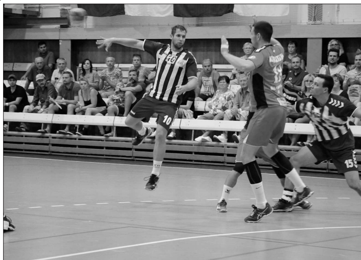
Proti maďarskému celku podali kopřivnickí házenkáři na domácím turnaji velmi kvalitní výkon a nakonec s ním remizovali 27:27.

„Zápas proti Maďarům jsme mohli i vyhrát, ale nedali jsme náskok a sedmikrát. Stejně tak s Němci to bylo vyrovnané, jenomže závěr se