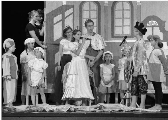
Úvod představení připraveného účastníky tábora Malované písničky patřil muzikálové Šípkové Růžence.

Kopřivnice (dam) – Skoro zaplněný velký sál kulturního domu přihlížel minulý pátek bezmála dvouhodinového programu, který během týdenního pobytu na táborové základně na Kletné dokázali připravit účastníci tradičního tábora Malované písničky, přípravěho kopřivnickým domem dětí a mládeže. Osmnáctý ročník populárního tábora mezi 9. a 17. srpnem absolvovalo 40 děvčat a pět chlapců. Kromě celotáborové hry, jejímž cílem byla záchrana magického stromu, čekaly na děti hudební a výtvarné ateliéry a čas trávil rovněž v některém z kroužků, mezi kterými nechyběl třeba novinářský nebo taneční. (Pokračování na straně 4)