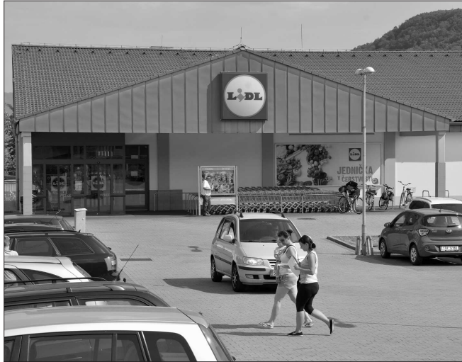
Společnost Lidl připravuje modernizaci své kopřivnické prodejny. V úvahu připadá i demolice stávající budovy a její nahrazení novým typem.

O tom, v jakém rozsahu bude zvažovaná modernizace zdejšího Lidlu, je tak zatím možné pouze spekulovat. Podle zkušeností z jiných míst České republiky přicházejí pravděpodobně v úvahu dvě možné varianty. Tou první je demolice stávajícího objektu a jeho nahrazení zcela novým typem prodejny, který má zvenku i uvnitř působit luxusněji, má výrazně širší uličky, prostornější odkládací prostor za pokladnami. Parkoviště před prodejnou má nabízet širší stání pro auta než konkurence. Součástí nového typu prodejny, kterou Lidl poprvé představil před dvěma lety v Berouně, jsou i toalety pro zákazníky včetně přebalovacího pultu a výrazně rozšířené záměry pro zaměstnance. Druhou možností je pak „remodeling“ stávající prodejny, která by tak dostala některé prvky prodejny nové generace jen menší úpravou interiéru.