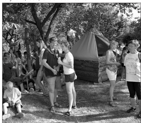
V zahradě restaurace Pod Kaštany vyrostla replika historického podesadového stanu místních skautů.