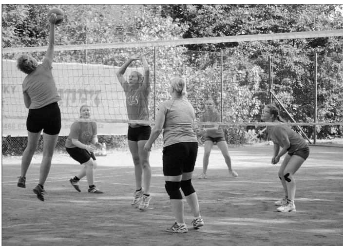
Kadety kopřivnického volejbalového klubu četily na domácím turnaji starším, a tuž i mnohem zkušenějším soupeřkám.