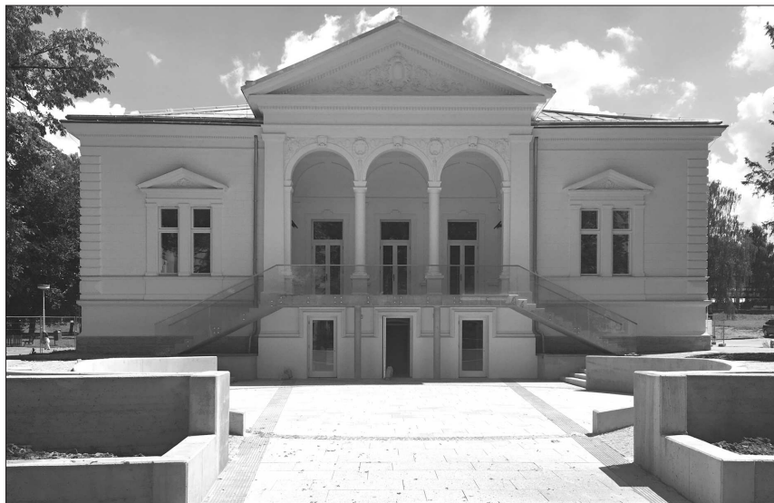
Nedávno dokončená rekonstrukce Ringhofferovy vily výrazně proměnila především její předprostor.

Zájemci o prohlídku budovy se musí připravit na omezení v podobě rozdělení do skupin po maximálně dvaceti návštěvnících, což má zabránit případnému poničení právě dokončených interiérů objektu. Přístupné budou hlavní reprezentační sály ve zvýšeném přízemí vily. Lidé se naopak nepodívají do ne zcela dokončených prostor plánované restaurace v suterénu nebo na půdu vily.