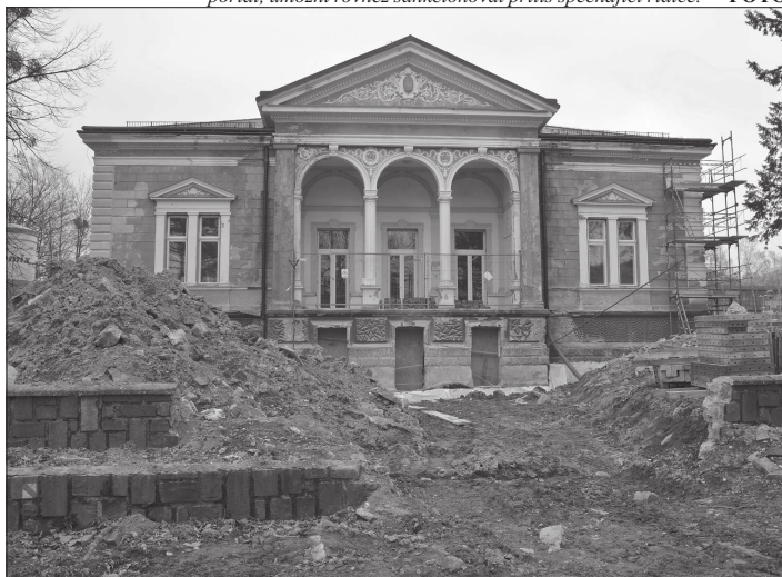
Probíhající rekonstrukce Ringhofferovy vily a nutnost navýšení rozpočtu projektu budou jediným bodem mimořádného jednání zastupitelstva.