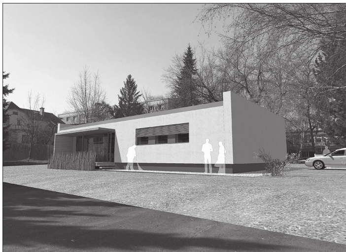
Vizualizace naznačující budoucí podobu sociálně terapeutických dílen v Kopřivnici. Město již vybralo firmu, která přebuduje bývalý výměník na ulici Školní.