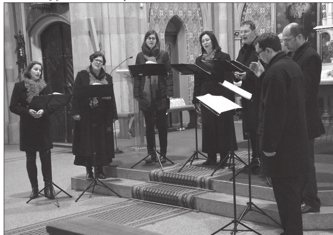
Především duchovní hudba zněla v neděli v podvečer kostelem sv. Bartoloměje. V Kopřivnici hostoval pražský vokální soubor Ensemble Hilaris.