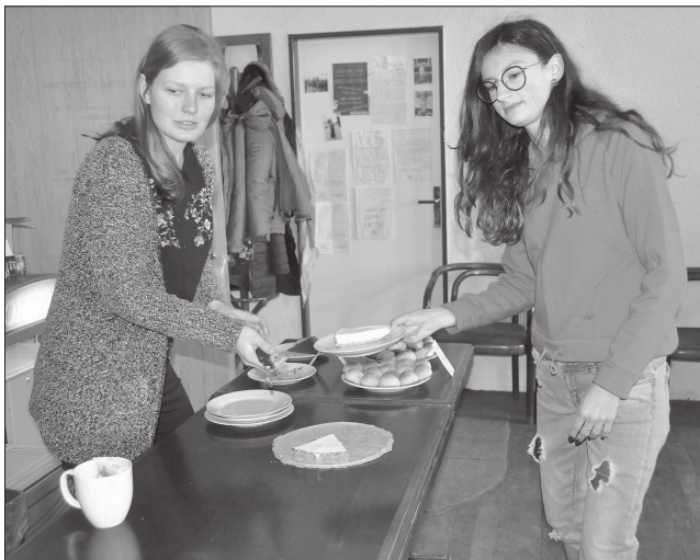
Už poněkolkáté připravily skautky z oddílu Jitřenky dobročinnou kavárnu, jejíž výtěžek využijí k podpoře studia indické dívky.