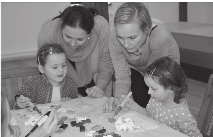
Do Muzea Fojtství přišli zájemci, kteří si chtěli vyrobit velikonoční dekorace technikou enkaustiky. Horkým voskem se malovala nejen vajíčka, ale i zvířátka.