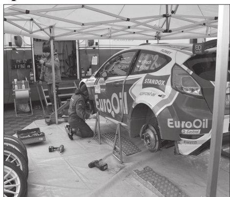
Atraktivní podívanou nabízela také servisní zóna Valašské rally situovaná na kopřivnickém polygonu.

prohrál se stájovým kolegou Veibym. Jeho celkový výsledek to nakonec neovlivnilo, neboť jeden ze soutěžních vozů naboural do plynové přípojky v těsné blízkosti trati, což nakonec vedlo k rozhodnutí sportovců komisařů rychlostní zkoušku anulovat. Atraktivní podívané se diváci v neděli dopoledne a v brzkém odpolední dočkali i na polygonu Tatro. Spolu s televizními kamerami mohli sledovat dva průjezdy krátkou, ale velmi technickou rychlostní zkouškou a práci mechaniků v servisní zóně nebo se mohli osobně setkat s jezdcí. Podle pořadatelů si během víkendy našly cestu do areálu zdejší zkušební dráhy tisíce fanoušků motosportu.