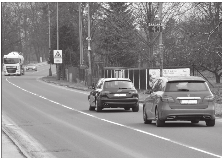
Aktuální radar na ulici Záhumní má spíše preventivní funkci. Nové zařízení, které město pořídí, umožní rovněž sankcionovat příliš spěchající řidiče.

Po schválení v zastupitelstvu bude dokument zveřejněn na webových stránkách města.