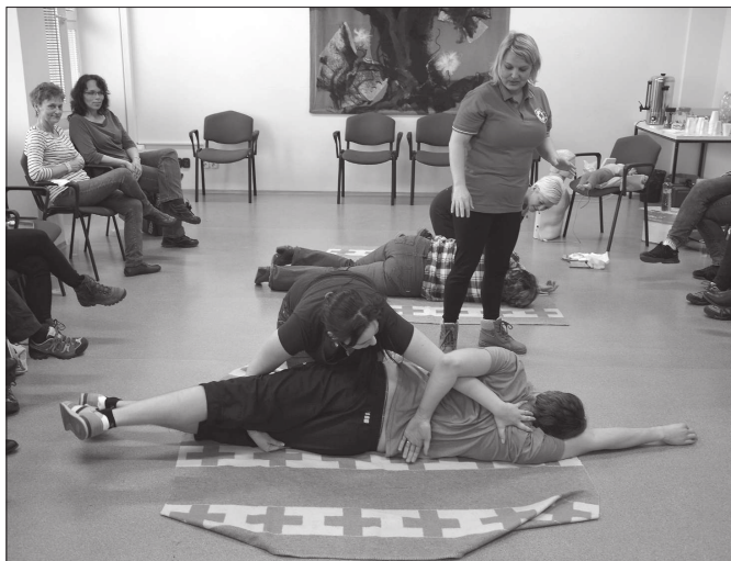
Součástí nabídky kurzů připravených v rámci MAP byl vloni například nácvik poskytování první pomoci. Letos bude nabídka kurzů ještě širší.

Kopřivnice (dam) – Osmdesát šest posádek se už zítra vydá na start KOWAX Valašské rally ValMez. Sedmatřicet ročník závodu bude zároveň úvodním podnikem letošního mistrovství ČR v rallye, a tak ve startovní listině není nouze o jezce z absolutní tuzemské špičky. Startovní číslo 1 bylo přiděleno úřadujícímu šampionovi Janu Kopeckému, který bude za volantem své Škoda Fabia R5 obhajovat loňské vítězství ve Valašské rally. I když start a cíl je tradičně ve Valašském Meziříčí, centrem rallye bude Kopřivnice. Na tatrovackém polygonu bude celý víkend 23.-25. března servisní zázemí týmů a pojedou se zde také dvě nedělní „erzety“, které se dočkají i přímého televizního přenosu. Start první bude pár minut po nedělním polední, druhý průjezd pak bude následovat o dvacet minut později. Už dopoledne se ale závodní vozy proženou také Lubinou a především Mnišim, jejich územím vedou rychlostní zkoušky č. 8 a 11, které startují v 7.46 h a v 10.16 h. Závod si dopoledne vyžádá dopravní omezení v obcích.