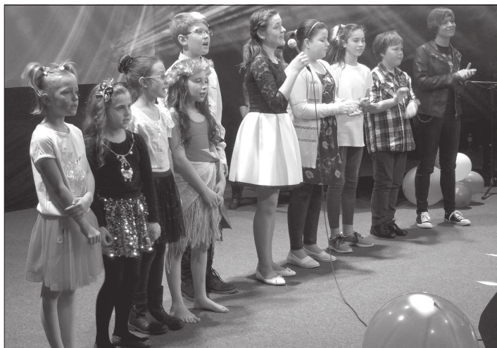
Desítkou finalistů letošní KoprStar se představila v sólových vystoupeních stejně jako při zpěvu společně písničkami s textem ilustrujícím průběh soutěže.

Nvotová rozebrala... (Dokončení ze strany 1) „Je zajímavé sledovat současné politiky u nás i ve světě a vyzporovat určité podobnosti s Mečiarovým chováním v době, kdy byl u moci. Pro mě je to až hrozné, ukazuje to totiž, že tento styl politiky funguje na lidi jako na druh napříč časem a kulturami,“ řekla divákům svého filmu Nvotová.