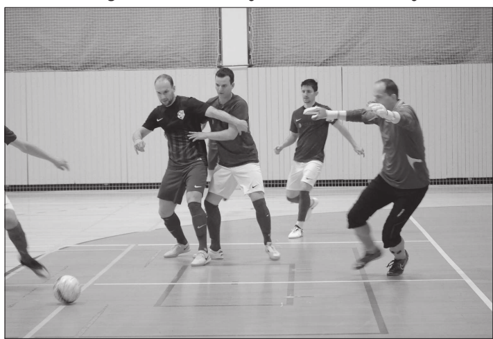
Futsalisté FU Kopřivnice vedli po prvním poločase finálového utkání Divize F s Opavou 6:2, v závěru však museli čelit soupeřovu tlaku.