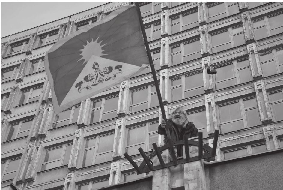
Tibetská vlajka znovu zaválala i na budově radnice už v pátek odpoledne. Ve stejnou dobu se k solidárnímu gestu vůbec poprvé připojil také Krajský úřad Moravskoslezského kraje.

V příštím týdnu budou vyhlášeny literární a výtvarná soutěž. Zatímco literární je určena pro žáky II. stupně základních škol, výtvarná je rozdělena do tří kategorií, a to pro žáky 1. a 2. tříd, 3. až 5. tříd a 6. až 8. tříd. (Pokračování na straně 2)