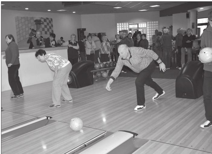
Na novinku v rámci projektu Aktivní senior - pohár v bowlingu - přišlo 80 účastníků. Někteří si zahráli, jiní turnaji jen přihlíželi.