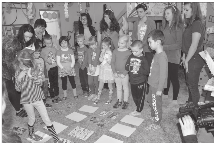
Zajímavý dvouhodinový program připravili dětští zastupitelé pro předškoláky v Mateřské škole Jeřábinka, pozvali je na vesmírné putování.