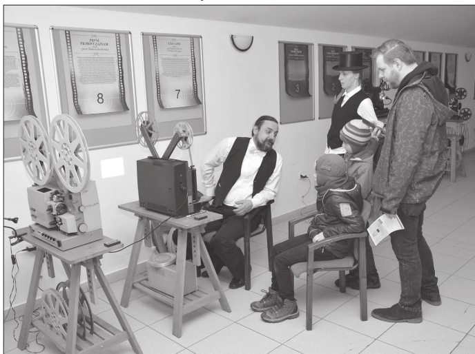
Kinematografičtí nadšenci ze Studia Bez kliky poskytovali návštěvníkům dvoudenní akce na půdě kina individuální přístup. Diváků totiž přišlo velmi málo.