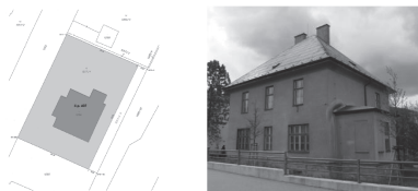
Podrobné informace naleznete na webových stránkách www.koprivnice.cz nebo na úřední desce před MÚ.