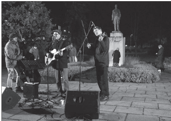
Při koncertě na náměstí lidé začali spontánně nosit zapálené svíčky k pomníku prezidenta Masaryka.