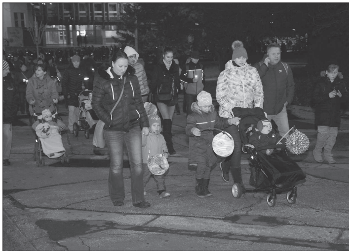
O oslavu státního svátku připadajícího na 17. listopad byl mezi Kopřivničany velký zájem. V průvodu s lampiony jich šly odhadem víc jak čtyři stovky.

Hned dvou trestných činů, a to trestného činu ublížení na zdraví a trestného činu výtržnictví se měl 12. listopadu v brzkých ranních hodinách dopustit sedmadvacetiletý muž z Příbora. Ten na chodbě jednoho z kopřivnických panelových domů fyzicky napadl dva muže, kdy jednoho z nich dokonce udeřil baseballovou pálkou do oblasti hlavy. Tímto úderem mu způsobil zranění, které si vyžádalo lékařské ošetření. Útočník byl ještě téhož dne v ranních hodinách policisty zadržen. Při zadržení se choval agresivně, a policisté proto museli použít vůči němu i donucovací prostředky. Mladému muži nyní hrozí trest odnětí svobody v délce trvání až tři let.