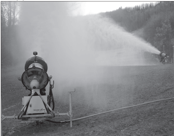
Minulý čtvrtek, jedno z prvních opravdu mrazivých rán letošního podzimu, využili na zdejší sjezdovce k testu systému umělého zasněžování.