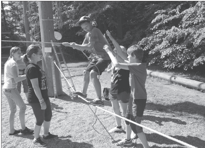
Podobně jako vloni je součástí letošního seriálu aktivit Někedo ven? hra Alcatraz plánovaná v areálu skautského Vanaivamu.

Hlavním komunikačním kanálem celého prázdninového projektu bude komunitní stránka na Facebooku. Tam se zájemci dozvědí nejen podrobnosti o jednotlivých aktivitách, ale ve spolupráci s Dětským zastupitelstvem Kopřivnice už vznikají videopozvánky na jednotlivé akce seriálu a fanoušci stránky se mohou těšit také na pravidelné soutěže o ceny.