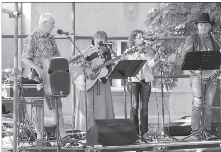
O hudební program Letního dne pro Kopřivnici pořádaného na zahradě Katolického domu se minulou neděli postarala i country kapela Kondoři.

Další soutěž vypsal po loňské premiéře Katolická beseda Kopřivnice pod titulem Kopřivnické rozmarné léto. Soutěže se může zúčastnit úplně každý, kdo fotografuje, od začátečníků až po profesionály. Téma soutěže se sice omezuje pouze na Kopřivnici, ale i tak je dost široké. Námetem může být krajina, památky, architektura stejně jako kulturní a společenský život Kopřivnice. Uzávěrka této soutěže je už na konci září. Podrobné informace a pravidla obou soutěží je možné najít na webových stránkách organizátorů.