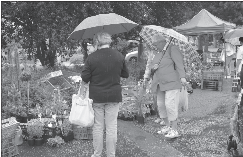
Druhému farmářskému jarmarku, který proběhl v pátek 16. května, nepřálo počasí. Přesto si na něm lidé kupovali především sazenice bylin, zeleniny i květin. Další jarmark v centru města proběhne až po prázdninách. FOTO: DANA HOĐÁKOVÁ

nění. Zaměstnavatelé mají největší zájem o kováře, nástrojaře a příbuzné profese, velká poptávka na trhu práce je rovněž po montážních dělnících, slévačích, svářečích a obdobných odbornostech. V oblasti služeb pak firmy potřebují především uklízeče, ale také pracovníky v oblasti gastronomie a hotelnictví. V následujícím období se dá předpokládat zpomalení poklesu nezaměstnanosti v souvislosti s ukončením školního roku. Část čerstvých absolventů především ze středních a učňovských škol se objeví v evidenci úřadu práce buď nyní, a nebo až po skončení letních prázdnin. (Pokračování na straně 3)