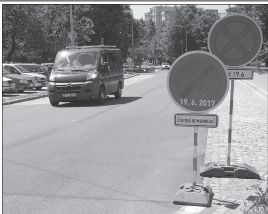
Do konce června musí řidiči počítat na Štramberské s omezením, které způsobí instalace dopravního značení.