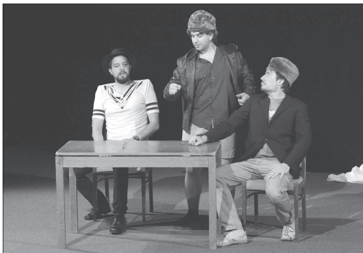
Kvarteto ostravských herců bavilo kopřivnické publikum svým kabaretním programem Tři tygři už podruhé . Hostování komiků přilhlého zaplněné kino.

V případě nepříznivé počasí se celý program neuskuteční pod širým nebem, ale ve velkém sále kulturního domu.