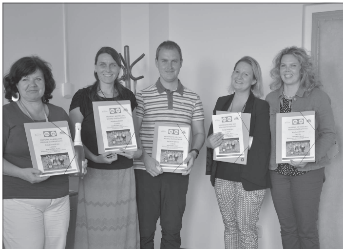
V rámci akce Do práce na kole byl oceněn i neúspěšnější tým, a to pracovníci odboru školství, kultury a sportu, kteří do práce v průběhu května jeli v 87,5 % na kole.

V době od 1. července do 31. srpna tak bude v pondělí otevřena MŠ v Lubině, ve středu MŠ Česká a Pionýrská, ve čtvrtek MŠ Krátká a v pátek MŠ I. Šustaly. Zahrady jsou po dobu prázdnin zpřístupněny v době od 16 do 19 hodin mimo svátky.