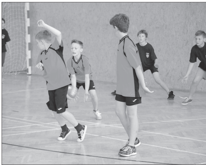
Žáci pořadající ZŠ Lubina podlehlí ve finále Závěšicím, které získaly pohár a medaile za vítězství. Třetí skončilo v Lubinské střele Mniší.