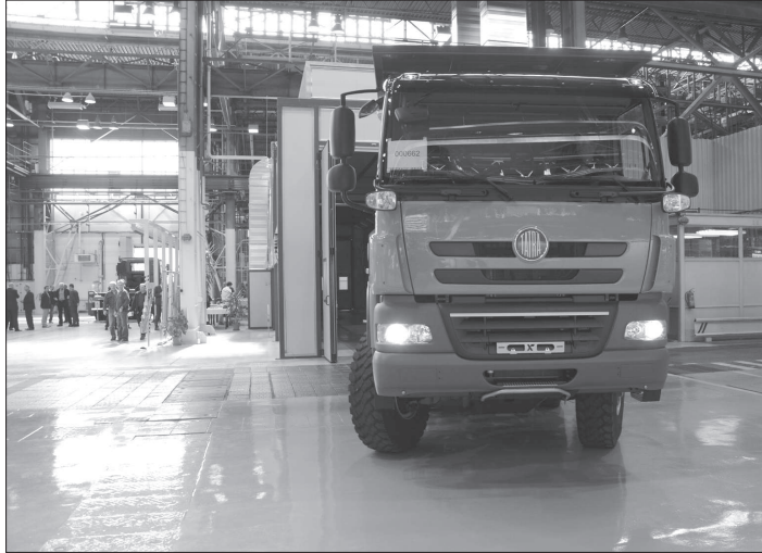
Na investici do pracoviště diagnostiky Tatra Trucks má v příštích dvou letech navázat řada modernizačních investic, které mají mít hodnotu až 1,5 miliardy korun.

K o p ř i v n i c e (dam) – Budova Základní školy Alšova se v letošním roce nedočká opravy dalších sociálních zařízení. Rozpočet města sice počítal s částkou 5,5 milionu korun, za kterou měla být provedena už třetí etapa rekonstrukce sociálních zařízení na škole, konkrétně v pavilonu školní družiny a u tělocvičen. Ovšem nabídky stavebních firem v soutěži byly o statisíce, ale i o víc než milion korun dražší, a na opravy proto letos nedojde. „Problém jsou nejen peníze, ale i fakt, že tyto stavební práce je možno realizovat pouze v době letních prázdnin a pokusit se najít dalšího dodavatele už by se prostě nestihlo. Proto jsme se rozhodli výběrové řízení zrušit a převést danou zakázku do rozpočtu roku 2018,“ uvedl starosta Miroslav Kopečný.