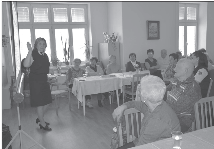
Preventivky Hasičského záchranného sboru MSK Nový Jičín seniorům v klubu důchodců přiblížovaly možnosti, jak byt chránit proti vyhoření.

Stavba samotného chodníkového tělesa zřejmě nezačne dřív než na podzim. „V závislosti na průběhu realizace všech přeložek bychom chtěli začít chodník stavět od ulice Štramberské až před most, kde v příštím roce bude SmVaK dělat přeložku vodovodu. Až po jejím dokončení můžeme pokračovat se stavbou chodníku od mostu až po hřbitov. Území je v ohledu na realizaci stavby, ať už v přípravě a provádění úprav na zabezpečení železničního přejezdu nebo zajištění provedení všech požadovaných přeložek inženýrských sítí, velmi složitá, vyvolává zásahy i do pozemků v soukromém vlastnictví a stavba samotná se prodlužuje,“ dodal na závěr vedoucí oddělení investic.