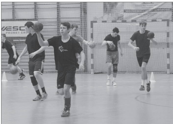
Dvacítka házenkářských nadějí z moravských klubů se minulý týden sešla k soustředění na kopřivnické palubovce.

Podobný camp jako v Kopřivnici proběhne za několik týdnů také v Jičíně pro hráče z českých klubů a následně si trenér vybere hráče pro repre-