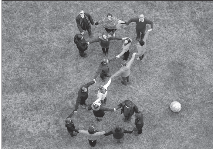
Pracovníci odboru životního prostředí s vedením města vytvářeli písmena, pomocí nichž bude vytvořen vzkaz Zemi k jejímu svátku.

V sadu proběhne také výstava děl mateřských a základních škol, která bude přemístěna do vestibulu radnice, kde bude ke zhlédnutí až do poloviny května. „Další novinkou je promítání filmů s environmentální tematikou v zatemněných stanech a vytvoření odpočinkové zóny s čajem a malým občerstvením,“ poznamenala Lucie Kubalcová.