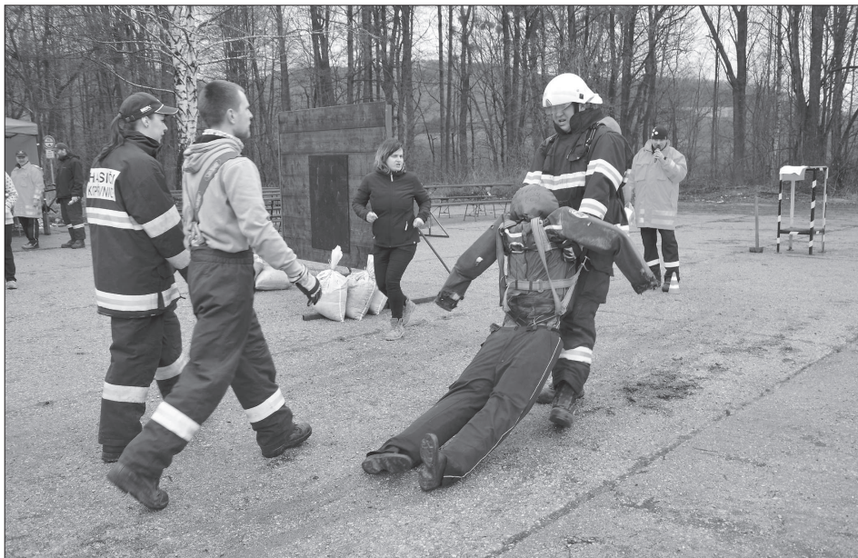
Po sérii silových disciplín na parkovišti pod přehradou ve Větrkovcích čekal na muže a ženy soutěžící v Drnholeckém železném hasiči náročný výběh po schodech na hráz.

Soutěž se skládala ze dvou částí, silové, která proběhla na parkovišti, a výběhové. V silové části po odstartování závodník proběhl 8 pneumatik z osobního automobilu, poté musel smotat dvě hadice B. Následně ženy přeskakovaly malou překážku a na muže čekala dvoumetrová bariéra. (Pokračování na straně 7)