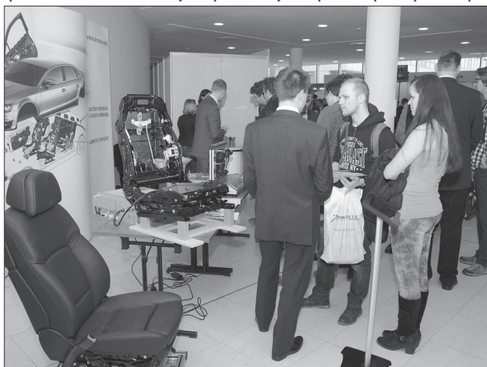
Zástupci společnosti Brose se pokoušeli zaujmout talentované studenty přímo na půdě ostravské Vysoké školy báňské.

Vystavující společnosti se snažily zaujmout nejen prezentací svých výrobních programů a zaměstnaneckých benefitů pro absolventy. Studenti mohli získat zajímavé stáže nebo konkrétní zadání pro své závěrečné práce, které mnohé firmy slibovaly finančně ocenit. Program Kariéry Plus doplnily přednášky zástupců jednotlivých firem, ale také odborníků z oblasti lidských zdrojů. Návštěvníci výstavy si tak mohli sestavit atraktivní životopis, vyzkoušet si přijímací pohovor v angličtině nanečisto a podobně.