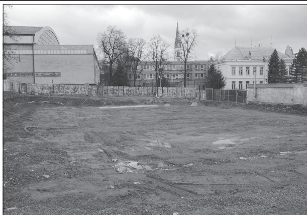
Prostranství po bývalých sklenících se do června změní v parkoviště s kapacitou 39 stání. Přerušené stavební práce začíná každým dnem.