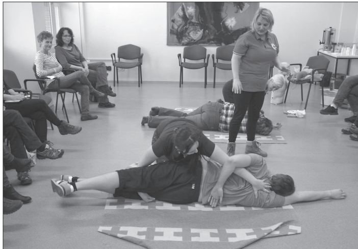
Kopřivničtí pedagogové se pod vedením lektorky Červeného kříže vzdělávali v oblasti první pomoci. Šlo o první z řady připravených kurzů.