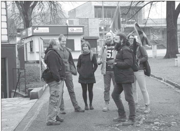
Kopřivnická radnice se i letos připojila ke kampani Vlajka pro Tibet. V pátek 10. března se uskutečnil i tradiční Zvonkový pochod na podporu Tibetu.

„Současně s dokončováním rozpracovaných částí, které se nestihly dokončit v loňském roce, se rozjedou i stavební práce na prostředním úseku, jenž začíná u křižovatky ulic Štramberské a Dvořákovy až po retardér u hasičárny a od něj až za křižovatkou s ulicí Erbenovou. Nyní v tomto úseku budou stavební firmy pro Severomoravské vodárny a kanalizace vyměňovat vadné, poškozené či dosluhující zařízení, které je umístěno v komunikaci. Opravovat se tak budou nejen vodovodní uzávěry, ale i kanalizační poklapy. Souběžně bude probíhat tato činnost také v úseku od křižovatky ulic Štramberská a Pabla Nerudy po křižovatkou s ulicí Janáčkovou,“ upřesnil Martin Lapčík s tím, že hlavní stavební práce na rekonstrukci tohoto úseku by se měly rozjet v závislosti na počasí přibližně v polovině dubna.