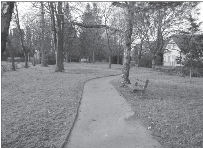
Celý pás parků mezi ulicemi Sadovou a Pionýrskou by se mohl dočkat revitalizace. Na nové výsadby se město pokusí získat dotaci.

Původní cena bývalého výměníku na ulici Máchově byla stanovena na 410 tisíc korun, za tuto cenu se ale opakovaně nedařilo objekt prodat. Proto byla minimální nabídková cena snížena o 20 %. Ke snížení ceny přispěl také zhoršující se stav objektu způsobený působením vnějších vlivů, předpokládá a zvyšující se náklady spojené s údržbou.