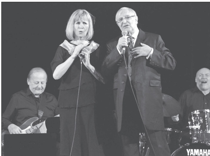
Jitka Molavcová a Jiří Suchý během koncertu v Kopřivnici. Jeho program tvořily nejen zlidovělé hity z jeviště Semaforu, ale i méně známé písně.

Kopřivnice – Už prvních pár taktů úvodního Blues pro tebe nenechalo nikoho z diváků v kopřivnickém kulturním domě na pochybách, že úterý 7. března večer jim nabídne setkání s žijícím klasikem. Pětaosmdesátiletý Jiří Suchý nakráčel na pódium s energií, kterou by mu mohli závidět interpreti o nejednu generaci mladší a zároveň z něj