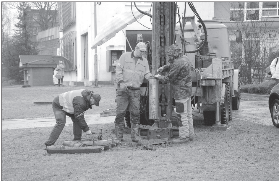
Pracovníci specializované firmy provedli v centru města několik vrtnů, jejichž prostřednictvím zjišťovali stav podloží, který musí projektanti znát pro přípravu na rekonstrukci této části Kopřivnice.