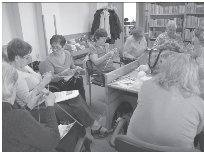
Patnáct žen přišlo do městské knihovny na akci Háčkování a pletení pro miminka. Hotové výrobky budou zaslány do Fakultní nemocnice v Ostravě.

Na zdejších linkách budou i po změně vlastníka dále vznikat produkty se značkou B&O. Celý obchod má podle oficiálního sdělení mateřské společnosti Bang & Olufsen umožnit firmě soustředit se místo provozních záležitostí zdejšího závodu na rozvoj klíčových kompetencí v oblasti technických inovací a designu.