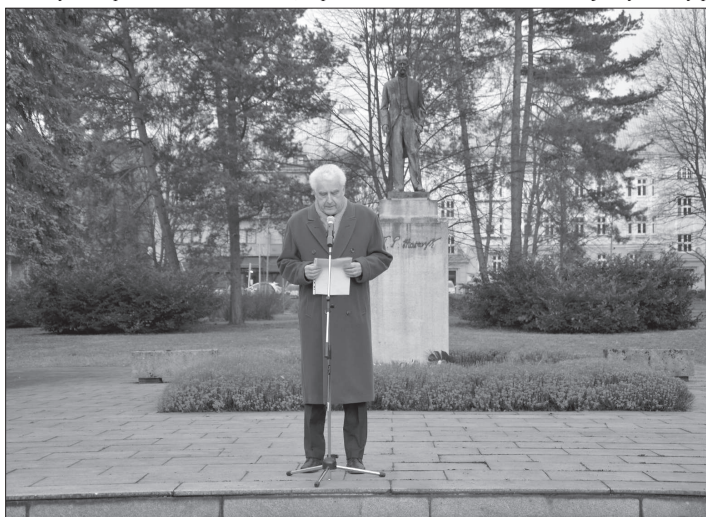
Den výročí narození T. G. Masaryka si Kopřivničané tradičně připomněli krátkým setkáním u pomníku československého prezidenta.

Vozidla k likvidaci je možno přihlásit až do 29. dubna, a to přímo na autovrakovišti, tel. 556 852 614 a 602 550 002.