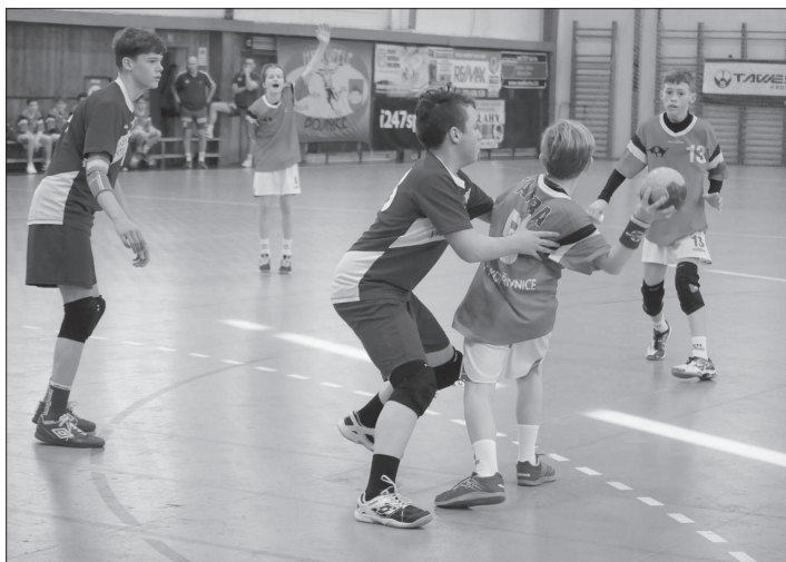
Kopřivnickí mladí házenkáři ve 3. kole Česko-Slovensko-Polské ligy vysoko porazili soupeře z Frýdku-Místku.

K dalšímu turnaji se ČSP liga přesunula koncem února do Polska. V Zawiercii kopřivnickí mladíci porazili jen Martin a stejně jako v prvním kole i v tom druhém obsadili pátou příčku. První březnový víkend se pak účastníci ČSP ligy sjeli do Kopřivnice k poslednímu kolu. Domácí tým hned v prvním utkání porazil rivala z Frýdku-Místku, s polskými