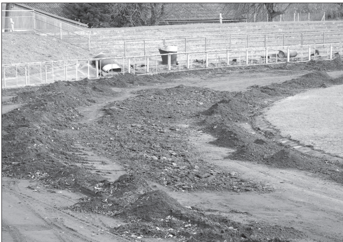
Během podzimu lidé z okolí plochodrážního klubu začali s úpravami oválu a mantinelů. Je ale pravděpodobně, že málo využívaná trať ustoupí rekonstrukci stadionu.