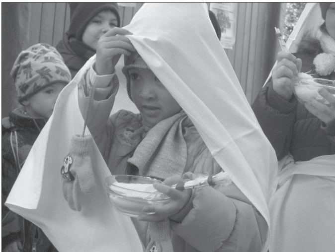
Na svátek svatě Lucie připravily děti z MŠ Francouzské vánoční program s jarmarkem, jehož výteček putoval na konto nadace Záblesk.

Kopřivnice (hod) - Město Kopřivnice dokončilo nový cyklogenerel. Plánovací dokument, který zpracovala ostravská pobočka firmy HaskoningDHV Czech Republic, spol. s r. o., a do nějž byly zapracovány relevantní připomínky odborníků, veřejnosti, dotčených orgánů státní správy a majitelů dotčených komunikací, bude určovat, jakým směrem se budou rozvíjet komunikace pro cyklisty, a to včetně jejich vybavení. Cyklogenerel je zveřejněn k nahlédnutí na webu města v sekci Dokumenty, kde najdou případní zájemci textové a grafické dokumenty včetně fotodokumentace jak průřezové, tak i návrhové části Cyklogenerelu. Dokument bude na jaře příštího roku schvalovat zastupitelstvo města.