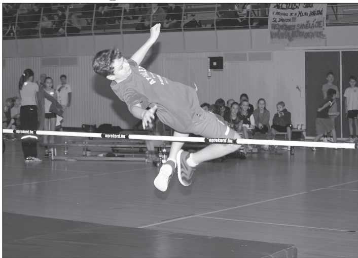
Celkem 121 žáků základních a středních škol z Kopřivnice a blízkého okolí se zúčastnilo tradičního závodu ve skoku vysokém Kopřivnická laťka.

Z výsledků soutěže škol ve skoku vysokém Kopřivnická laťka – Memoriál O. Michálka (Kopř., 15. 12.): kategorie přípravka: dívky: 1. N. Kvapilová (ZŠ E. Zátopka) 100 cm, 2. J. Krakovská 100 cm, 3. V. Hladíková (obě ZŠ dr. M. Horákové) 100 cm; chlapci: 1. L. Raška 100 cm, 2. D. Bajer 100 cm, 3. J. Holub (všichni ZŠ EZ) 95 cm; kat. nejmladší žákyně: 1. A. Tkačová 130 cm, 2. E.