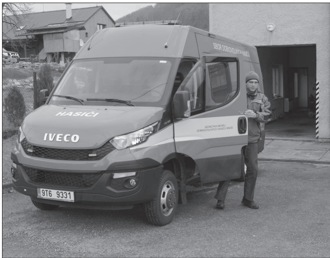
Zatímco dobrovolní hasiči z Mniší a Lubiny už svá nová vozidla používají, kopřivnická jednotka si na obnovu vozového parku počká ještě pár měsíců.