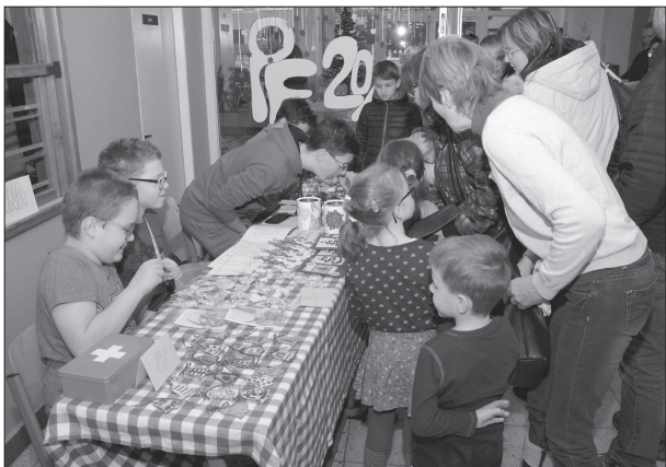
Akce v prostorách ZŠ 17. listopadu spojovala vánoční jarmark se dnem otevřených dveří.

Kopřivnice (dam) – „Přijďte se k nám podívat“, tuto výzvu, která je zároveň názvem tradiční akce, využilo minulý čtvrtek odpoledne asi 700 lidí. Pořádající Základní škola 17. listopadu voněla perníkem a vánočním punčem a po celé odpoledne nabízela pestrý program. Lidé si mohli vybrat, jestli v jedné z mnoha tříd věnovali svůj čas tvorbě vánočních ozdob, zdobení perníčků či tvorbě vánočních přání nebo raději vyrazili na některé ze série hudebních vystoupení žáků školy nebo se věnovali sportovním aktivitám. (Pokračování na straně 3)