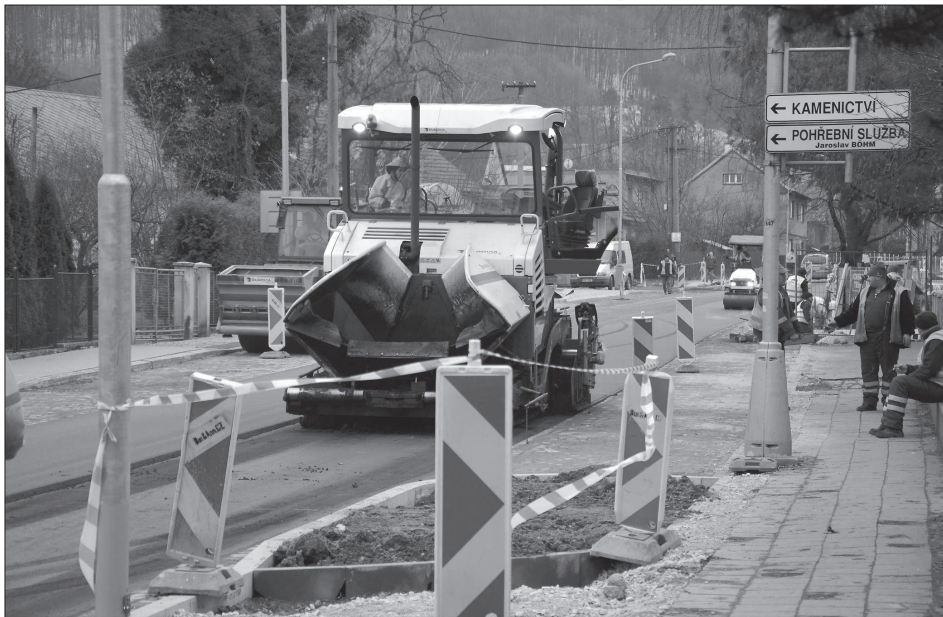
V pátek 9. prosince byla na opravený druhý úsek 1. etapy rekonstrukce ulice Štramberské položena třetí, finální vrstva asfaltu. V tomto týdnu měly být vyasfaltovány dva chybějící úseky na ulici Hřbitovní a Smetanovu.

vyhodnotí, zda kouř vycházející z komínů lokálních topenišť nepřekračuje přípustnou tmavost kouře. V rámci šetření si rovněž mohou pořídit fotodokumentaci nebo videozáznam. „V případě podezření, že tepelný zdroj provozuje daná domácnost v rozporu s povinnostmi stanovenými zákonem o ochraně ovzduší, provozovatele na toto písemně upozorníme a poučíme jej o důsledcích a možnosti provedení přímé kontroly u zdroje. Při druhém důvodném podezření bude mít úředník oprávnění kontrolu provést. Provozovatel nám musí umožnit přístup ke zdroji, k jeho příslušenství a používání paliv,“ okomentovala postup Alena Hurlíková. (Pokračování na straně 2)