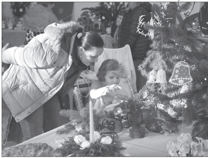
Tradiční výstava betlémů v Katolickém domě trvala čtyři dny. Během této doby si na ni našly cestu stovky Kopřivničanů.