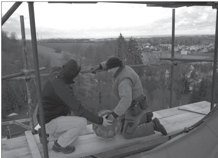
Dělníci při demontáži vrcholu věže kostela Všechných svatých ve Vlčovicích. Bání ukrývala také schránku s dokumenty, která bude otevřena dnes dopoledne.