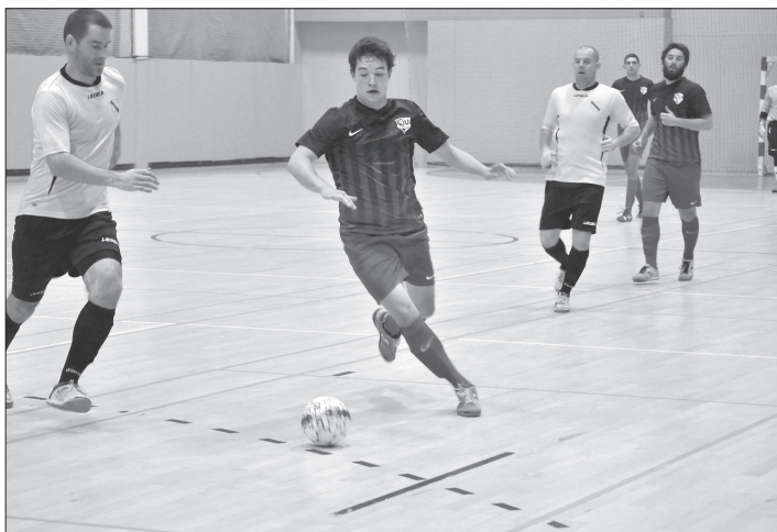
Futsalisté FU Kopřivnice vedli doma nad Krmelínem 3:0, ale nakonec brali v tomto utkání jen bod za remízu 6:6.

Výsledky 1. kola futsalové Divize F (4. 11.): Beach Boys Odry – Jokerit Kopřivnice 3:7 (2:4); branky Kopř.: P. Kružík 3, O. Chromečka 2, M. Buček, A. Šimíček; FU Kopřivnice – Dra-