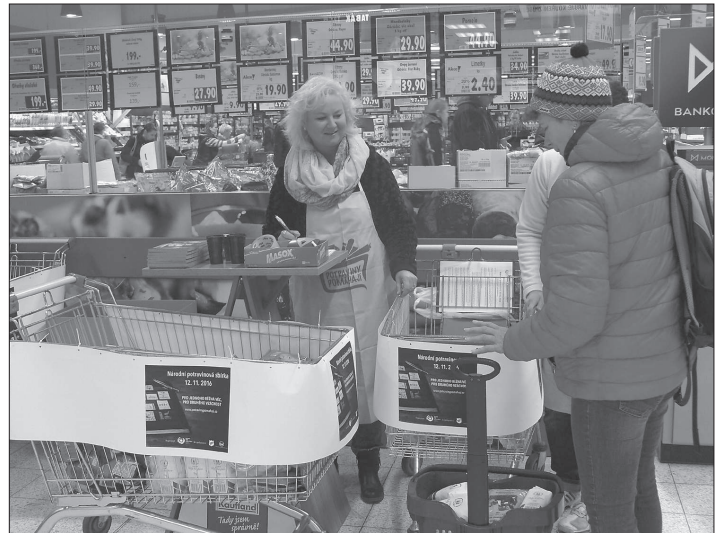
V Kopřivnici do Národní potravinové sbírky odevzdali lidé více než tunu potravin, které rozdává pracovníci Charity z Nového Jičína a Frenštátu p. R. potřebným.

V Kauflandu dobrovolníci vybrali celkem 697 kg potravin, přičemž nejčastěji se jednalo o mouku, krupici, těstoviny a mléko. V Tescu bylo do speciálních košů odevzdáno 502 kg potravin, zde lidé nejčastěji darovali rýži a těstoviny. Dle sdělení dobrovolníků, lidé nejčastěji předávali rýži, těstoviny, mouku, cukr, rýži, masové konzervy, ale také oleje, piškoty a další potraviny. „Letos jsme dostali méně sladkostí než vloni. Sladkosti dáváme do balíčků před Vánoce do rodin, kde jsou děti,“ poznamenala pracovnice frenštátské Charity.