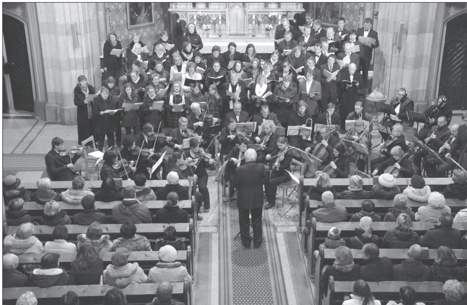
Zhruba stočlenný ansámbl hudebníků z Kopřivnice a širokého okolí vystoupil v neděli v místním kostele na koncertě, kterým připomněl letošní významná výročí Wolfganga Amadea Mozarta. Více na straně 4.