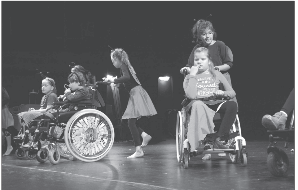
Větší důraz na spolupráci zdravých a handicapovaných dětí se odrazil i v programu 20. ročníku přehlídky Motýlek. K vidění bylo hned několik čísel připravených dětmi z běžných škol a speciální školy Motýlek.

O termínech čištění budou řidiči informováni s týdenním předstihem přenosným dopravním značením. „Majitelé vozidel musejí přeparkovat svá vozidla mimo čištěnou zónu, neboť platí, že po dobu čištění bude v dotčené lokalitě zakázáno stání vozidel,“ poznamenala Dagmar Šmířáková. Seznam čištěných lokalit s termíny úklidu je zveřejněn na straně 6 dnešního čísla KN.