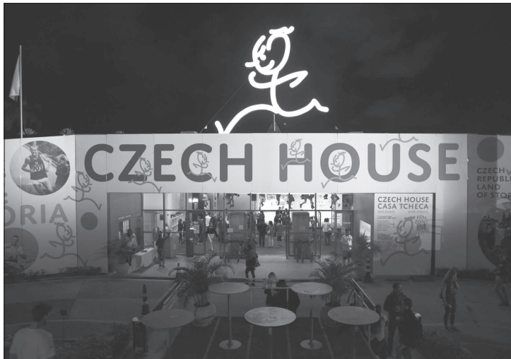
Neonová postavička běžícího Emila Zátorka, která v době olympiády zdobila český dům v Riu, by měla natrvalo zakotvit v Kopřivnici.

Nově vybudovaný chodník je zhruba 42 metrů dlouhý s novým veřejným osvětlením. Stavbu pro město na základě výběrového řízení provádělo Slumeko. „To i přes nepříliš vhodné klimatické podmínky chodník dokončilo o měsíc dřív, než stanovila smlouva. Nyní zbývá jen dokončit bezpečnostní zábradlí;“ uvedl Martin Lapčík, vedoucí oddělení investic s tím, že Slumeko za realizaci této zakázky po jejím úplném dokončení obdrží od města 560 tisíc včetně DPH.