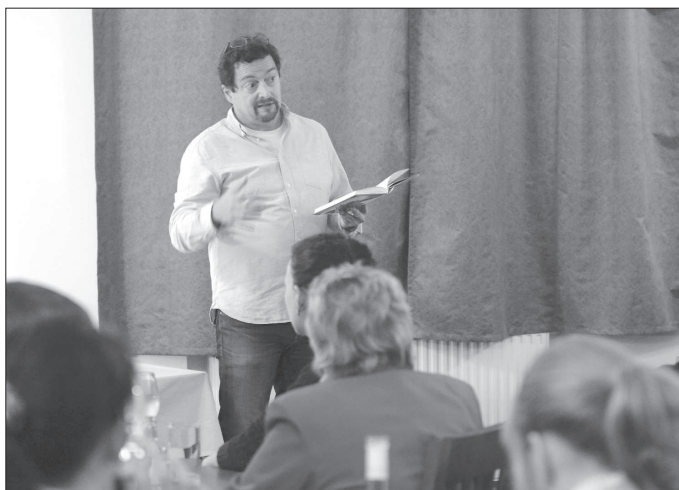
V nově zrekonstruované Bönischově vile představil Michal Viewegh svou románovou novinku Melouch.