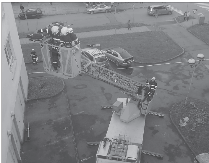
Při taktickém cvičení požáru v kulturním domě místní jednotka dobrovolných hasičů otestovala funkčnost nové speciální výškové techniky.

V rámci tohoto cvičení měli kopřivničtí dobrovolní hasiči možnost vyzkoušet speciální techniku, kterou obdrželi v letošním roce.