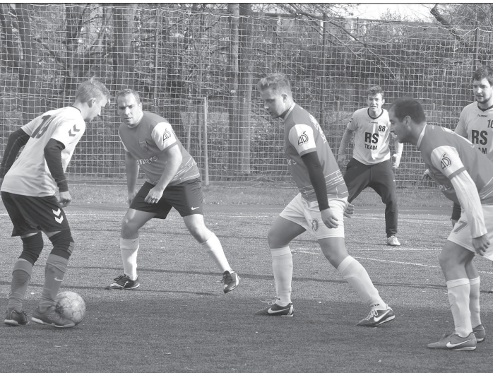
Hráči mužstva Gunners Kopřivnice stavi obranný val proti soupeři, RS Team však v tomto duelu těsně zvítězil.