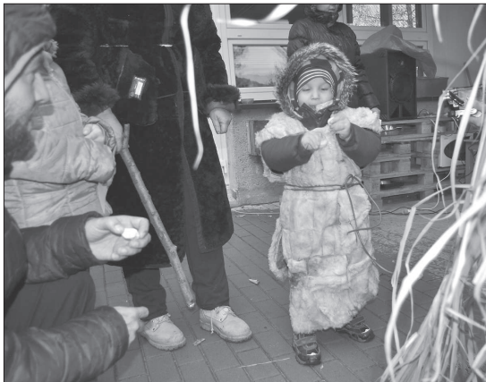
Zavírání zahrady MŠ Francouzské bylo v duchu pravěku. Děti plnily různé úkoly, například vykřesat jiskru.