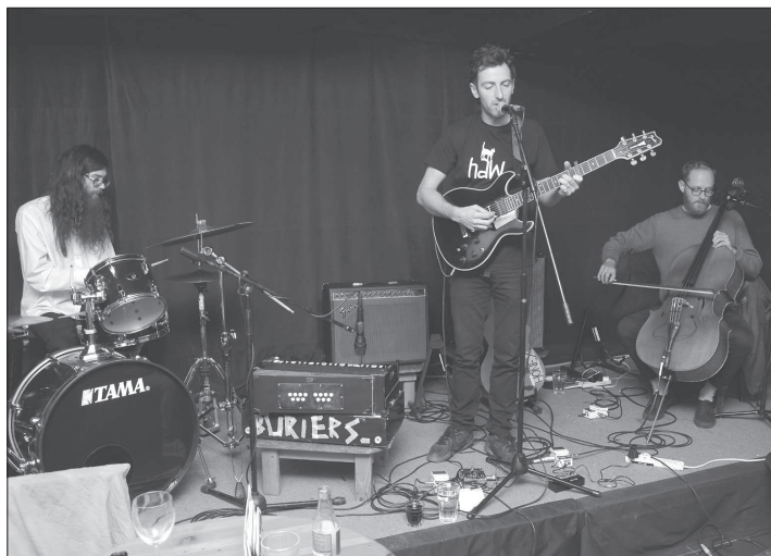
Kopřivnice byla v neděli nejménějším městem, ve kterém se britská kapela Buriers zastavila během svého aktuálního evropského turné.