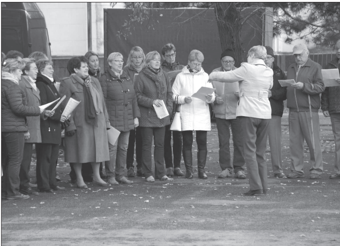
Součástí krátké oslavy dne republiky u pomníku T. G. M. bylo tradičně i vystoupení Pěveckého sdružení Kopřivnice.

Ve čtvrtek 17. listopadu proběhne oslava Dne boje za svobodu a demokracii. Pietní akt se uskuteční v 17 hodin u pamětní desky obětem komunismu umístěné na budově Základní školy dr. Milady Horákové. Po položení kytic a proslovu vyjde průvod se svíčkami a lampiony a projde Štefaníkovou a Štramberskou ulicí na náměstí TGM, kde bude připraven krátký kulturní program.