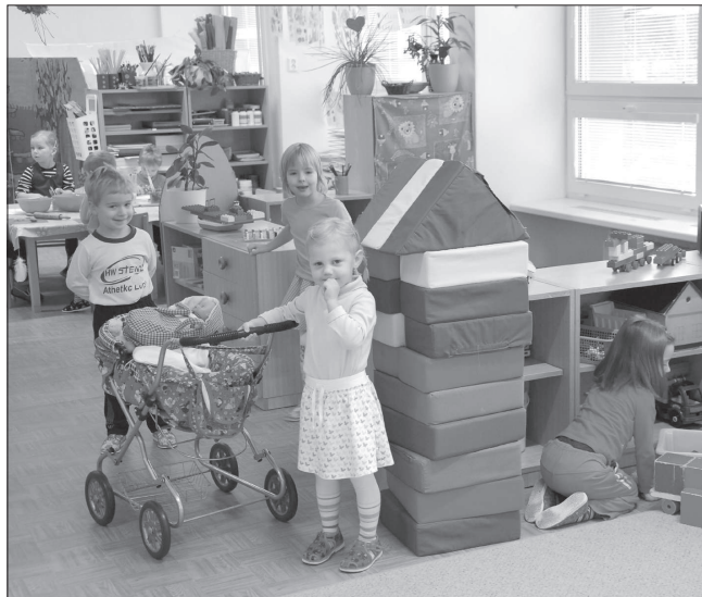
V Kopřivnici není problém s umístěním tříletých a starších dětí do mateřských škol.

V Mateřské škole Polárka při ZŠ 17. listopadu volná místa nejsou. Do tohoto zařízení bylo podáno 28 žádostí, přičemž 12 z nich nebylo vyhověno nejen z kapacitních důvodů, ale i z důvodu nízkého věku dítěte.