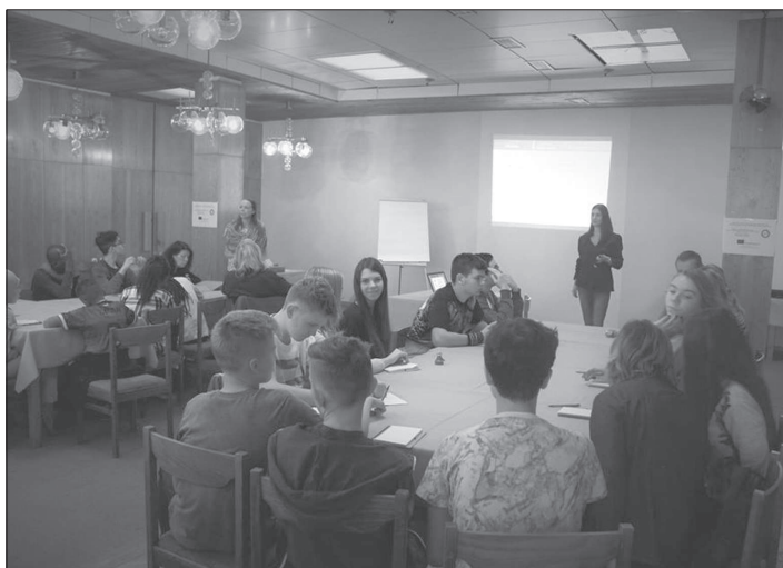
Třetí fáze mezinárodního projektu O našem městě chceme rozhodovat s vámi proběhla v minulém týdnu v Malenovicích.

Během týdenního pobytu v Malenovicích došlo nejen na prezentaci už vytvořené metodiky, ale také na vzdělávání mladých účastníků v oblasti komunikace či projektového řízení. Všichni účastníci projektu si pak užili i spoustu zábavných aktivit, výlety do Beskyd nebo třeba i do Dolní oblasti Vítkovic.