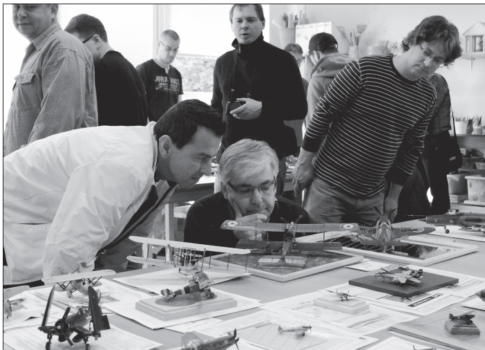
V soutěži o Kopřivnické poháry se letos utkalo rekordních 183 modelů. Podle porotců jejich kvalita rok od roku roste.