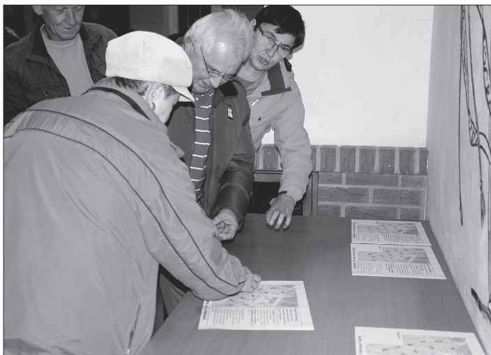
Obyvatelé ulice Komenského mohli po diskuzi hlasováním sdělit svůj názor na řešení dopravy na ulici, na které bydlí. FOTO: DANA HOĐÁKOVÁ

Poslední, čtvrtá aktivita zvyší odbornou úroveň i kvalifikaci zaměstnanců městského úřadu. „Ti se budou vzdělávat například v komunikaci s klienty, ve znalostech v legislativě, která se neustále vyvíjí, ale také aby zvládli nástrahy kyberprostoru. Vzdělávání bude rozloženo do dvou let,“ poznamenala vedoucí strategického plánování.