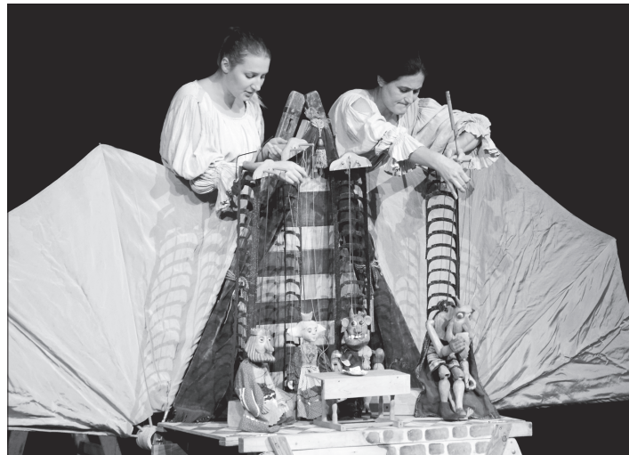
Čertovská pohádka v podání jihočeského divadla Studna zřijemnila malým návštěvníkům kulturního domu předposlední říjnovou nedělí.

Dvacetý ročník přehlídky by si zasloužil početnější publikum, velkou část osazenstva sálu, možná i díky stavebním pracím ztíženému přístupu, totiž tvořili členové kvarteta vystupujících sborů.