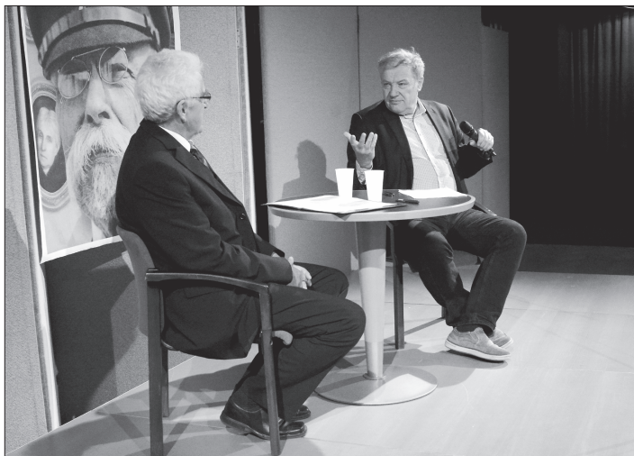
Někdejší diplomat a politik Martin Palouš si pozornost publika vysloužil nejen tím, že byl novou tváří diskuzního setkání, ale i svým zamyšlením.

Ani ve světě takových lidí mnoho není. Teď mě velice překvapil slovenský prezident Kiska, když vystoupil v Praze na konferenci Fórum 2000. Řekl bych, že jakkoliv má vlastní genezi a určitě to není profesor, který by se zabýval filosofií, je typem politiků s ideály. Dovedu si představit, že ve světě jsou někde další