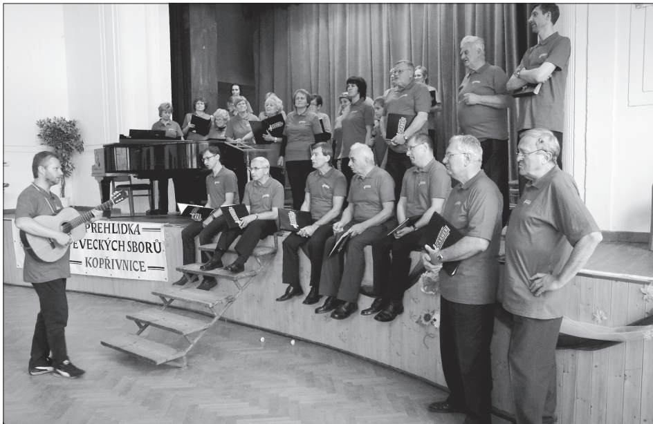
Sbor Carmen ze Zábřehu na Moravě se na 20. ročníku zdejší přehlídky pěveckých sborů představil v symbolicky uvolněném duchu. Spolu s nimi vystoupily ještě další tři sbory. Více čtěte na straně 4.

Kopřivnice (hod) – Občané bydlící v rodinných domcích na ulici Komenského si stěžují na to, že se zvýšil provoz a projíždějící automobily jezdí příliš rychle a ne zřídka také v protisměru, čímž neohrožují nejen je, ale i všechny procházející. Obrátili se proto na radnici a žádali, aby situaci řešila. V nedávné době radnice umístila mezi ulici Tyršovu a Palackého zpomalovací polštáře. (Pokračování na straně 2)