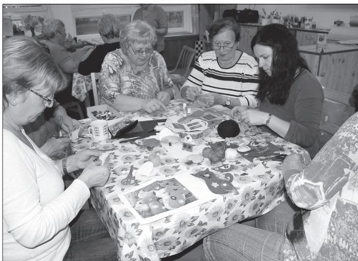
V domě dětí a mládeže strávilo ve čtvrtě 19. října patnáct senierek, které v rámci kreativní dílny sbíraly inspiraci pro svou další tvorbu.

„Na této akci mě nejvíce překvapila atmosféra, nezvyklý klid, pohoda a zaujetí přítomných 'děvčat' při zkoušení různých technik výroby. A také radost, když se jim výrobek podařil. Od pracovníků domu dětí získaly i další inspiraci, které jim mohou pomoci při výrobě dárků pro své nejbližší. Některé účastnice se objevily na akci z programu 'Aktivní senior' poprvé a pro-