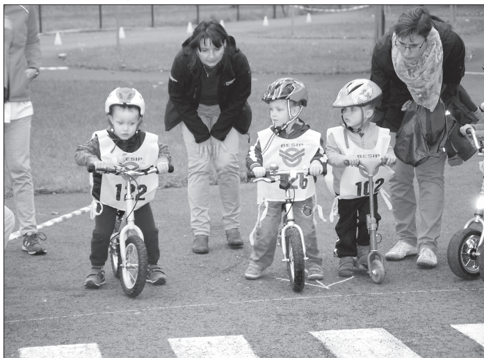
Jen ti nejmenší stačili absolvovat závody na koloběžkách a odrážedlech na dětském dopravním hřišti ve středu 21. září, než se spustil silný déšť, který zrušil závody.