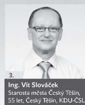
3. Ing. Vít Slováček Starosta města Český Tešín, 55 let, Český Tešín, KDU-ČSL