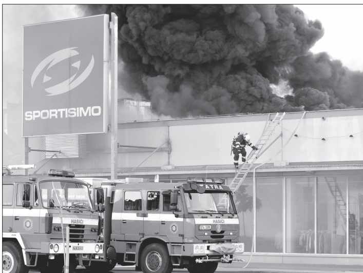
Plameny a hustý dým stoupající ze střechy obchodního centra byly vidět na kilometry daleko a k místu nešťestí přitahovaly stovky zvědavců.