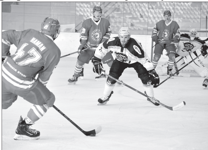
Kopřivničtí hokejisté si doma zahráli proti třineckým juniorům, kteří pod vedením Václava Varaďi měli v Kopřivnici týdenní soustředění.

Za sebou má mužstvo, jež v loňském roce vypadlo v prvním kole play-off s pozdějším vítězem druhé ligy Frýdkem-Místkem, pět přípravných utkání. Čtyřikrát změnilo síly s druholigovými celky a jedním soupeřem pak byla juniorka Třince, se kterou absolvoval v Kopřivnici soustředění její trenér a slavný hokejista Václav Varaďa. Kopřivničtí muži přehráli juniorské mistry republiky 6:4, ale neměli to vůbec jednoduché. Dravé mládí zlobilo především v první třetině, poté se však hra vyrovnala a nakonec vítězství strhli na svou stranu místní borci. „Bylo vidět, že hráči obou mančaftů bojují o místo v sestavě. Zkoušíme teď nově hráče a začátkem září by měl kádr dostat definitivní podobu. Pak budeme dolaďovat střídavě staré. Dnešní utkání nám opět ukázalo, že ne všichni mají na to hrát druhou ligu. Bo-