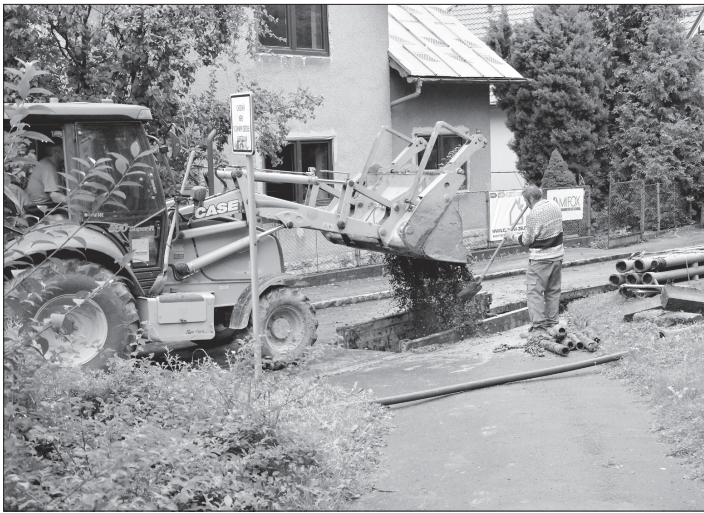
Nutnost oprav vodárenských zařízení může v budoucnu díky změně pravidel při povolování staveb znamenat pro město finanční zátěž navíc.

Krytý bazén je jedním z objektů ve vlastnictví města, kde byly realizovány úpravy v rámci projektu EPC, které mají snížit energetickou náročnost. I z tohoto důvodu zde bylo nutno provést výměnu řídicího systému, neboť ten původní byl poruchový a navíc na něj už nebylo možné sehnat náhradní díly, bylo rozhodnuto o jeho výměně. „Tyto práce prováděli pracovníci EVČ, s. r. o., Pardubice a Amper Saving, a. s., Praha a na jejich financování se spolupodílelo město s realizátorem projektu EPC. Podíl města činil 119 264 korun včetně DPH,“ upřesnil Miloš Sopuch s tím, že tyto práce by firma měla dokončit do 1. září.