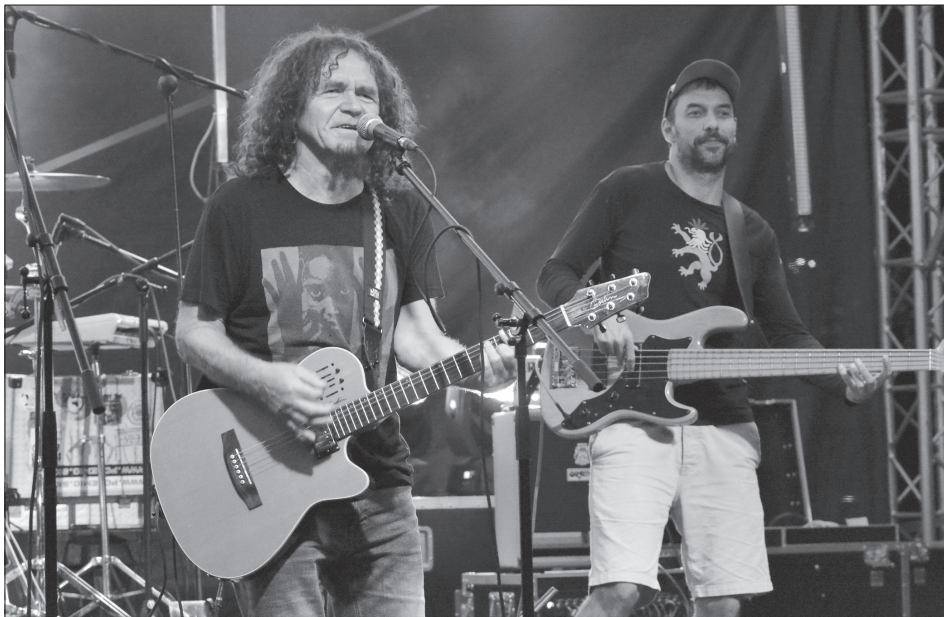
Reggae v podání kapely Švihadlo prosytlo Kopřivnici náladou letního večera. Jinak ale předpoutový Bartolomějský večer patřil místním muzikantům.

Další dvě výměňkové stanice na ulici Kadláčkové a Družební byly proměněny v hromadná garážová stání. Z nabízených 14 stání pro osobní automobily byly zatím schváleny nájemní smlouvy pro 6 z nich. Při součtu nájmemného nabídnutého jednotlivými nájemci by město ročně mohlo za parkování těchto šesti vozů inkasovat víc jak 72 tisíc korun. Kapacita nových garáží v obou zmíněných výměňkových stanicích není vyčerpána, a tak radni nechali zveřejnit záměr pronájmu dalších parkovacích míst. (Pokračování na straně 3)