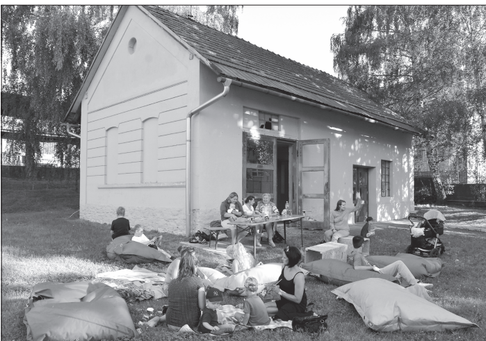
Minulý pátek se sympatizanti Purpury a jejího projektu Galerie Galaxie sešli na odpoledním pikniku v parku.

ul. Lidická u Zelného trhu ul. Alšova u č. p. 1139 ul. Obránců míru u č. p. 301