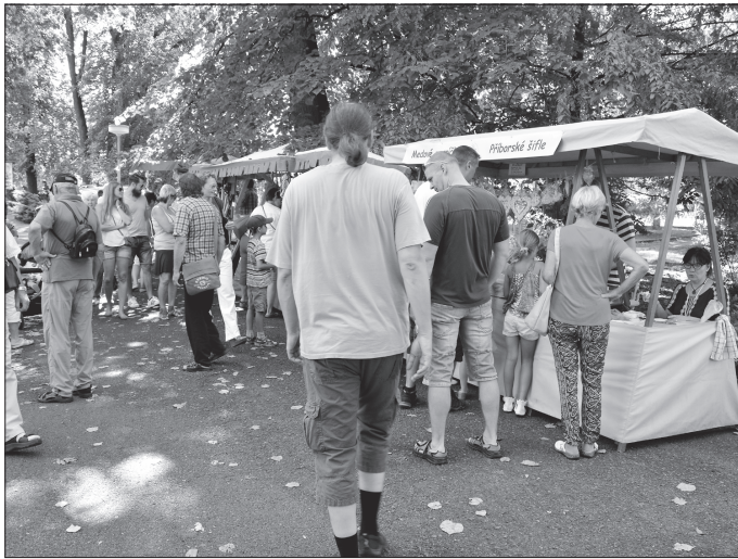
Sobotní starodávný jarmark v sadu E. Beneše přilákal během dopoledne a brzkých odpoledních hodin na program i řemeslné výrobky velkou spoustu lidí.