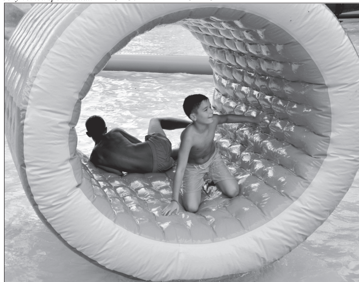
Atraktivní vodní hrátky jako součást programu Někdo ven??? letos propadly. Nízký zájem účastníků měly ale na svědomí rozmary počasí.