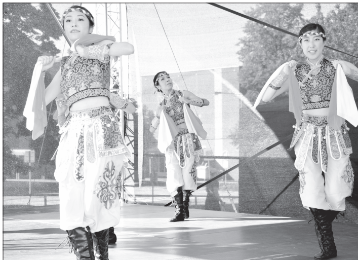
Folklorní soubor La Pen V Innovative Dance Platform předvedl kopřivnickému publiku v pátek 26. srpna zhruba hodinový program s devíti tanečními čísly inspirovanými lidovými tradicemi Dálného východu.

Prohlídka nemovitosti je možná po dohodě s pracovníky Odboru majetku města, oddělení správy budov a komunálního hospodářství, Štefaníkova 1163, 8. poschodí, dveře č. 883, tel. 556 879 694. Podrobné informace na webových stránkách www.koprivnice.cz nebo na úřední desce před městským úřadem.