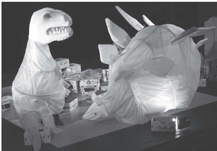
Herci Městského divadla Zlín v útrokách gigantických textilních loutek ztvárnili na jevišti zdejšího kulturního domu slavnou scénu souboje dinosaurů z filmu Cesta do pravěku.

Křest knihy, který proběhl 23. června symbolicky ve fanzóně českého olympijského týmu v pražském obchodním centru Quadrio, navštívila řada slavných sportovních osobností. Mezi gratulanty nechyběla Věra Čáslavská, Jarmila Kratochvílová a mnoho dalších. Desítky fanoušků v dlouhé frontě čekaly na podpis Danu Zátopkovou do nové knihy. Tu je možné sehnat v běžných knihkupectvích, za zvýhodněnou cenu ji nabízejí také Regionální muzeum Kopřivnice.