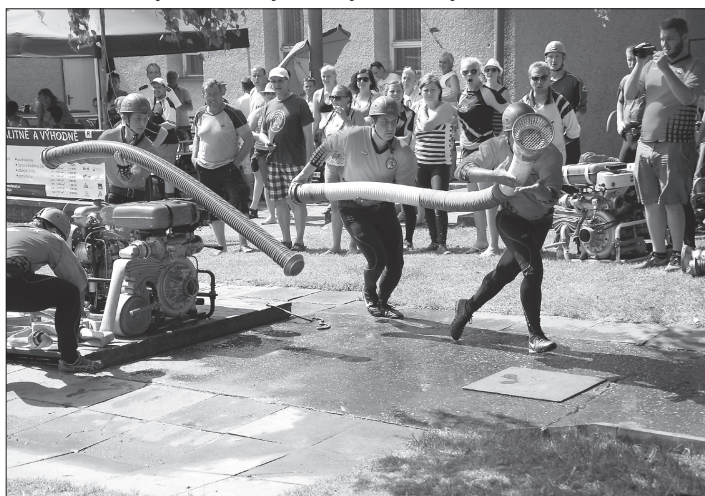
V sobotním závodě KOVOK Cup v Mniší předvedlo nejlepší požární útok družstvo z Tisku. Mnoho vyhrálo nejpočetněji obsazenou kategorií v čase 14,22 s.

Závod se zúčastnilo celkem 30 družstev, z toho bylo 16 družstev mužů, 5 ženských a devět družstev v kategorii nad 35 let, což byla rekordní účast v této věkové kategorii. „Soutěž probíhala za velmi horkého počasí, bez technických problémů i zranění,“ zhodnotil průběh soutěže Svatopluk Holub, velitel jednotky SDH Mniší. Ten poznamenal, že v kategorii nad 35 let byly rozdíly mezi prvním, druhým a třetím místem v setinách sekund. Nejuspěšnějším družstvem byl Tísek, který vyhrál v čase 14,22 s. Druhou příčku obsadil pořadající tým Mniší (14,39 s), třetí místo vybojovaly Závěšice s časem 14,47 s. Tým z Lubiny skončil na 11. místě. V ženách vyhrálo družstvo z Hukovic (19,39 s) před Tiskem (19,49 s) a Trojanovicemi (20,89 s). V týmech mužů nad 35 let vyhrálo družstvo z Vlčovic (15,90 s), druhou příčku obsadily Výškovice (15,99 s) a třetí skončili domácí (16,00 s).