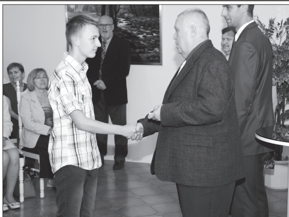
Přání hezkých prázdnin a drobný dárek v podobě flashdisku si z obřadní síně zdejší radnice odnesli vyznamenaní devátáci.

Všichni žáci devátých ročníků se pak ve středu 29. června se školními lavicemi rozloučili v centru města na posledním zvonění ve vesmírném stylu.