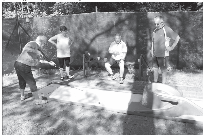
Seniři, kteří před týdnem přišli na minigolfové hřiště, se při hře příjemně bavili. Některým to šlo lépe, jiní dostali míček do jamky na víc úderů.