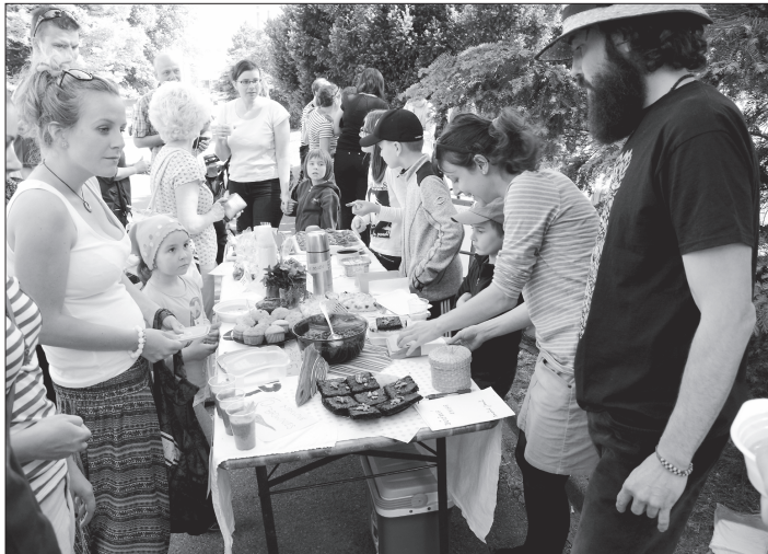
Sousedské restaurace nabízely své menu tentokrát v okolí budoucí galerie Galaxie. Restaurant Day se v Kopřivnici uskutečnil poasmé.

Kopřivnice (dam) – Jen několik hodin nabízeli pochoutky ze svých kuchyní amatérští restauratéři z Kopřivnice. Ti se sešli v sobotu 21. května v okolí budoucí galerie Galaxie v parku E. Beneše. Restaurant Day je celosvětově rozšířená myšlenka zaměřená na komunikaci mezi lidmi a vychází z premisy, že nejlépe se lidé baví u dobrého jídla a pití. V Kopřivnici se takto lidé potkali už poasmé. Tentokrát jim své pochoutky nabídlo hned šest improvizovaných restaurací, které nabízely sušenky, muffiny, polévky, nejrozličnější pomazánky, ale také domácí nápoje a podobně.