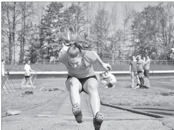
Atletická soutěž základních a středních škol Pohár rozhlasu má za sebou okresková, okresní i krajská kola a končí bude republikovým finále.

Po okreskových kolech proběhlo ve středu 18. května na novojičínském stadionu okresní finále Poháru rozhlasu, sou-