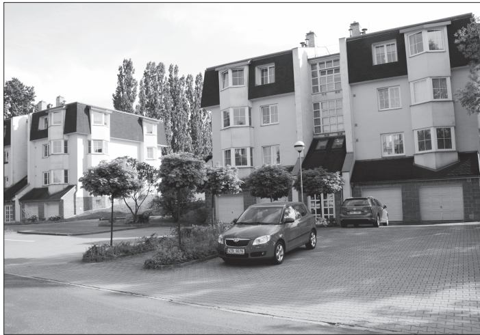
Bytové domy na ulici Pod Bílou horou jsou poslední, které město postavilo. Nyní jedná s nájemníky o podmínkách privatizace.

„Zda se touto jednorázovou akcí podaří omezit tvorbu černých skládek, nelze zatím říci. Avšak dle množství odevzdaných pneumatik předpokládáme, že tomu tak bude,“ dodala Lucie Kubalová.