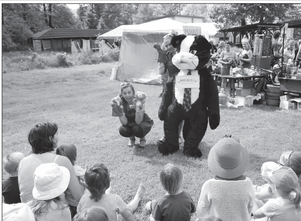
Maňáskové divadlo kocoura Kofika bylo jedním z doprovodných programů sobotního festivalu Šostýnská Venuše.

Kopřivnice (hod) – Pořadatelům tanečního festivalu Šostýnská Venuše počasí přálo, a tak se víc jak šest stovek diváků, kteří přišli do areálu kopřivnického koupaliště, příjemně bavilo. O úvodní tanec se postaraly členky taneční skupiny Farridah Kopřivnice, které byly zároveň organizátorkami akce. Po nich pak pódium patřilo dětem, které tančily nejen orientální tance, ale i zumbu. Následně je opět vystřídal dospělí tanečníci. K vidění byly různé tance, flamenco, swing, flirtdance a další. Hlavní hvězda, profesionální tanečnice a lektorka břišných tanců Eglal, zatančila hned dva tance. (Pokračování na straně 4)