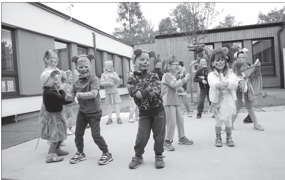
V rámci slavnostního otevření nově zrekonstruované zahrady Mateřské školy Pionýrská v přírodním stylu, které proběhlo v úterý 17. května, bylo i vystoupení dětí navštěvujících toto vzdělávací zařízení.

V Alšově škole se budou rekonstruovat sociální zařízení v levé části pavilonu učeben, a to ve třech podlažích. Součástí zakázky je nejen komplexní výměna zařízeníových předmětů, obkladů a dlažeb, ale i dispoziční úpravy prostor, rekonstrukce zdravotnických, elektroinstalace a vzduchotechniky. „V této škole jde již o druhou etapu rekonstrukce sociálních zařízení. Firma Beskydgroup z Frýdku-Místku zahájí práce 1. července a hotova s nimi má být dle smlouvy do 19. srpna. Za tuto zakázku firma od města obdrží 2 304,5 tisíce korun včetně DPH,“ uvedl Miloš Sopuch, vedoucí oddělení technické správy. (Pokračování na straně 2)