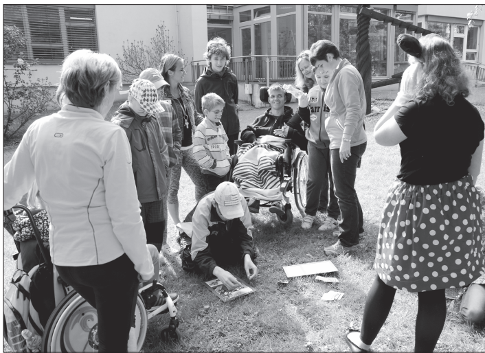
Záci základní školy z Mořkova připravili pro klienty kopřivnického Motýlka sportovní den s řadou soutěžních disciplín.

„Město si vytěžené dřevo prodává samo a vloni za něj utržilo celkem 2,5 milionu korun. Dalších 47 tisíc korun jsme získali z prodeje vánočních stromků,“ uvedl Jaroslav Jiřík. Hospodaření v lesích se provádí dle schváleného Lesního hospodářského plánu na období 2014-23. „Po započtení všech nákladů na těžební a péstební práce, opravy komunikací, správní náklady a výnosy bylo vloni hospodaření opět ziskové, neboť zisk činil 1,1 milionu korun,“ zhodnotil loňský rok Jaroslav Jiřík.