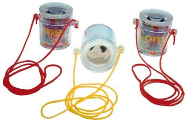
Pozorovací dóza s lupou