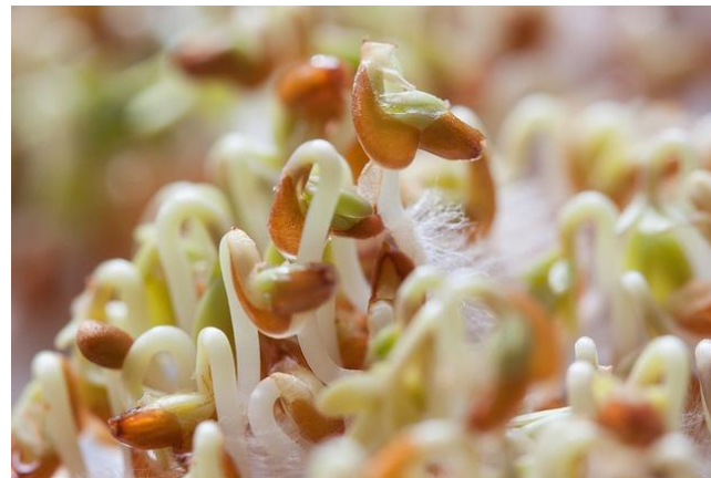
Semínka – pozorování růstu