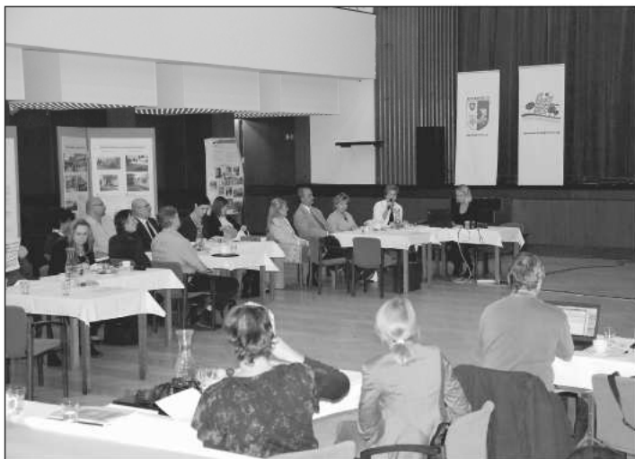
Pracovní radnice ve spolupráci s lidmi z nezávislých organizací v rámci obhajoby před hodnotící komisí demonstrovali na příkladech, co se v Kopřivnici událo nově za poslední rok.