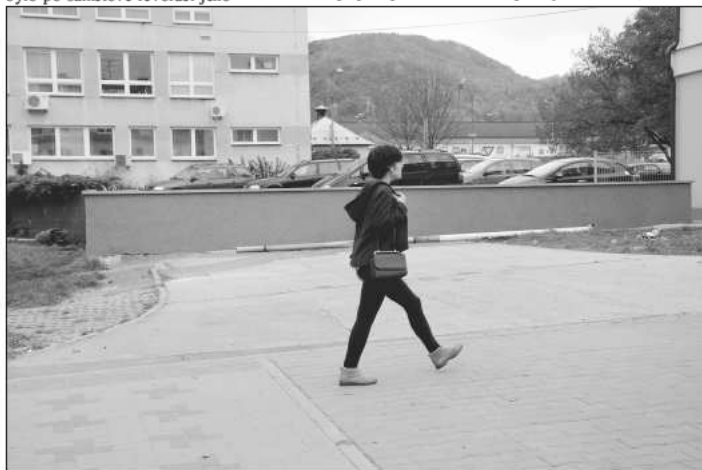
Zidka, která přehradila frekventovaný chodník u místní polikliniky, bude důvodem místního šetření v rámci aktuálně probíhajícího řízení o dodatečném povolení stavby.