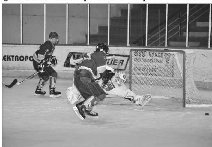
Jedna z mnoha šancí kopřivnických hokejistů, která neskončila gólem. I tak si na domácím ledě připsali tři body za výhru.