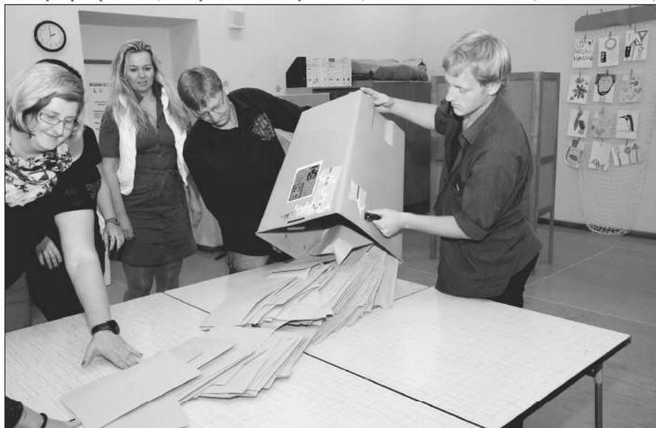
Počítání hlasovacích lístků trvalo členům komisi v porovnání s ostatními volbami déle. V komunálních volbách totiž lidé mohli volit až třemi způsoby, což zvyšovalo náročnost na vyhodnocení výsledků.