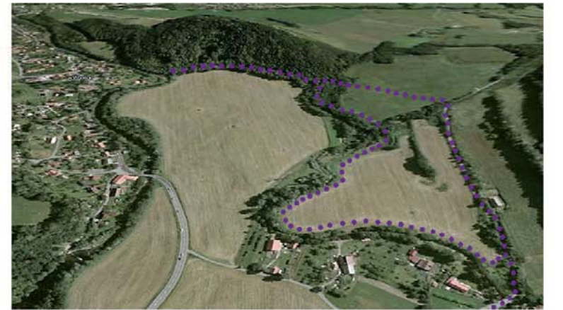
Prověřované trasy - levý břeh Tichávky