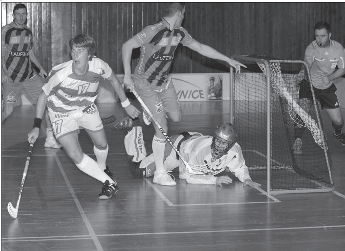
Vikingové dokázali na domácí palubovce navázat na vítězství v Praze a s favorizovaným Znojmem vyhráli na návštěvu.