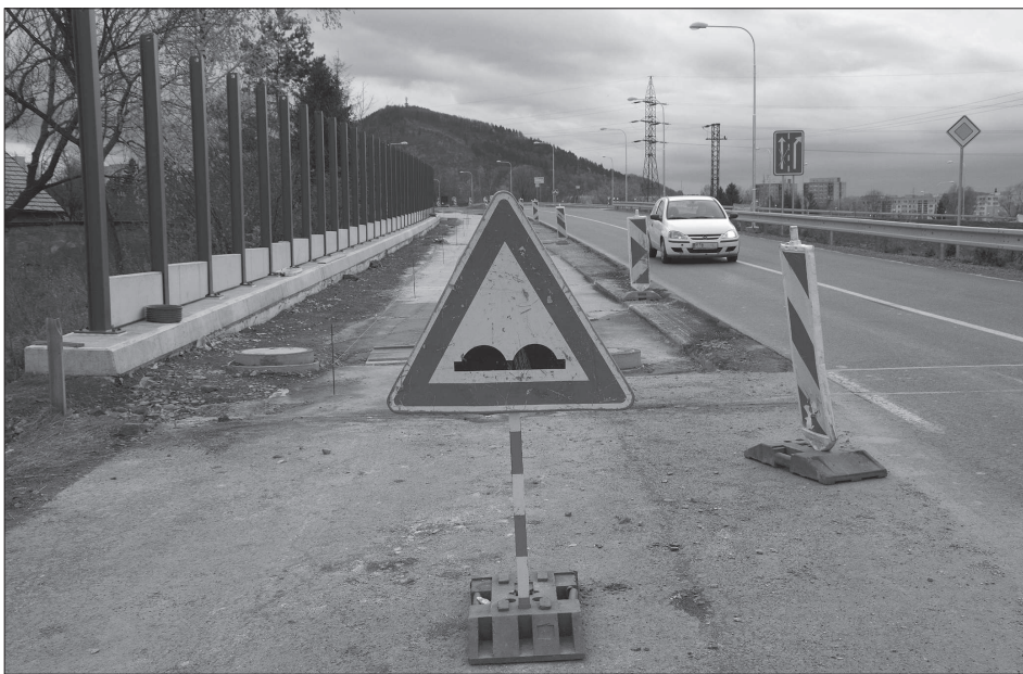
Stavební firma finišuje s pracemi na opravách silničního mostu nad železniční tratí. Otevření druhé poloviny mostu i sjezdové rampy na ulici Dělnickou by mohlo proběhnout dřív, než bylo avizováno, a to začátkem prosince.

S případným posunutím začátku obce o přibližně 765 metrů má správce komunikace také problém. Trvá totiž na tom, že silnice byla vybudována jako obchvat Příbora a vede mimo souvislou zástavbu. Místo pro přecházení Na Holotě bylo prý zřízeno tak, aby převedlo chodce přes silnici bez omezení provozu na silnici první třídy. Správa silnic tedy s posunutím označení začátku obce nesouhlasí podobně jako Dopravní inspektorát, který prý také deklaroval nesouhlas s úpravou dopravního značení. (Pokračování na straně 3)