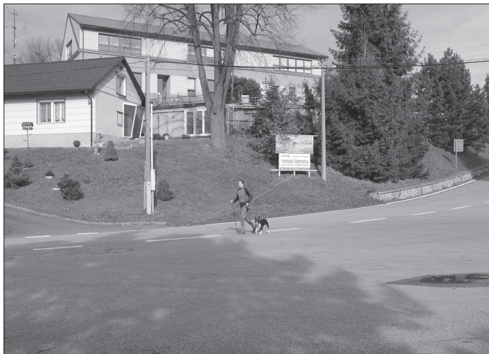
Kolem silnice pod školou v Mniší by měl na jaře vyrůst nový chodník, jenž přispěje ke zvýšení bezpečnosti procházejících dětí i dospělých.

Pokud je oheň malý a dým neobtěžuje ve zvýšené míře okolí, řeší strážníci tyto případy domlouvu. „Pokud se šíří velký dým a zápach, řešíme případy blokově. Pokud tak může dosáhnout až tisíc korun. V případě, že dotyčný nechce pokutu uhradit, předáváme případ k dořešení přestupkové komisi,“ přiblížil velitel městské policie, jak jsou přestupky řešeny.