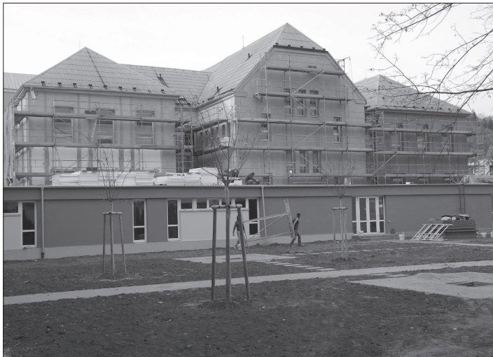
Rekonstrukce ZŠ dr. Milady Horákové se chýlí ke konci. Stavební práce by měly být dokončeny v polovině měsíce.