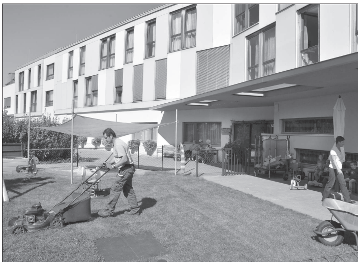
Kopřivničtí zastupitelé, ale i zástupci zdejších seniorů navštívili domov pro seniory v dolnorakouském Grafenwörthu.

Po prezentaci fungování domova si hosté z Kopřivnice prošli celé zařízení. „Viděli jsme úplně jiný přístup k této problematice, než na jaký jsme byli zvyklí. Určitě i u nás se najdou zařízení, která fungují také velmi dobře. Každopádně je to velmi dobrá inspirace. Důležitá je ale i ekonomika takového provozu a je třeba hledat cesty, jak takový vysoký standard i v budoucnu ufinancovat,“ poznamenal Jiří Novák. Také podle starosty Jalůvky byla druhá cesta do Rakouska užitečná a má pomoci Kopřivnici bližší se rozhodování o zdejší podobě domova pro seniory. „Teď musíme přesně sformulovat, co chceme. Jde o to, jestli to, co jsme viděli v Rakousku, je správný model budoucího kopřivnického domova pro seniory. Následně pak pro prosincové zastupitelstvo připravíme ke schválení kroky, které nás začnou posouvat zvoleným směrem,“ nechal se slyšet starosta Jalůvka. Podle jeho slov by už před zahájením stavby mělo být jasno o budoucím modelu provozování domova pro seniory. „Předpokládám, že abychom dosáhli podobného standardu jako v Rakousku, budeme hledat partnera v koncesním řízení,“ uzavřel starosta s tím, že o věci bude jednat zastupitelstvo ještě letos v prosinci.