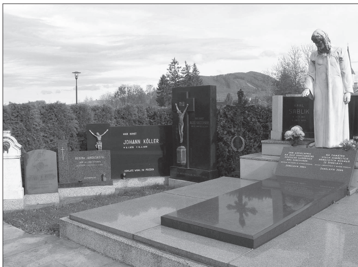
Sablíkova hrobka na ženklaavském hřbitově uchovává pamětní desky po dnes již zaniklých německých hrobech.

Po osamostatnění obce v roce 1990 začala být hřbitovův věnována patřičná péče. Uličky a prostranství byly pravidelně sečeny a hřbitov dostával důstojný