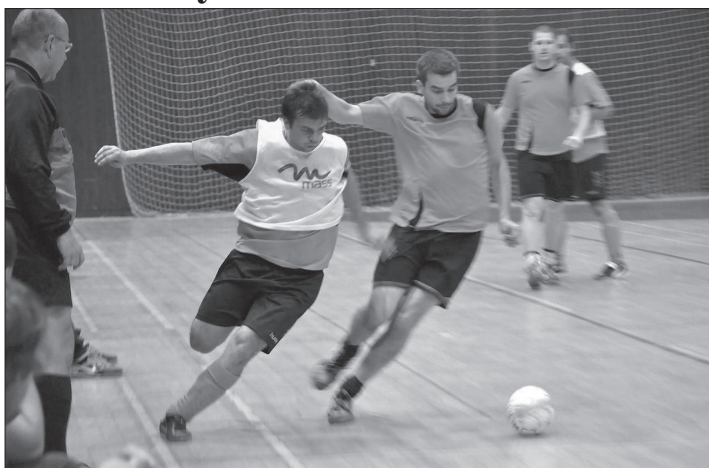
V úvodním turnaji 2. třídy NJ byli mimo jiné úspěšní Gunners Kopřivnice, kteří porazili Ženklavu 5:3 (na snímku) a Chupaderos Štramberk 5:0.

Dohromady dvanáct mužstev se představí v 1. třídě NJ. Tým se střetnou jedenkrát s každým a poté bude pro nadstavbu soutěž rozdělena na dvě poloviny, přičemž všechny výsledky se započítávají dále. V nadstavbové části se navzájem utkají týmy na 1. – 6. místě, které budou hrát o postup, a týmy na 7. – 12. místě, jež budou bojovat o setrvání v sou-