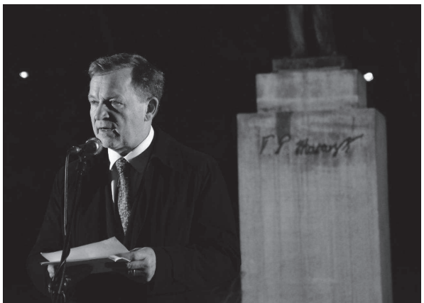
Oficiální oslava výročí založení samostatného státu proběhla tradičně před pomníkem prezidenta Tomáše Garrigue Masaryka, letos přímo 28. října.