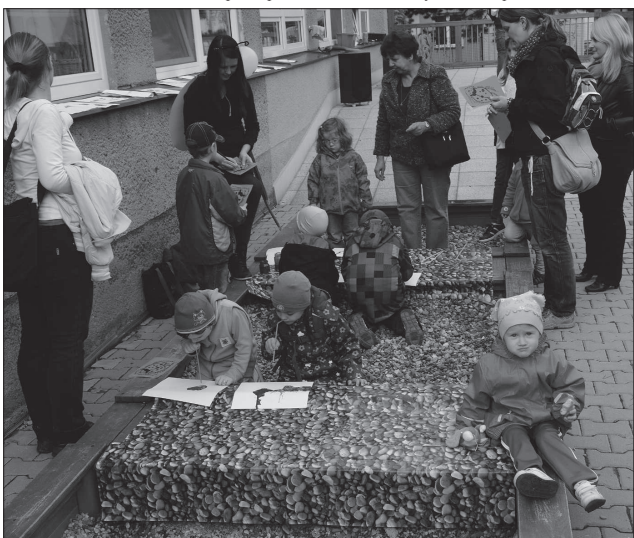
Hry, které měly děti nejen pobavit, ale zároveň byly také logopedickými cvičeními, byly připraveny na akci Povídání na zahradě.