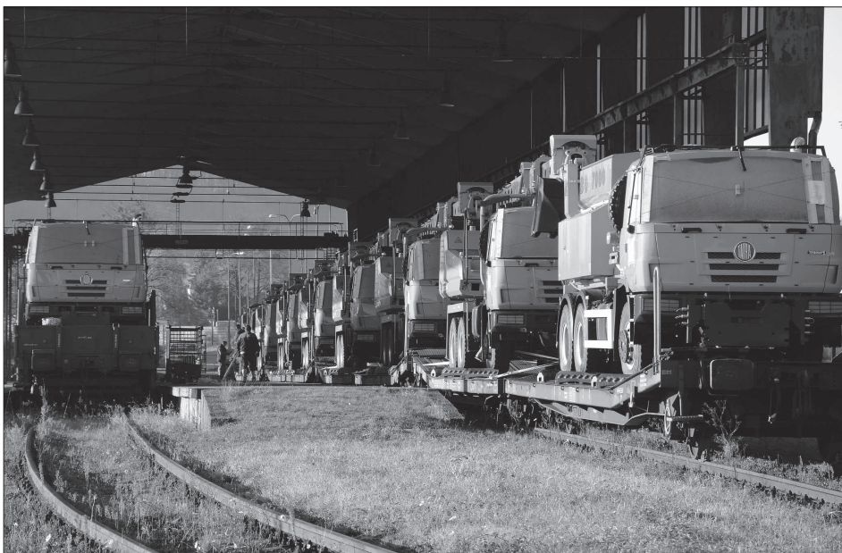
Vlak se zásilkou padesáti tatrovek se speciálními nadstavbami v těchto dnech zamíří z Kopřivnice do Ázerbájdžánu. Podle obchodníků Tatra Trucks se automobile postupně daří vracet se na trhy na východě.