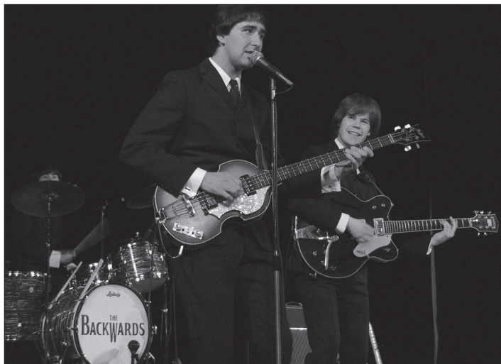
Prvního listopadu se do Kulturního domu v Kopřivnici po několikaleté pauze znovu vrací slovenský revival Beatles The Backwards.