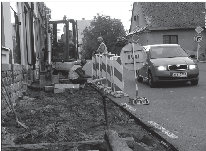
Výbudování přechodu pro chodce před restaurací v Prosku výrazně přispěje ke zvýšení pasivní bezpečnosti. Po dobu opravy bude průjezd inkriminovaným místem řízen semaforem.

Jako první aktivita geoparku Podbeskydí ve Skotnici bude realizace geologické naučné stezky. Ta bude začínat v parčíku v centru obce panelem s kameny dovozenými do zdejšího kraje ledovci a pokračovat kolem hřiště u mostu na Stíkovci až na Hončovu hůrku. Celkem bude na stezce pět zastavení, která budou informovat o geologických zajímavostech Skotnice. Panely budou nainstalovány během podzimu zejména díky vstřícnému přístupu vedení obce.