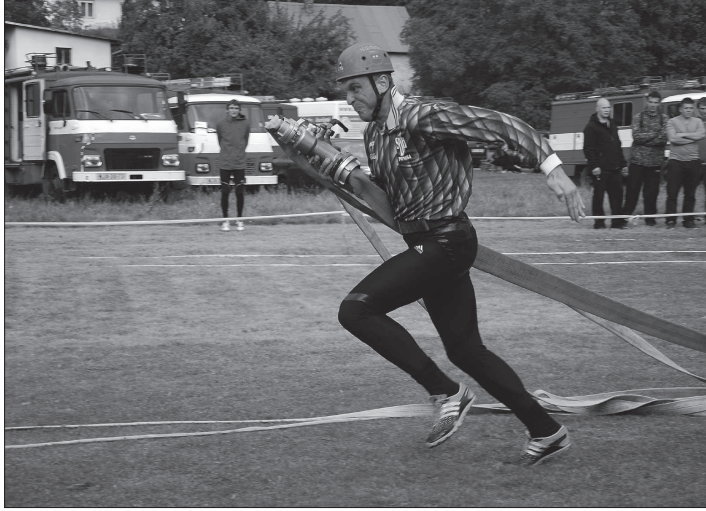
V rámci pohárové soutěže v Lubině selhala časomíra při požárním útoku družstva Mníší. To spolu s dalšími deseti družstvy včetně domácího muselo útok opakovat.

Letos si v kategorii mužů nejlépe vedlo družstvo Výškovic, které terče shodilo v čase 14,98, druhé místo patřilo loňskému vítězi – týmu Hukovic a třetí příčku obsadil Horní Žukov. V ženských týmech vyhrálo družstvo Tisků před Hostašovicemi a Vlkovicemi. Domácí družstvo žen útok nedokončilo.