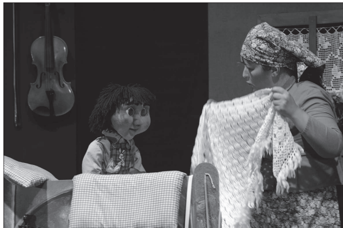
Kopřivnický loutkohercecký soubor Rolnička se po delší pauze objevil na jevišti a v neděli odpoledne zahrál v Katolickém domě v Lubině pohádkovou hru Budulínka.