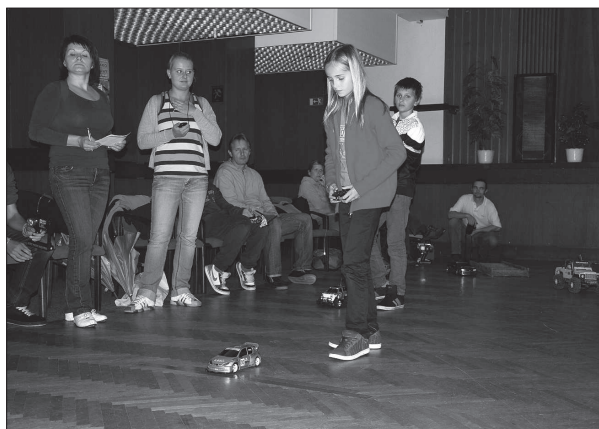
Modely autíček soutěžili nejen kluci, ale i pár děvčat. Všichni museli projet předepsanou trať, o vítězi rozhodoval čas.