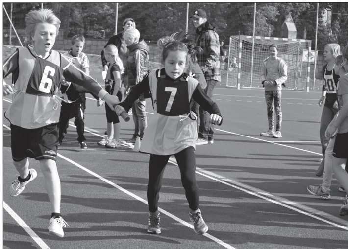
Běh po novém umělém povrchu si všechny děti maximálně užívaly. Jen předávky byly místy překerní záležitostí. Tato ovšem vyšla na jedničku.