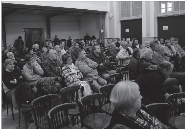
Obyvatelé Lubiny, kteří již brzy budou v referendu rozhodovat o odtržení Lubiny, přišli diskutovat s přípravným výborem. Atmosféra v sále nasvědčovala spíše tomu, že rozhodnutí o osamostatnění Lubiny bude negativní.

Další z kuriózních prohlášení se neslo v tom duchu, že zatímco obyvatelé Kopřivnice si možná již brzy budou muset díky údajné snaze evropských úřadů nainstalovat čistícíky ovzduší a platit za čistění vzduchu, samostatná Lubina by se tomu prý mohla snadněji vyhnout. Z tábora odpůrců odtržení zase padlo při diskuzi o možném finančním kolapsu obce srovnání se zbankrotovaným americkým velkoměstem Detroitem.