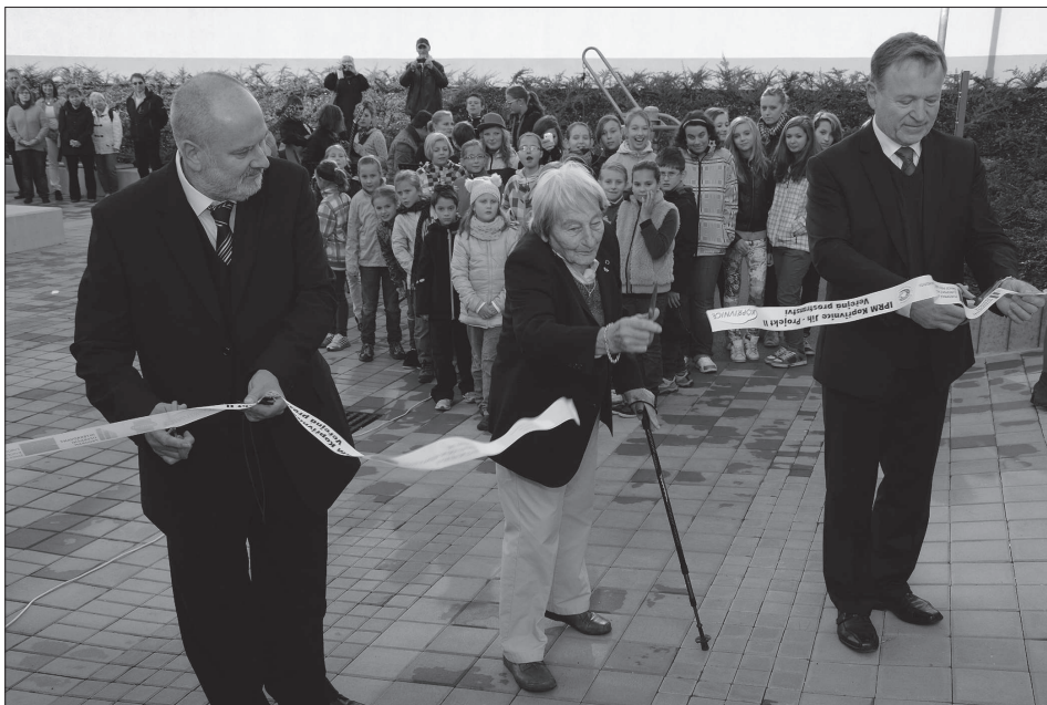
Olympionička a čestná občanka Kopřivnice Dana Zátopková byla tou osobou, která přestřižením pásky slavnostně otevřela nové sportovní hřiště v areálu ZŠ Alšova.

Závodníky vyslala 21. září v Kopřivnici na trať tradičně Dana Zátopková, olympijská vítězka v hodu oštěpem a manželka již zesnulého slavného kopřivnického vytrvalce Emila Zátopky, jenž je čtyřnásobným olympijským vítězem. (Pokračování na straně 8)