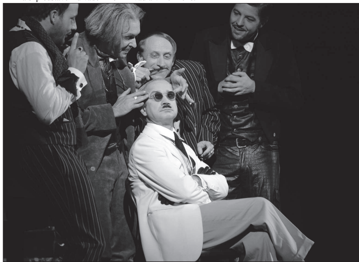
Herce z ostravské Komorní scény Aréna otevřeli novou divadelní sezону v Kopřivnici inscenací Gogolových Hráčů.

abonmá se chystá na 10. října, kdy do Kopřivnice dorazí Hana Maciuchová a Jaroslav Satoranský s komorní komedií Ještětka na slunci z repertoáru pražského Divadla v Řeznické.