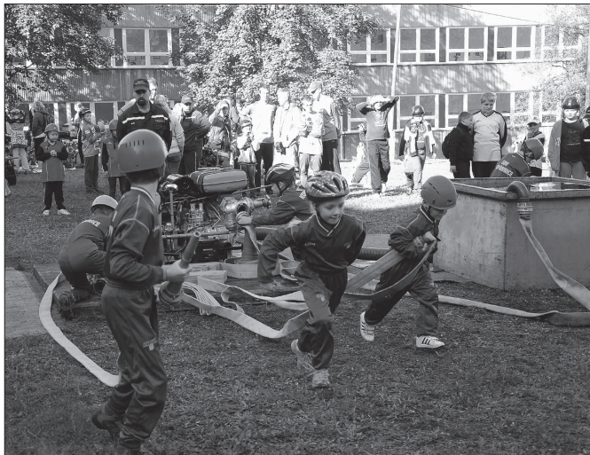
Kopřivnický tým mladších žáků skončil se čtrnácti družstev na devátém místě. Zapálení a bojovnost jim však nechyběla, stejně jako hlasitá podpora velitele i rodičů.

Výsledky: mladší žáci (14 družstev): 1. Tisek, 2. Lubojaty A, 3. Mořkov, ... 9. Kopřivnice, 10. Lubina; starší žáci (15 družstev): 1. Trojanovice, 2. Fulnek, 3. Prchalov, ... 9. Lubina, 12. Kopřivnice; dospělí (16 družstev): 1. Tylovice A, 2. Skájov, 3. Studénka-město, ... 7. Závisek, 10. Větkovice, 15. Kopřivnice, 16. Lubina – ženy.