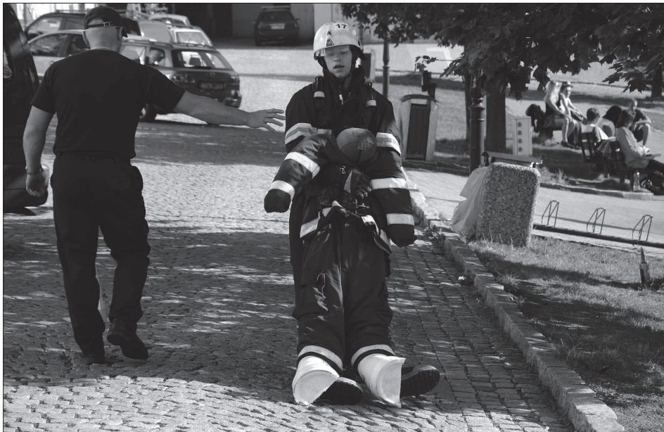
Profesionální i dobrovolní hasiči se minulou sobotu utkali ve finále Poháru ředitele Hasičského záchranného sboru Moravskoslezského kraje v disciplíně TFA. Ve vyčerpávajícím závodě padl také nový trat'ový rekord.

V rámci oprav byly odstraněny jak přeasfaltované úseky, které se už vlivem času opět zvlínily, ale i ostatní větší nerovnosti povrchu komunikace. (Pokračování na straně 2)