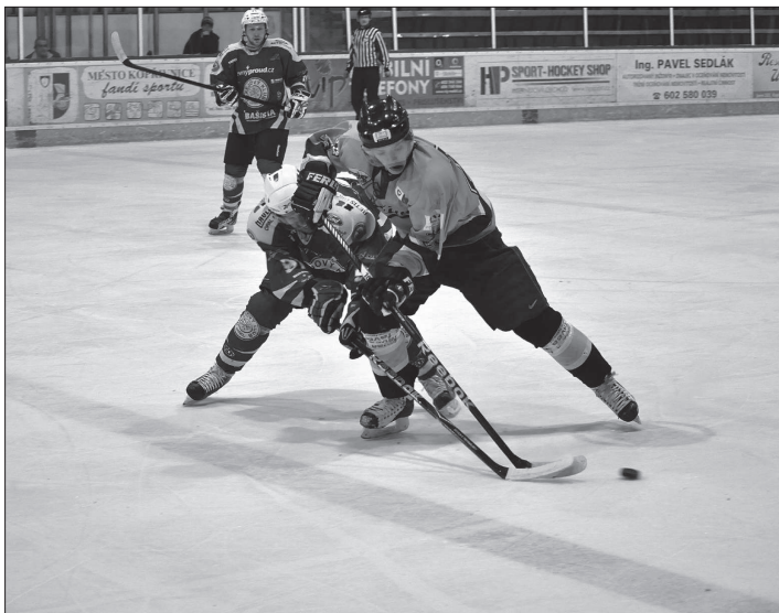
Hokejový klub porušil pravidla při čerpání dotací na nájem sportovišť, když na dotovaném ledě trénovali také muži. Podobných prohřešků se dopustily i další sportovní kluby.

„Prioritní samozřejmě musí zůstat mládež, která je pro rozvoj sportu klíčová, ale sportování mládeže a dospělých jsou spojitě nádobí. Pokud mládež nemá vzory v mužských kategoriích, mají i nižší motivaci k trénování a je daleko složitější je pro sport získat. Proto je i určitá podpora sportování dospělých důležitá, navíc jde také o reprezentaci města,“ řekl na adresu filozofie budoucích pravidel dotační podpory sportu Miroslav Bartoň.