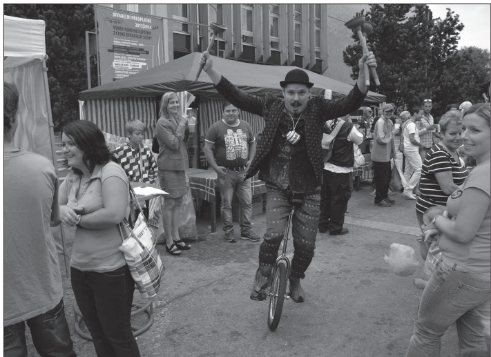
Součástí poutového ruchu bylo také jarmareční představení Divadla Continuo. Artisté a herci s loutkami či na chůdkách bavili návštěvníky poutě v prostoru před kulturním domem.

Lichnov (dam) - Lichnov slaví o nadcházejícím víkendu 720 let od první písemné zmínky o obci. V pátek v patnáct hodin budou do speciální časové schránky uloženy písemnosti pro budoucí generace. Hlavní část oslav ale proběhne až v sobotu 31. srpna. Po třetí hodině odpolední čeká na návštěvníky taneční Mostárny divadelní představení o Lichnově v podání ochotnického souboru Pod Věží ze Štamberka. Následně bude koncertovat dechová hudba Javoňka, od devatenácti hodin pak Banjo Band Ivana Mládky, v devět večer jej vystřídá Rock & Roll Band Marcela Woodmana a následně pak ještě Kabát Revival Morava. V průběhu dne budou navíc připraveny soutěže pro děti a dospěle může zaujmout výstava o historii Lichnova ve fotografiích.