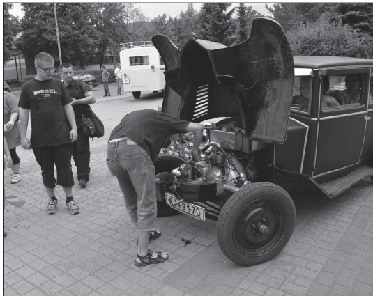
Automobiloví veteráni zažili minulou neděli perný den, když v rámci putě svezli asi šest set zájemců.

Veteráni nezmizí z kopřivnických ulic ani tento týden. Dnes odpolodne se ve městě zastaví kolona Moravia Rallye a v sobotu 31. srpna se pak Kopřivnice stane jedním z bodů na trase tradiční Veteran Rallye Beskydy, v rámci které si lidé před radnicí v jedenáct hodin dopolodne budou moci vychutnat i zručnost řidičů automobilových dědečků.