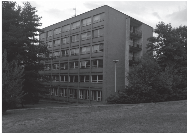
Objekt někdejších internátů už zdejší střední škola nevyužívá a jejich zřizovatel Moravskoslezský kraj zvažuje jeho prodej v aukci.

V kopřivnické občanské poradně se lidé nejčastěji ptají na dluhovou problematiku, exekuce či oddlužení. Zájem je také o poradenství v pracovněprávních vztazích či o rodinné poradenství. Kromě toho odborníci v poradně dokáží klientům pomoci s občansko-soudním řízením a jeho alternativami, ochranou spotřebitele, bydlením a podobně.