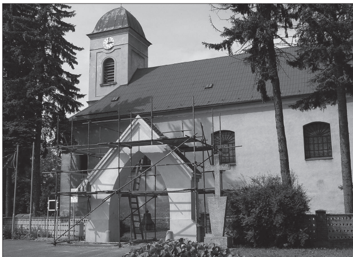
Vstupní brána k mošnovskému kostelu, která se nachází v samém centru obce, se v letošním roce dočkala opravy. Chybí pouze kosmetické úpravy.

Během dopoledního programu se představí v netradiční soutěži v požárním útoku pozvaná družstva na hřišti TJ. Odpoledne od 13 hodin projde obcí průvod hasičské techniky, na který navážou ukázky hasičů při hašení koňkou, hasičskými přístroji nebo lehkou pěnou a soutěže pro rodiče a děti, dopravní hřiště, skákači hrad a výstava hasičské techniky. Oslavy budou zakončeny v 21 hodin slavnostním ohňostrojem.