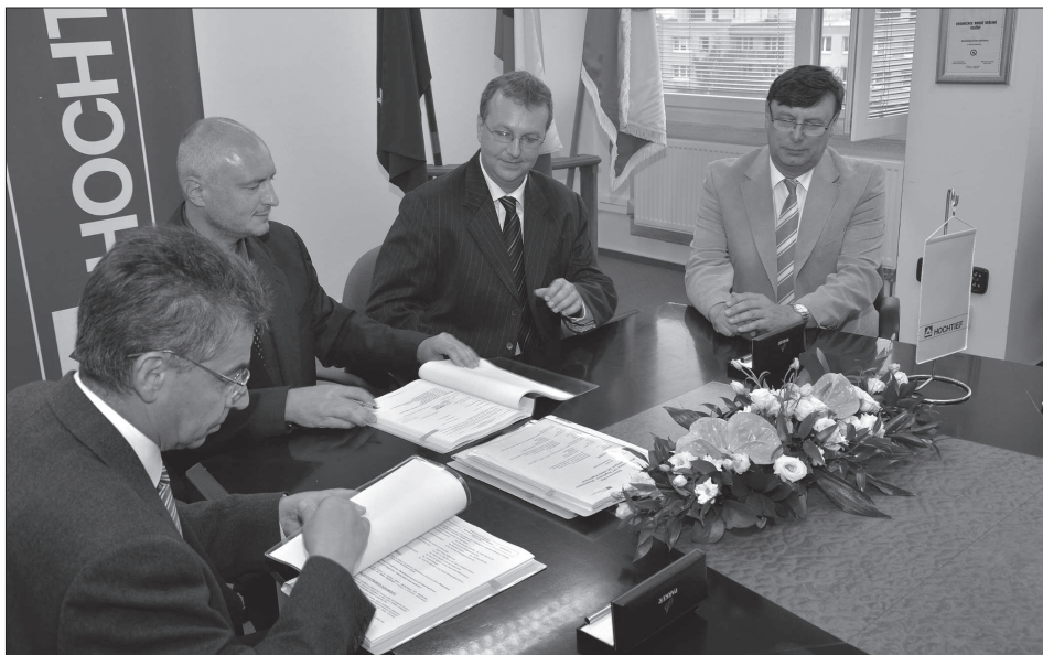
Zastupitelé společnosti Tepla Kopřivnice podepsali smlouvu se stavební firmou, která by zhruba za měsíc měla začít se stavbou nových tepelných rozvodů a objektových předávacích stanic v celé Kopřivnici.