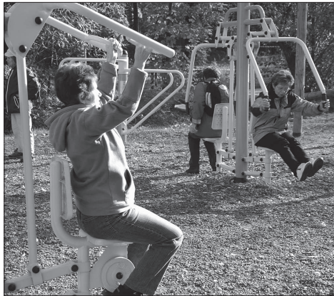
Také letos si budou moci senioři vyzkoušet na Vanaivanu cvičení na venkovních posilovacích strojích.