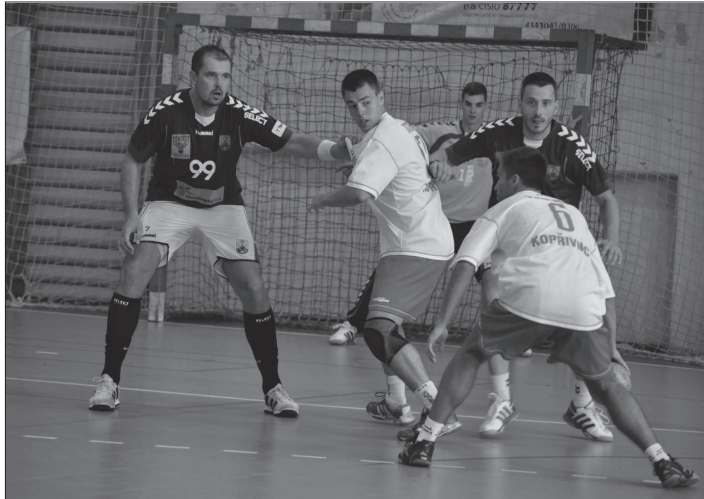
Utíkáni s Hranicemi se na turnaji „Tatry“ Kopřivnici příliš nevyvedlo. Utekli ji začátek a nakonec prohrála 30:35. Frýdek a Saľu ale porazila a skončila druhá.

Naopak zápas s Hranicemi Kopřivnice vůbec nevyšel podle představ. Utekli ji začátek (1:8), což s takovým soupeřem nemůže zůstat bez následků. V zápasě následně prohrávala až o čtrnáct branek a teprve šňitrou devíti branek převážně z rychlých útoků v samotném závěru zápasu skóre korigovala na konečných 30:35. „Prvních patnáct minut byl totální výbuch, všichni si