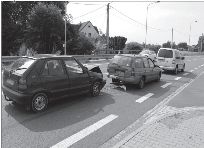
Nehoda tří osobních automobilů v Lubině měla kuriózní příčinu. Na počátku srážky byla divoká kačhna, které se řidič snažil dát přednost, a vozidla za ním již věs nezareagovala.