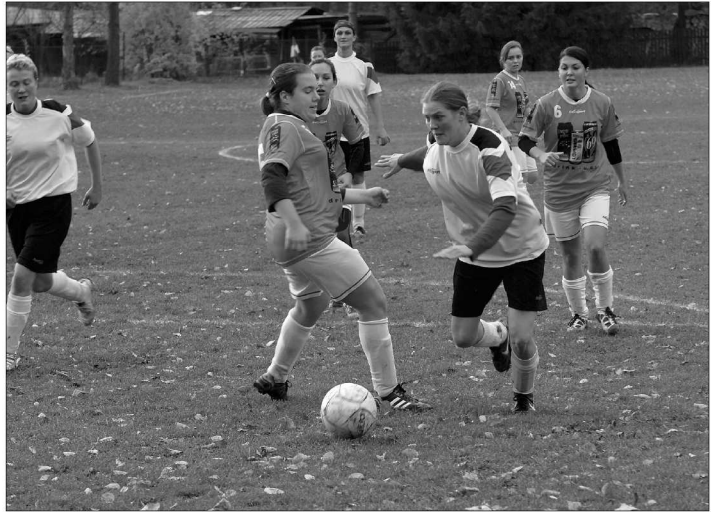
Lubina v nedělním 12. kole MS divize porazila jasně Trojanovice-Bystře. Na kontě tak má za celý pod- zim zatím jen dvě porážky, a to od Havířova a Stachovic.