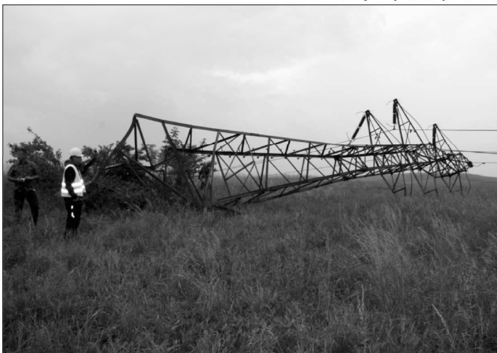
Skupina zlodějů, jejichž řádění mělo za následek pád několika elektrických sloupů mezi Kateřiněm a Hájovem, už je v rukou policie.