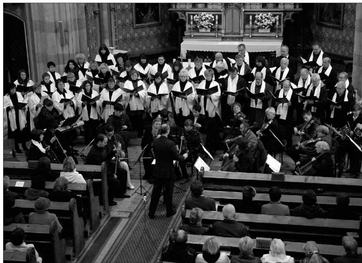
Kopřivnický komorní orchestr a novojičínský sbor Ondráš spojily síly v sérii čtyř dušičkových koncertů.

Kromě klání tanečních párů druhé nejvyšší kategorie v pěti standardních a pěti latinskoamerických tancích nabídne Tatra i bohatý doprovodný program. Diváci se mohou těšit na taneční skupinu Mighty Shake, soubor středověkého tance Hortus Gratiae, duo electro-boogie Hybrid's Crew, ale také místní tanečníky. Podrobnější informace o místní taneční události roku najdete v příštím čísle KN.