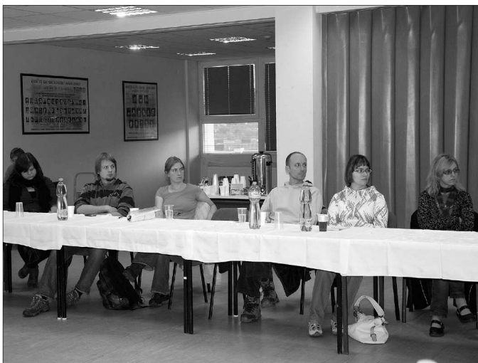
Lidé v pracovních skupinách diskutovali o kvalitách nabízených sociálních služeb a také o možnostech jejich dalšího rozvoje.

poskytovatelé sociálních služeb. Ti se zabývali především podněty vzešlými z ostatních skupin. „Během jednání všech skupin zaznělo, že občané by měli být více informováni o nabídce poskytovaných sociálních služeb ve městě, protože situace lidí se mění, aby v případě aktuální potřeby věděli, na koho se obrátit. Proto i v příštím roce budeme pořádat Den sociálních služeb, jenž je občany hojně navštěvován, a organizace poskytující sociální služby na něm mohou svou práci lidem přiblížit. Poskytovatelé by si také přáli, aby se zvyšovala společenská prestiž pracovníků v sociálních službách. S tímto cílem navrhneme do KPSS uskutečnění vhodné společenské akce, na které bude možné také ocenit nejaktivnější profesionální i dobrovolníky,“ uvedla místostarostka Dagmar Rysová, jež je garantkou sociální oblasti a zdravotnictví.