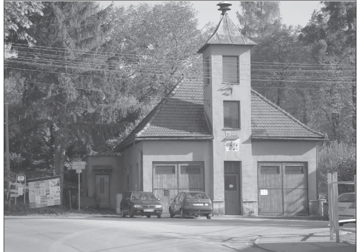
I na rekonstrukci zbrojnice ve Větrčovicích chtěla radnice získat peníze z Regionálního operačního programu. Nyní zvažuje, jaká bude budoucnost záměru bez finanční podpory z EU.

Dokument Analýza a vyhodnocení základních ukazatelů zdravotního stavu, jenž vznikl v rámci projektu Kopřivnického roku aktivního stárnutí a mezigenerační spolupráce a byl financován z dotačního programu Moravskoslezského kraje na podporu místní Agendy 21, je zveřejněn na webu města.