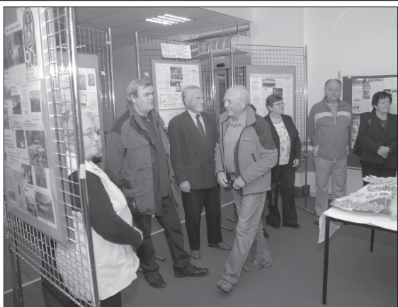
Vernisáž výstavy z historie sboru byla další z událostí, kterou si Pěvecké sdružení Kopřivnice připomenulo devadesát let své existence.