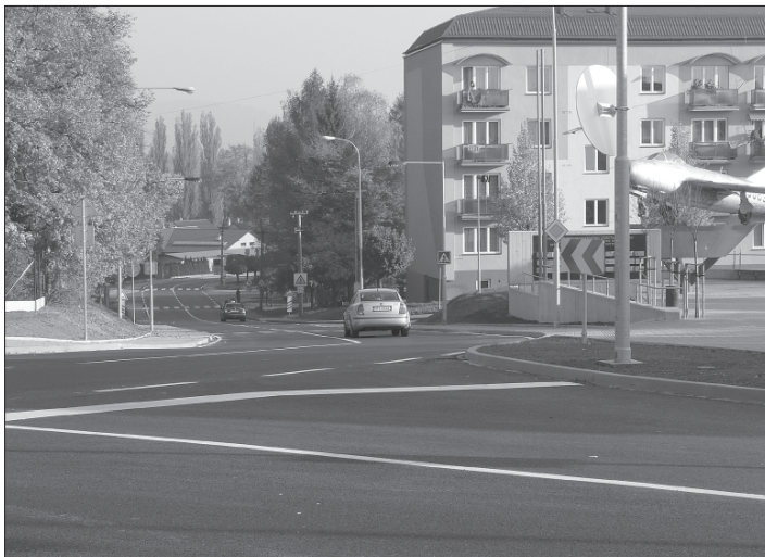
Prostor příbořské křižovatky u letadla se po nedávno skončené rekonstrukci stal přehlednějším a měl by být bezpečnější jak pro chodce, tak pro motoristy.

Druhá etapa odstartovala 1. července úplnou uzavěrou silnice I/58 v úseku od křižovatky ulic Frenštátské a Čs. armády po křižovatku ulic Komenského a Jičínské, která na tři měsíce výrazně omezovala dopravu. Tato část díla zahrnovala další přeložky inženýrských sítí navazující na první etapu a změnu tvaru křižovatky „u letadla“. Z původního křížení pěti silnic se zaslepením ulice Komenského podél letadla se stala klasická křižovatka. Celková úprava terénu přispěla k větší přehlednosti křižovatky a ke zvýšení bezpečnosti jak řidičů, tak chodců. Dále byly zbudovány nové autobusové zastávky, chodníky a tři přechody pro chodce, vše v souladu s předpisy o bezbariérovosti staveb. Bylo instalováno nové veřejné osvětlení a dopravní značení. Práci na křižovatce využily i další subjekty. Severomoravské vodovody a kanalizace provedly rekonstrukci svých rozvodů od křižovatky Jičínská - Komenského až po křižovatku Frenštátská - Čs. armády. Realizaci rekonstrukce křižovatky oceňují z bezpečnostního hlediska nejen řidiči, ale i chodci, nepřehlédnutelnou stránkou je i estetické provedení zastávek.