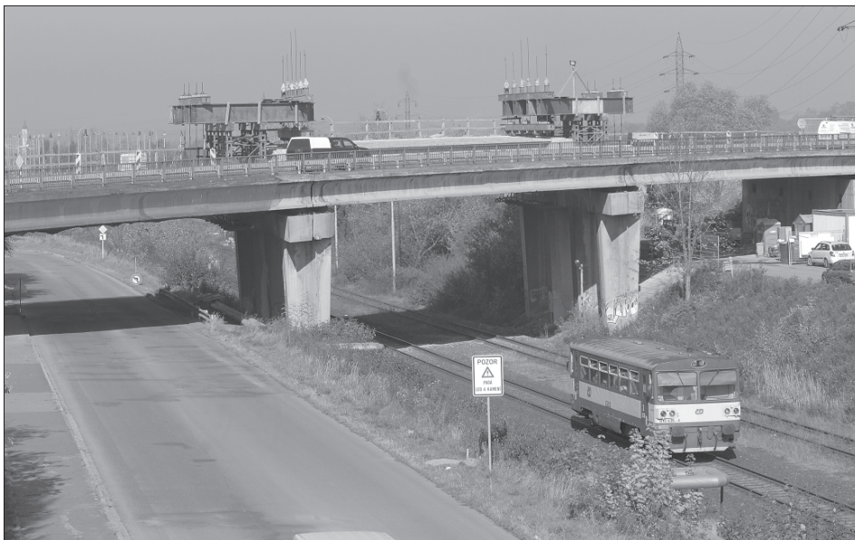
Práce na opravách silničního mostu pokračují. Pod zvednutou polovinou mostovky se pracuje na čištění nosníků a výměně ložisek. Práce zatím pokračují podle harmonogramu, zbrzdit je mohou až nevhodné klimatické podmínky.