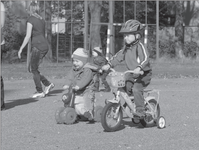
Mateřské centrum Klokán pořádalo už po osmé svůj Kočkoběh. Veselé závody na kolech, odrážedlech, ale třeba i v běhu byly určeny nejmenším dětem.

Kromě všedního provozu v Klokánku připravují už i další akce. Broučkáda bude pro děti a jejich rodiče připravena ve středu 31. října. To děti vyrazí na cestu, kde budou plnit nejrůznější úkoly ve stylu Karafiátových Broučků s lucerničkami.