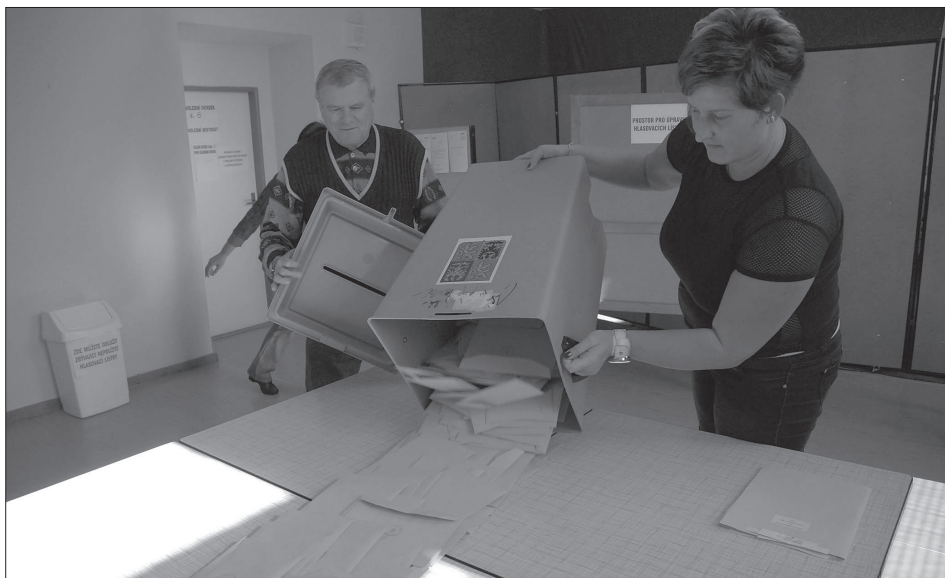
Volební komise měly při posledních volbách o něco méně práce. K volebním urnám totiž dorazila necelá třetina oprávněných voličů. Největší volební zisk zaznamenala po čtyřech letech znovu ČSSD.