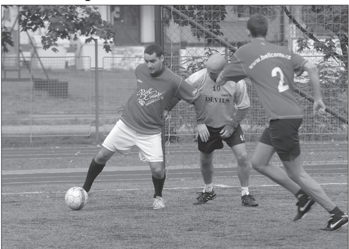
On víkend se hrál závěrečný turnaj I. ligy KMK. Posledním ligovým kláním bude tuto sobotu kvalifikace o I. ligu KMK, v níž se střetnou celkem čtyři mužstva.