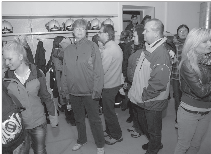
Stovky lidí využily ojedinělou možnost podívat se také do zázemí kopřivnické jednotky sboru dobrovolných hasičů v rekonstruované budově.