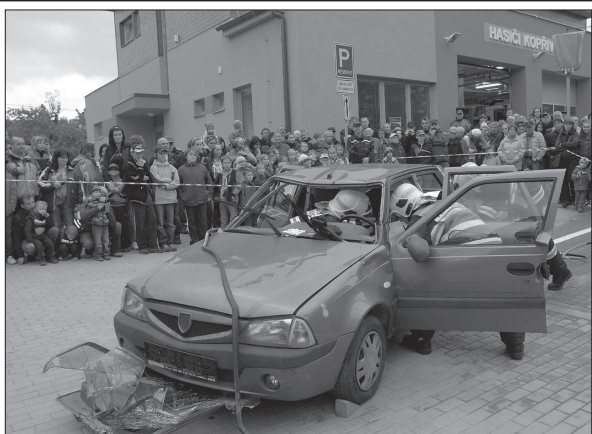
Součástí slavnostního otevření nové hasičské zbrojnice v Kopřivnici byla také ukázka zásahu při dopravní nehodě.