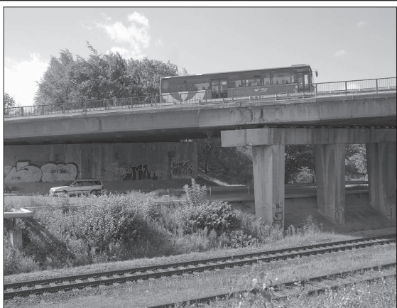
Rekonstrukce mostu včetně vybudování sjezdu na ulici Dělnickou bude probíhat až do jara 2014.