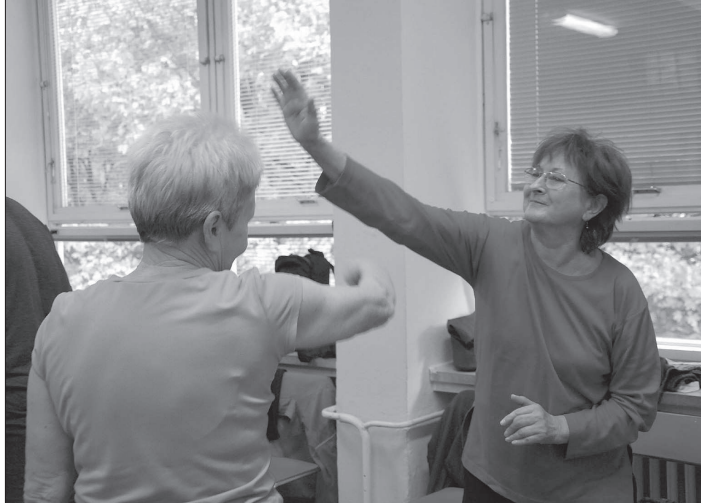
Také letos bude probíhat kurz sebeobrany, který se vloni těšil velkému zájmu mezi seniory. Většina jeho absolventů se rozhodla i pro další kurz.