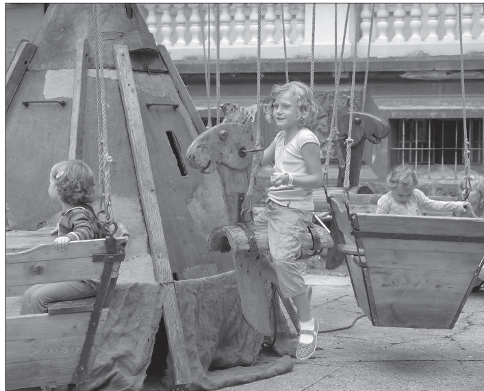
Letošní jarmark se stylizoval do období první republiky. Děti si mohly vyzkoušet mimo jiné také repliku historického kolotoče.