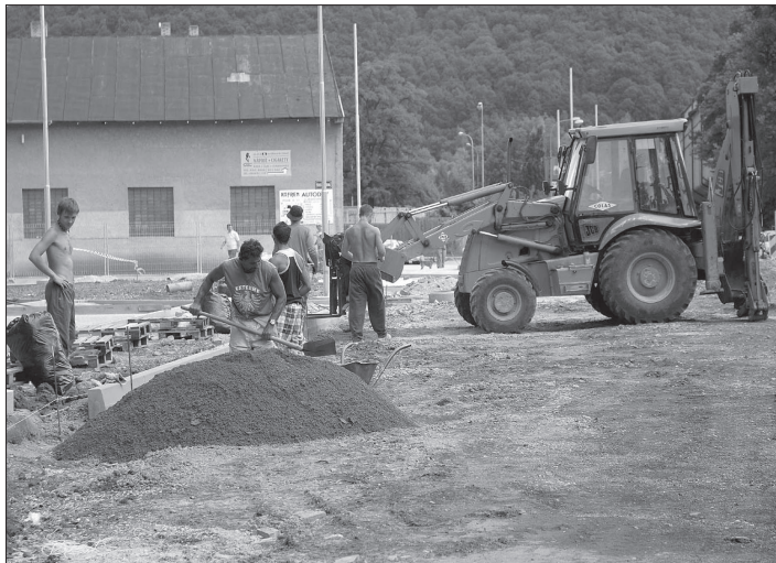
Práce na okružní křižovatce u Katolického domu pokračují podle plánu. Na konci září, nejspíše počátkem října by měl být pokládán na komunikaci finální povrch.

Už nyní Běh rodným krajem Emila Zátoka předznamenává výstava fotografií ve vestibulu radnice.