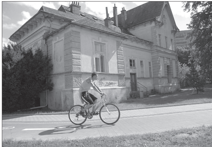
Dva z projektů, které se ucházely o evropské dotace. Zatímco cyklostezka kolem Kopřivnický podporu získala, nákladnou rekonstrukci loutkového divadla Regionální rada nepodpořila.