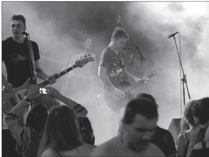
Bartholomějský večer se i letos nesl v duchu přehlídky místních kapel. Zaplněnému centru města se mimo jiné představila také pohádkorová kapela Today Ashley.

Hlavním tahákem programu pak bude koncert ostravské kapely Buty. Na rozdíl od zbytku programu nevystoupí na hradě, ale v amfiteátru v oboře a hrát začne o půl čtvrté odpoledne.