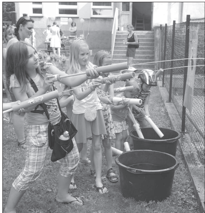
Jednou z doprovodných aktivit, které na děti čekaly na akci Bum bác!, byla střelba z vodních pistolí na terč.

„V současné době nejsou tyto činnosti, vyjma doby nočního klidu, nijak regulovány. Město Kopřivnice uvažovalo o regulaci hlučných činností formou obecně závazné vyhlášky, výsledky ankety mezi občany města však ukázaly, že tyto aktivity občany příliš netrápí. Jako problém je vnímán spíše hluk z dopravy, který však obecně závaznou vyhláškou města regulovat nelze,“ uvedl Jaroslav Jiřík z odboru životního prostředí. Aby se předešlo stížnostem, žádá radnice občany města, aby alespoň v neděli omezili hlučné činnosti na minimum. „Tím dojde k zachování příznivého prostředí pro regeneraci fyzických i psychických sil každého z nás,“ dodal Jaroslav Jiřík.