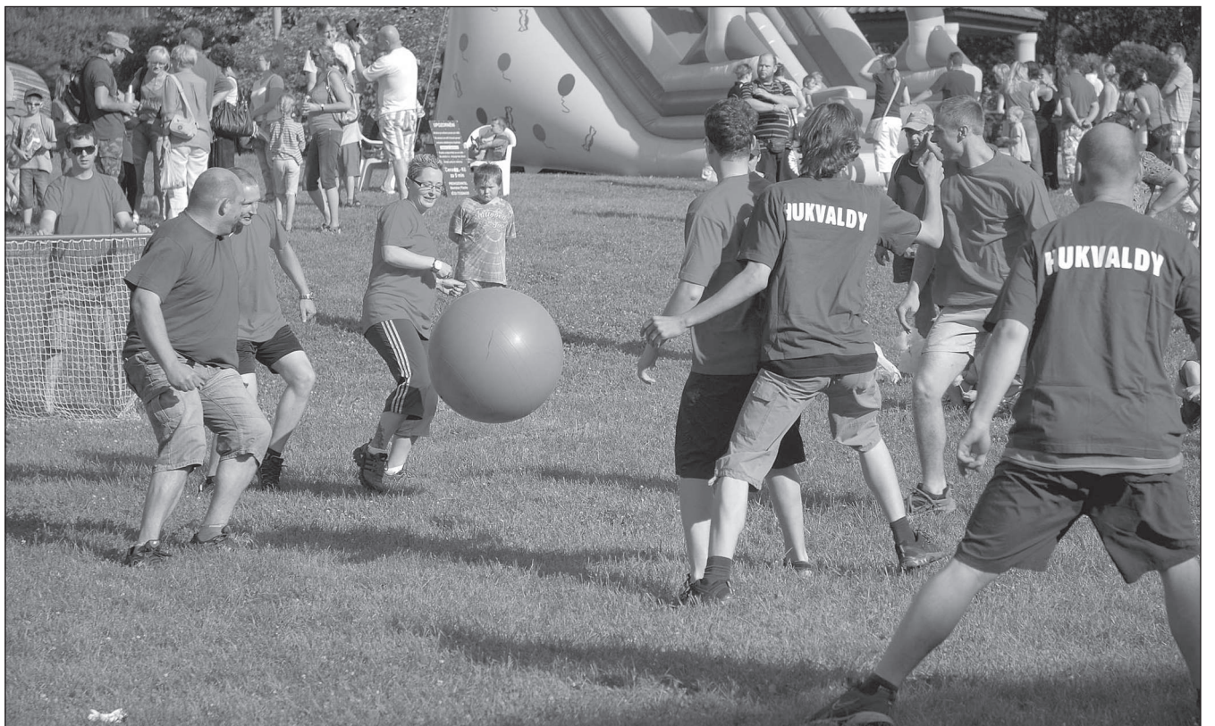
Za velkého zájmu veřejnosti se Lašským laškováním s provozováním kulturního domu rozloučila CK Agentura Fox. Součástí zábavného programu pro celou rodinu byly mimo jiné také recesní soutěže týmů jednotlivých měst Lašské brány.