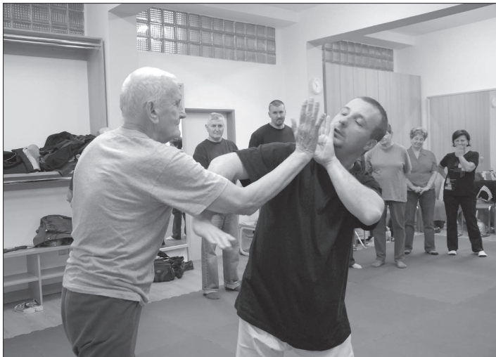
Na kurzu sebeobrany určeném seniorům se starší lidé od zkušených lektorů učí také základní chvaty, které by měly případné útočníky odradit.