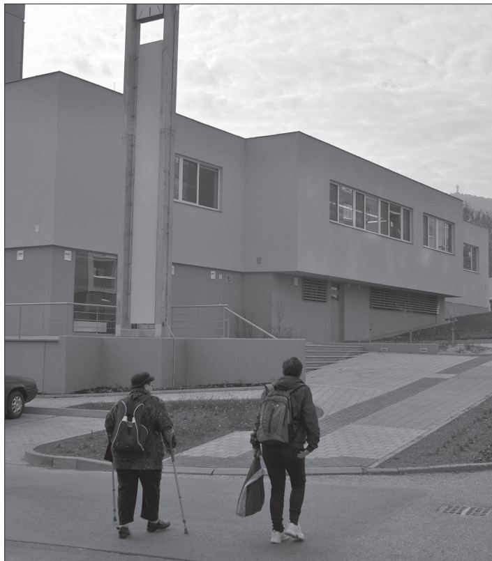
Už od úterý se v nově vybudované stravovně na ulici České rozjel běžný provoz. Slavnostní otevření jedné z největších investic města za poslední dobu je naplánováno na závěr listopadu.