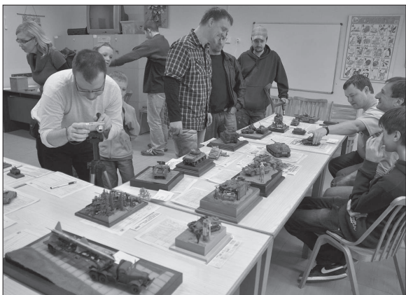
Soutěžící modely na jedenáctém ročníku Kopřivnických pohárů se těšily zájmu diváků. Přišlo jich na 150.