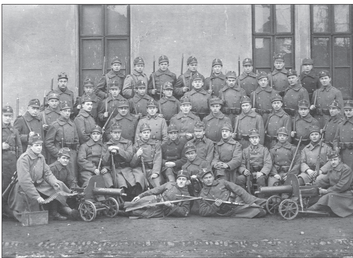
Kopřivničtí dobrovolníci v Neumannových dělnických kasárnách ve Frýdku v lednu 1919.

Z Hronské Bereznice štábníci dále obsadili Banskou Štiavnici a Levice a pak se pustit dále na Zvolen. K tomu však již nedošlo, protože přicházející posily, které