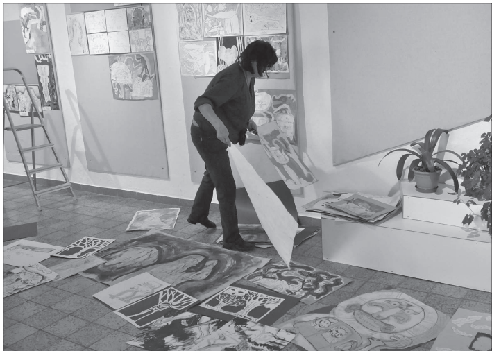
V době uzávěrky tohoto čísla KN ještě probíhaly práce na instalaci výstavy Svět dobrodružství a fantazie. V ZŠ Zdeňka Buriana bude k vidění do konce listopadu.

Na jarní výroční výstavě už podle jeho slov potvrdily účast všechny školy z Kopřivnice i ZŠ Štramberk. Ovšem i aktuální soutěž obslaly svými pracemi všechny místní školy.