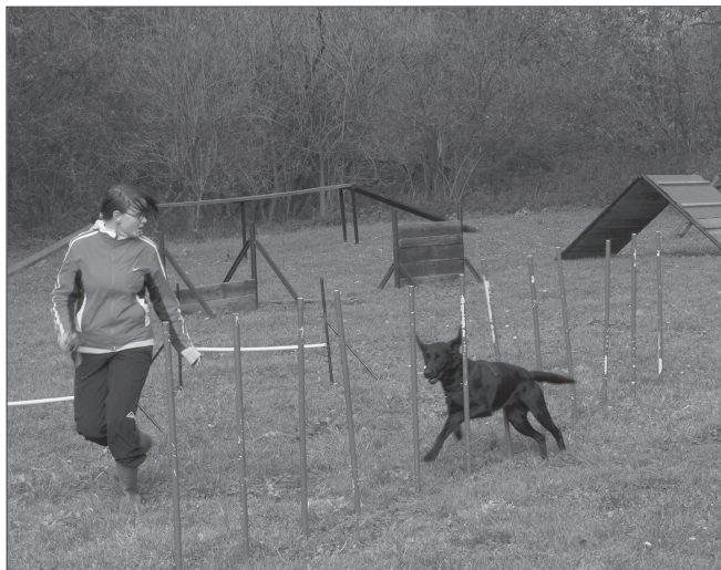
Zvládnout slalom mezi tyčkami byl oříškem nejen pro psy, ale hlavně pro jejich majitele. Při zvládnutí všech překážek se používala motivační technika.

Štramberký kynologický klub má ve svých řadách čtyřicetku členů, kteří se na cvičišti pod hrází retenční nádrže scházejí každou středu a nedělí. Pro členy a jejich čtyřnohé přátele pravidelně připravují pobytové akce, závody, veřejnosti se představují při různých akcích s ukázkami výcviku psů nebo při kanisterapii. „Pomáháme připravovat psy na výstavy, máme mezi sebou jak šampiony krásy, tak účastníky mistrovství republiky ve výcviku,“ přiblížila jednatelka rozsah aktivit. Podle jejich slov neexistuje pes, který se nedá zvládnout. Záležet pouze na povaze psa a hlavně zkušenosti psůvoda.